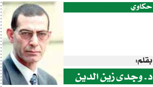
بقلم: د. وجدى زين الدين

كتب- اسراء عادل: سيطر النجم كيليان مورفى على موسم الجوائز وذلك بحصوله على أعلى جائزة تمثيل فى أيرلندا، بعد ما تم اختياره كأفضل ممثل رئيسى على حفل توزيع جوائز أكاديمية السينما والتلفزيون الأيرلندى الحادى والعشرين من دوره فى فيلم «Oppenheimer»، لتضاف الجائزة لسلسلة جوائز أوسكار واليافتا وجولدن جلوب وBAFTA. تحدث كيليان مورفى خلال الحفل الذى أقيم فى مركز دبلن الملكى للمؤتمرات، «الوجود فى هذه الغرفة أمر مميز للغاية، إن أكون فى موطئى، مع الأشخاص الذين أحبهم وأعجب بهم من بين زملائى المرشحين وبعض الأشخاص المفضلين لدى، إنه شعور جميل أن تكون فى المنزل مع العديد من الأصدقاء والزملاء». تتنافس كيليان مورفى على جائزة أفضل ممثل أمام كوكبة من النجوم، أبرزهم أندرو سكوت عن دوره فى فيلم «All of Us Strangers»، ونيدى ويلموت عن دوره فى فيلم «Lies, We Tell That They May Face»، وبارى وارد عن دوره فى فيلم «The Rising Sun»، وبيرس بروسنان عن «The Rifleman».