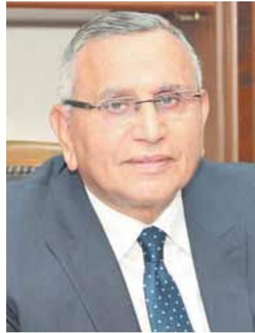
د. عبدالسند يمامة

هنأ الدكتور عبدالسند يمامة رئيس الوفد الرئيس عبدالفتاح السيسي رئيس الجمهورية القائد الأعلى للقوات المسلحة- والفريق أول محمد زكي القائد العام للقوات المسلحة، وزير الدفاع والإنتاج الحربى والقوات المسلحة المصرية قادة وضباط وجنودنا، وجموع الشعب المصرى، بمناسبة ذكرى «تحرير سيناء» الحبيبة التى توافق ٢٥ أبريل من كل عام. وووجه رئيس الوفد التحية والتقدير إلى قادة وضباط وجنود القوات المسلحة البواسل وإلى الشعب المصرى المدافع عن تراب وطنه بمناسبة ذكرى تحرير سيناء الغالية، مؤكداً أن تحرير سيناء الحبيبة ما كان ليتم إلا ببذل أرواح الشهداء والجهد والمثابرة، حتى استطعنا تحرير آخر شبر محتل من أرض مصرنا الغالية.