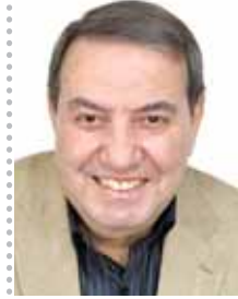
بقلم: عبد العظيم الباسل