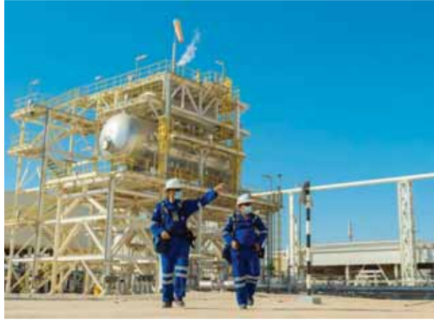
جانب من الأنشطة الإنتاجية في سلطنة عُمان

صعود معدلات التوظيف وعلى صعيد سوق العمل، قال الصندوق إن معدلات التشغيل شهدت تصاعداً تدريجياً بالتزامن مع تعافي الأنشطة الاقتصادية من الجائحة، فقد بلغ معدل الباحثين عن عمل في عُمان ٢,٥ في المائة بنهاية شهر أكتوبر ٢٠٢١ مع استمرار الجهود الوطنية لاستيعاب الباحثين عن عمل، ونتج عن هذه الجهود ارتفاع العمانيين العاملين في القطاع الخاص بنسبة ٣,٣ مقارنة بشهر نوفمبر من عام ٢٠٢١، وتوقع الصندوق أن القطاع الخاص سيكون الموقر الأكبر لفرص التوظيف مع التزام الحكومة بخفض تكاليف أعداد العاملين في القطاع العام تماشياً مع خطط ترشيد الجهاز الإداري للدولة، وأنه من المرجح أن تؤدي قطاعات الصناعات التحويلية، واللوجستيات والسياحة والتجارة دوراً محورياً في توفير فرص العمل للشباب العماني مع اهتمام سلطنة عمان بتعزيز هذه القطاعات خلال المرحلة المقبلة.