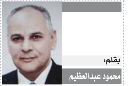
يقلم: محمود عبد العظيم