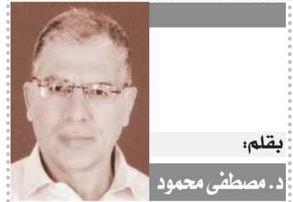
بقلم: د. مصطفى محمود