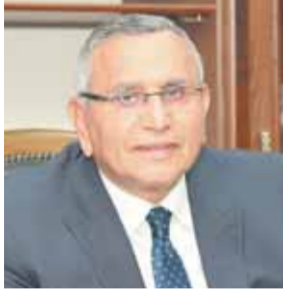
د. عبدالسند يمامة

يهنئ حزب الوفد برئاسة الدكتور عبد السند يمامة، قداسة البابا تواضروس الثانى، بابا الإسكندرية وبطريك الكرازة المرقسية، بمناسبة عيد القيامة المجيد، كما يتوجه بالتهنئة لكل أقباط مصر بهذه المناسبة العطرة، داعياً الله أن ينعم على بلدنا الحبيب مصر بالأمن والخير والسلام. وقال رئيس حزب الوفد، فى بيان، إنه فى الوقت الذى ندعو فيه الله أن تزهر مصر بالتقدم والرخاء فإننا ندعو الله تعالى أيضاً أن يعيد هذه المناسبة الطيبة على أقباط مصر بخالص الصحة والسعادة، وأن يحفظ بلدنا الغالى وشعبه العظيم من كل مكروه أو سوء. وتقدم الدكتور ياسر الهضيبى المتحدث باسم حزب الوفد ونائب رئيس الحزب، بخالص التهانى القلبية للإخوة الأقباط بمناسبة عيد القيامة المجيد، داعياً الله لهم بدوام التوفيق والسداد، ولمصرنا الحبيبة بالمزيد من الرفعة والرخاء.