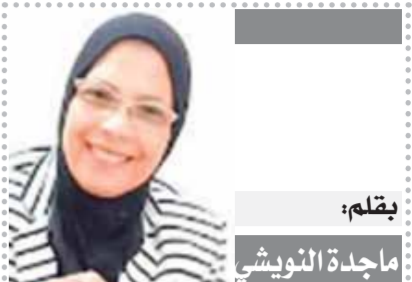
بقلم: ماجدة التوفى