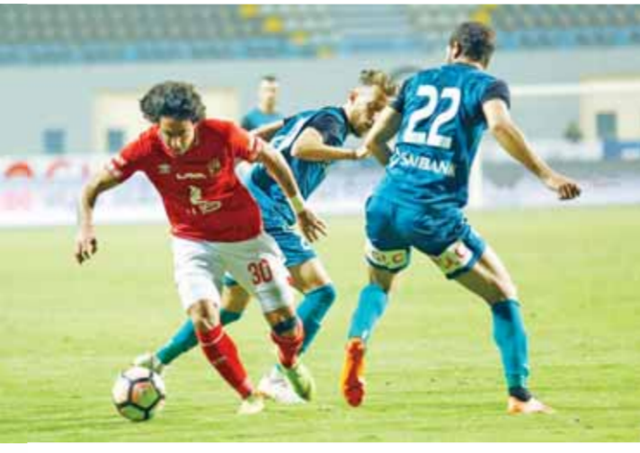
الأهلي يسعى لاسعاده صدارة الدوري