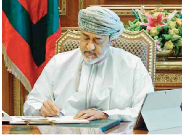
السلطان هيثم بن طارق سلطان عُمان

والمستدامة للإنفاق العام، والاستمرار في رفع مساهمة الإيرادات غير النفطية، وإعلاء الأولوية في تنفيذ المشاريع للقطاعات الإنتاجية، وإعطاء الأولوية لاستكمال برنامج التحول الرقمي، والحفاظ على مستوى الإنفاق في الخدمات الأساسية، وإعادة توجيه الدعم لمستحقيه، واستمرار العمل على تحسين التصنيف الائتماني لسلطنة عمان، والاستمرار في دعم التدريب والتأهيل وإيجاد فرص عمل جديدة، والاستمرار في دعم المؤسسات الصغيرة والمتوسطة.