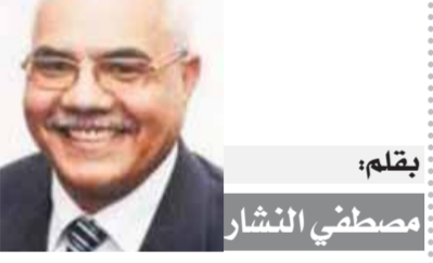
بقلم: مصطفى الشنawy