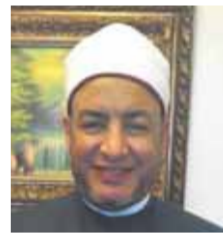
الشيخ محمد ربيع أحمد الإمام والتخطيب بوزارة الأوقاف