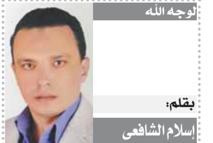
لقوله الله بقلم: اسلام الشافعي