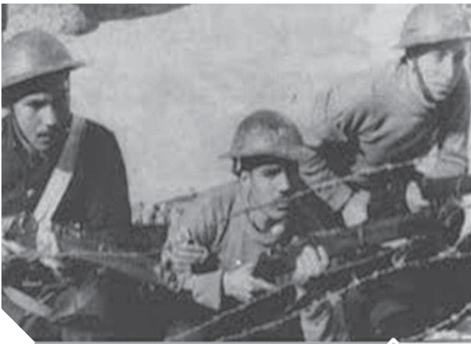
ضباط وعساكر المقاومة المصرية فى الإسماعيلية