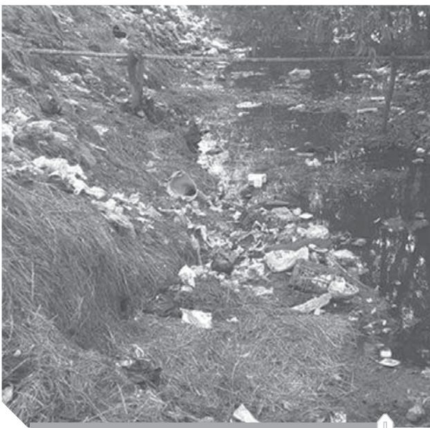
أكوام القمامة داخل مصرف القرية

بجانب أن مياه التربة لا تختلف كثيرا عن مياه المصارف، بعد إلقاء مخلفات الصرف الصحى قبل من قبل بعض أهالى القرى التى تمر على هذه التربة مما ترتب عليه انتشار الامراض بين أهالى القرية والقرى المجاورة لأن المحاصيل تكون محملة بالسوموم والأمراض.