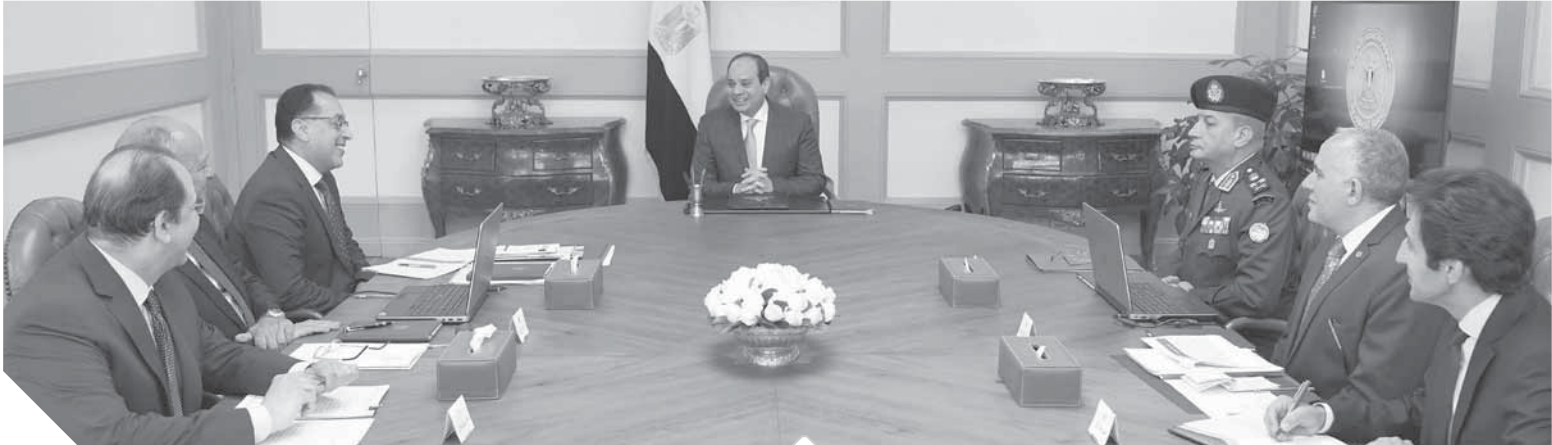
الرئيس السيسي خلال اجتماعه أمس للإطلاع على تطورات مفاوضات سد النهضة

شامل حول قواعد ملء وتشغيل السد، اطلع الرئيس على الموقف التفاوضى فى إطار الرعاية الأمريكية للمفاوضات الثلاثية، كما تم استعراض الموقف المصرى ومحدداته وثوابته فى هذا الخصوص.