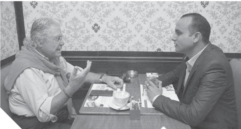
الفنان حسين فهمى أثناء حديثه لـ الوفد ،