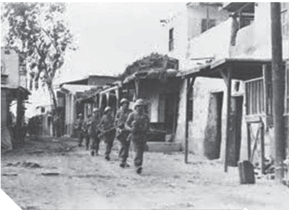
جنود الاحتلال يحاصرون شوارع مديرية الأمن بالإسماعيلية