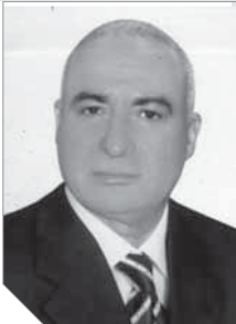
لواء صلاح الدين الشربيني