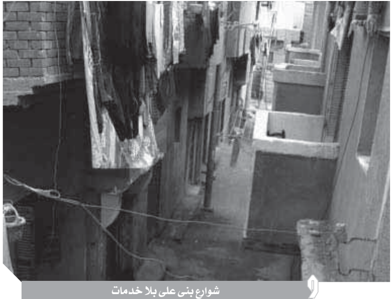
شوارع بنى على بلا خدمات