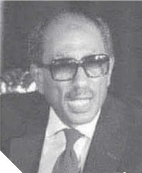
الرئيس أنور السادات

دارت المعركة ساعات وساعات، واستبسل المصريون شرطة ومواطنين فى حماية مدينتهم ورغم الفارق الكبير فى العتاد والسلاح، فقد بقوا صامدين يواجهون الموت بصدر مفتوح، ويقاتلون فى شجاعة وإباء ملحقين بدورهم خسائر لم يتوقعها.