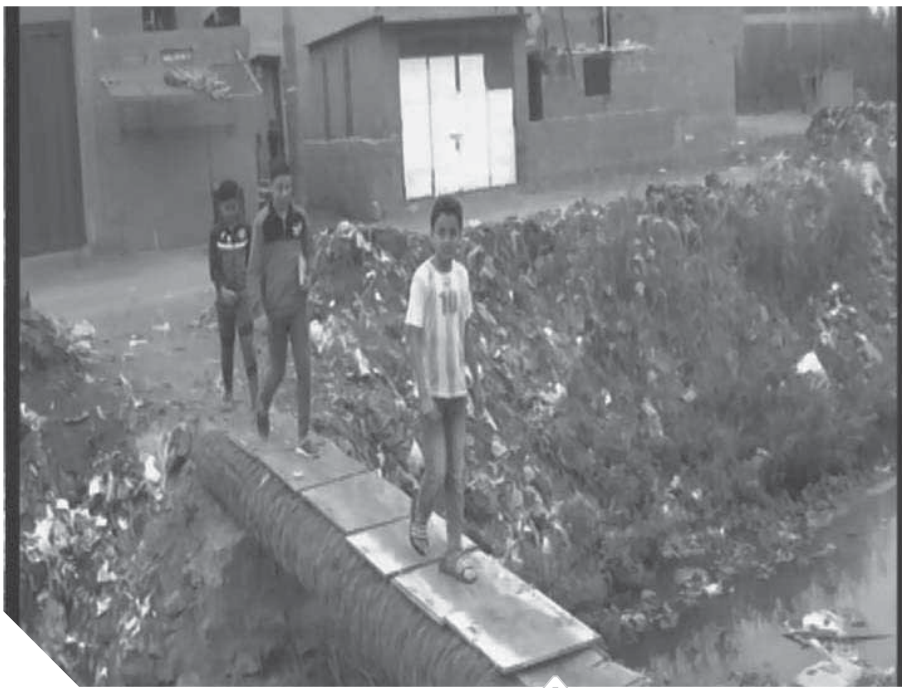
أطفال القرية أثناء عبورهم المصرف

وبالرغم من كل هذه الإمكانيات التى تملكها منطقة شلالات المختلطة إلا أنه لم يتم استغلالها من قبل المسؤولين فى المحافظة لتنشيط الحركة السياحية بالفيوم.