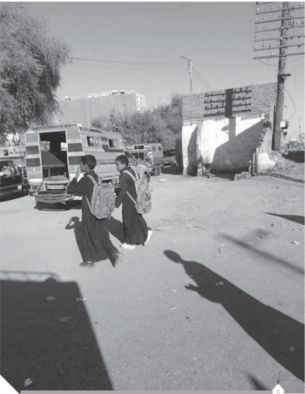
أطفال المدارس أثناء عبورهم طريق قفط - القصير

إن هذا البلد العظيم الذى خصه الله تعالى بالذكر فى كل الكتب السماوية وميزه الله تعالى بأنه المكان الوحيد الذى تجلى فيه سبحانه وتعالى، لقد كان هذا البلد العظيم على مر التاريخ مأوى لكل المظلومين من الأنبياء ومن أهل البيت وغيرهم ومن دخله كان آمناً حتى فى هذا العصر، فإنه يحتضن كل من خرج من بلده يبحث عن الأمن والأمان، فلم يكن لأجناً، وإنما كان من أهل بيته أحتضنه هذا الشعب العظيم الذى عاش على هذا الأرض آلاف السنين يفتضن نيلها كأنه أم تحتضن وليدها ويحتمى بجبلها فهو نيل يجرى فى عروقتها وجبل يحمينا شرقاً وغرباً إنها جغرافية هذا البلد العظيم. ومن العجب أن يكون بلدنا مأوى للمظلومين فى بلادهم على مر العصور، ويخرج البعض يبحث عن مأوى خارجى إلا إذا كان ظالماً فيلدنا مأوى للمظلومين فى بلادهم وطاردة للظالمين أياً ما كانت هويتهم. إنهم مأجورون.