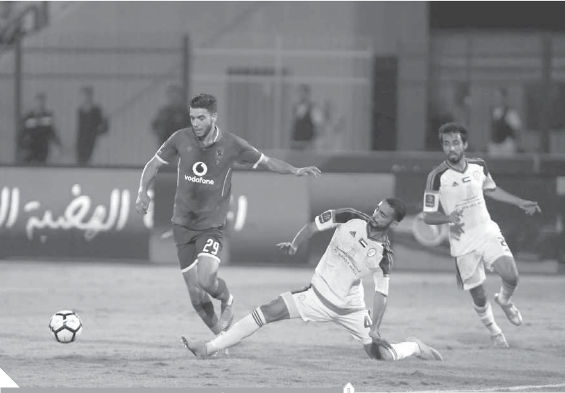
أزارو انتقل للدورى السعودى

وأكد اللاعب أنه قرر ملاحقة منتحل شخصيته قضائياً من أجل الحفاظ على حقوقه، خاصة أنه يقوم بنشر بعض التصريحات التى تسبب له فى النهاية دون أن يتحدث».