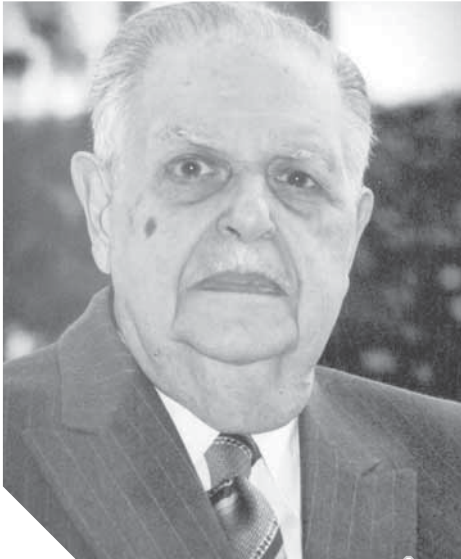
فؤاد باشا سراج الدين

٥٠ شهيدا مصرياً يحفرون أسماءهم فى لوحة الخلود