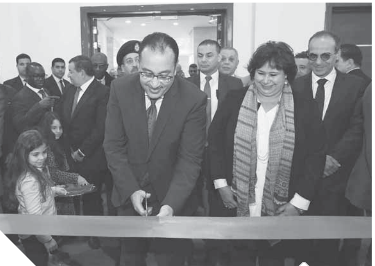
رئيس الوزراء ووزيرة الثقافة أثناء افتتاح الدورة ٥١

موهبته فى الفناء والرقص الشعبى، وعاد للاستماع اليه. وأكد الدكتور مصطفى مدبولى أن هذا المعرض أصبح إحدى أهم الفعاليات الثقافية التى تبرز الجناح الإصدارات الخاصة للأفرع المتخصصة على المستوى، وكذا بزيادة المشاركة هذا العام من مختلف العارضين ودور النشر، وكذا المشاركة الفعالة من الدول العربية والأفريقية. واستمع رئيس الوزراء خلال الجولة إلى شرح من وزيرة الثقافة حول المعرض، والتي أشارت إلى أن الدكتور جمال حداد، اختير