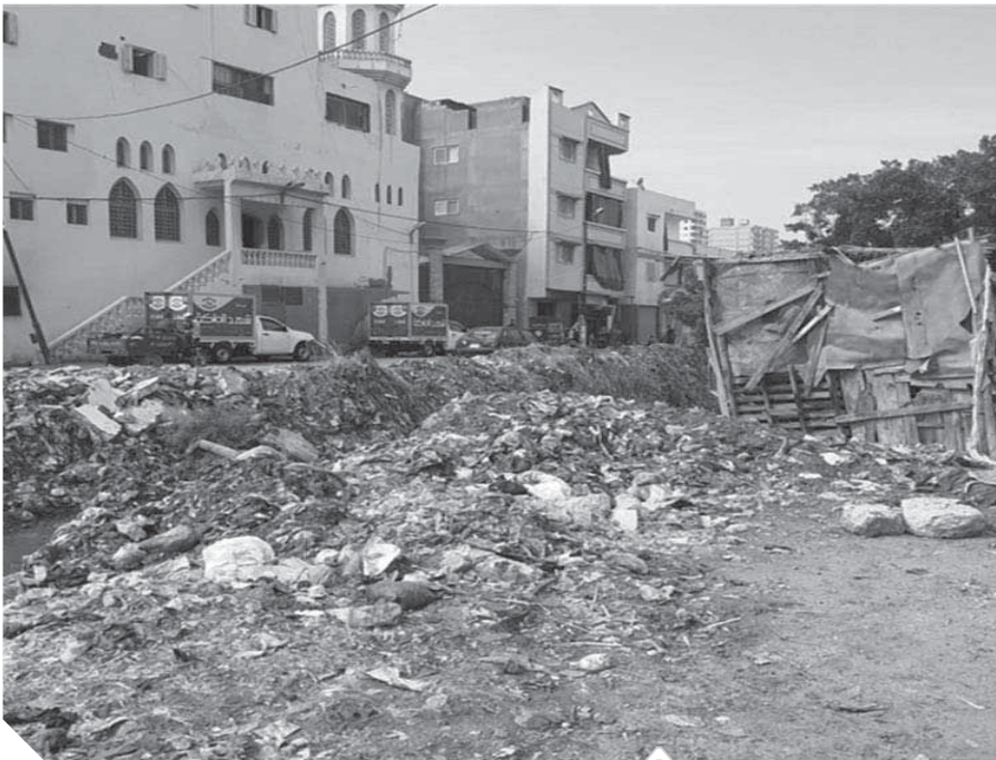
أكوام القمامة تحاصر المنشية البحرية