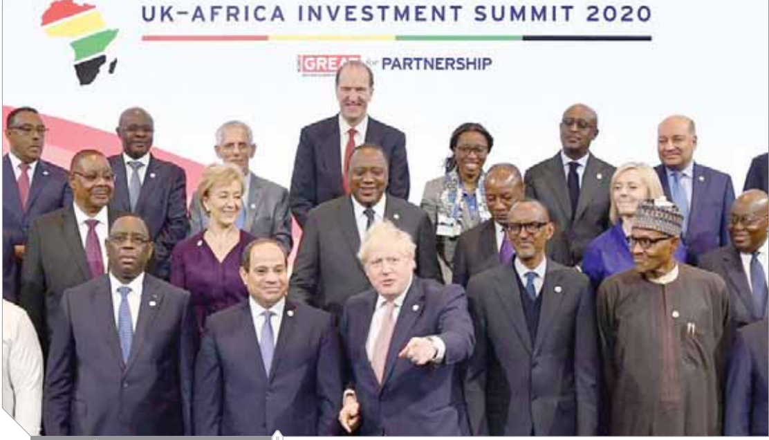
مشاركة الرئيس السيسي في قمة لندن

وأكد محللون أن الاتفاق على الشراكات الخمس مع البلدان الإفريقية يتماشى مع وضع نطاق لتصميم مؤسسة بريطانية جديدة لتطوير المشروعات، من أجل وضع مجموعة من المشروعات القابلة للاستثمار، وضع مزيد من استثمارات القطاع الخاص في مشروعات البنية التحتية المستدامة منخفضة الكربون. من المقرر تحديد التكلفة الإجمالية لهذه المؤسسة استنادا إلى تصميم المنشأة. وستوفر المملكة المتحدة أيضا ما يصل إلى ٣٥٠ مليون جنيه إسترليني في شكل تمويل جديدة للقارة الإفريقية من أجل مساعدة البلدان الأشد فقرا على تطوير وشراء وتمويل مشروعات بنية تحتية مستدامة ذات جودة عالية وبتكلفة معقولة.