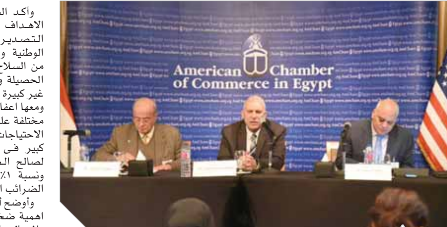
لقاء رئيس مصلحة الجمارك بغرفة التجارة الأمريكية