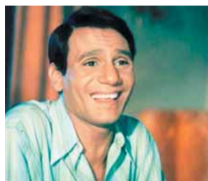
عبد الحليم حافظ

وليلة. أنه عليك ويا الحب. بعمرى كله حبيبتك. وروائعها الطويلة مع بلوغ حمدي. اسمعوني، ولاد الحلال، ومالو. ولو انك يا حبيبي بعيد، دندنة، والتحفة الخالدة أكتب عليك تأليف مرسى جميل عزيز ألحان محمد الموجي. وروائع فايزة أحمد: وقدرت تهجر كلمات حسين السيد ألحان محمد عبدالوهاب. وحبيبي يا متغرب تأليف عبدالرحيم منصور ألحان بلوغ حمدي. وروائعها مع محمد سلطان وتعالى شوف. قول لكل الناس. خلينا ننسى، ياما أنت واحشنى. نقطة الضعف. رسالة من امرأة. أحلى طريق في دنيتي. علمتني الدنيا. أبوه تعينى هواك. المطربة الكبيرة نجاة الصغيرة، أبدعت في أغنيات: عيش معايا. إلى حبيبي. أسالك الرحيل. لو يطول البعد. مهما مرت السنوات تبقى الأغنيات الطويلة رمزا قويا للعصر الذهبي للفن. أغنان خالدة تسكن وجدان الملايين مهما مرت السنوات، مئات الأغاني التيك أو أي اندثرت وبقيت الأغنيات الطويلة لعائلة الغناء أغاني باقية وخالدة مهما مرت السنوات. مر ما يقرب من ٤٠ سنة على نهاية عصر الأغنية الطويلة ولكن مازالت رمز الغناء الحقيقي.