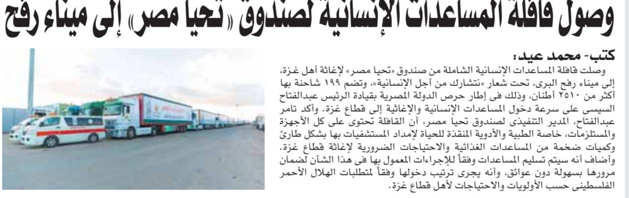
كتب- محمد عيد: وصلت قافلة المساعدات الإنسانية الشاملة من صندوق «تحيا مصر» لإغاثة أهل غزة، إلى ميناء رفح البري، تحت شعار «نتشارك من أجل الإنسانية»، وتضم ١٩٩ شاحنة بها أكثر من ٢٥١٠ أطنان، وذلك في إطار حرص الدولة المصرية بقيادة الرئيس عبدالفتاح السيسي على سرعة دخول المساعدات الإنسانية والإغاثية إلى قطاع غزة. وأكد تامر عبدالفتاح، المدير التنفيذي لصندوق تحيا مصر، أن القافلة تحتوي على كل الأجهزة والمستلزمات، خاصة الطبية والأدوية المنقذة للحياة لإمداد المستشفيات بها بشكل طارئ وكميات ضخمة من المساعدات الغذائية والاحتياجات الضرورية لإغاثة قطاع غزة. وأضاف أنه سيتم تسليم المساعدات وفقاً للإجراءات المعمول بها في هذا الشأن لضمان مرورها بسهولة دون عوائق، وأنه يجري ترتيب دخولها وفقاً لمتطلبات الهلال الأحمر الفلسطيني حسب الأولويات والاحتياجات لأهل قطاع غزة.