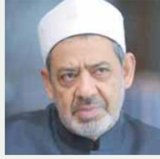
د. أحمد الطيب