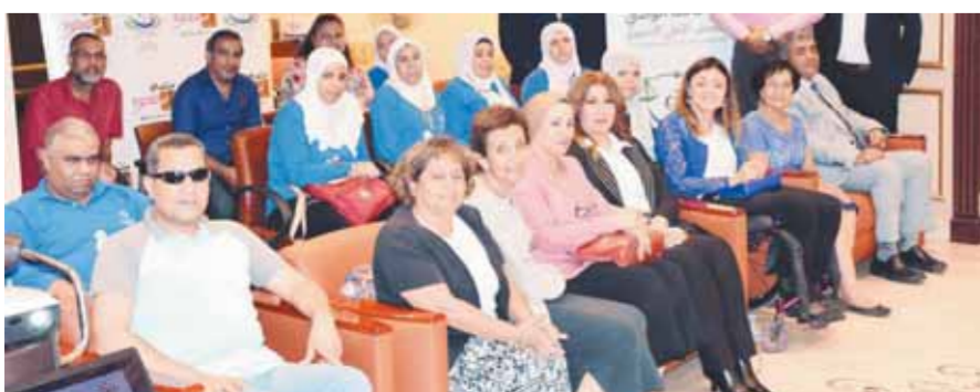
ملعب مطابع الاخبار

قالت الدكتورة إيمان كريم، المشرفة العام على المجلس القومي للأشخاص ذوى الإعاقة، إن الدولة المصرية مؤمنة بالدور الهام لمنظمات المجتمع المدني بشكل عام والمؤسسات والجمعيات الأهلية العاملة مع الأشخاص ذوى الإعاقة وفي مجالاتهم بشكل خاص، والذي نتج عنه إعلان الرئيس عبدالفتاح السيسي ٢٠٢٢ عاماً للمجتمع المدني. وأضافت خلال أولى جلسات الحوار المجتمعي المستعقد بالمجلس صباح أمس أن الهدف من اللقاء هو الاستماع إلى أهم الإشكاليات التي تواجه الجمعيات في عملها مع الأشخاص ذوى الإعاقة وآليات الحل تمهيداً لنظر هذه التوصيات، والحلول والمشكلات التي بحاجة إلى تعديلات في ورقة الحوار المقدمة من المجلس إلى الأكاديمية الوطنية للتدريب في إطار تلبية الدعوة التي أطلقها الرئيس للحوار الوطني على