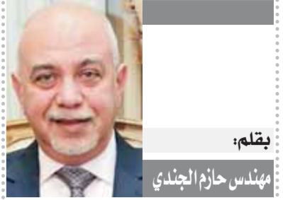
بِقلم: مهندس حازم الجندي