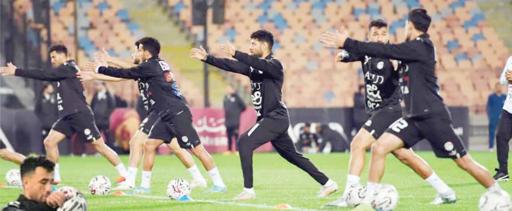
المنتخب استعد بقوة لمواجهة نيوزيلندا