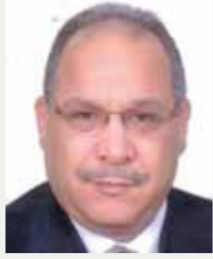
بقلم: حسين حلمي