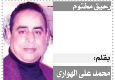
بحقلم: محمد على الهواري

تتمثل بروفة أخيرة قبل مواجهتي بوركينا فاسو وغينيا بيساو، المقررتي في مطلع يونيو المقبل، ضمن الجولتين الأولى والثانية من التصفيات الأفريقية المؤهلة إلى كأس العالم ٢٠٢٦. ويتطلع منتخبا اليوم لتحقيق الفوز على منتخب نيوزيلندا الذي يحتل المركز ١٠٣ في تصنيف الفيفا، من أجل التأهل إلى المباراة النهائية للبطولة والتي سيواجه فيها الفائز من لقاء تونس وكرواتيا، الذي يقام على ملعب ستاد القاهرة غدا السبت، وتشهد مباراة اليوم أول ظهور رسمي للفراغمة على ستاد مصر في العاصمة الإدارية الجديدة والذي يتسع لـ ٩٠ ألف متفرج، حيث لم يخض المنتخب أي مباراة على هذا الملعب، لكنه دخل من قبل في مسكر معلق على نفس الملعب وذلك قبل السفر إلى كوت ديفوار للمشاركة في كأس الأمم الأفريقية الأخيرة. واستعد المنتخب بشكل جيد لهذه المباراة، حيث حرص حسام حسن على تجميع اللاعبين قبل ٩ أيام، واستغل فترة توقف الدوري للحصول على أكبر وقت مع اللاعبين في التدريبات الجماعية التي نفذ خلالها العميد حطة إعداد الفريق وتلقينه حطة اللعب التي يود فرضها خلال المرحلة المقبلة. وكشف المران الأخير للفراغمة، عن تغييرات