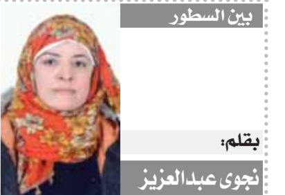
بين السطور بقلم: نجوى عبدالعزيز