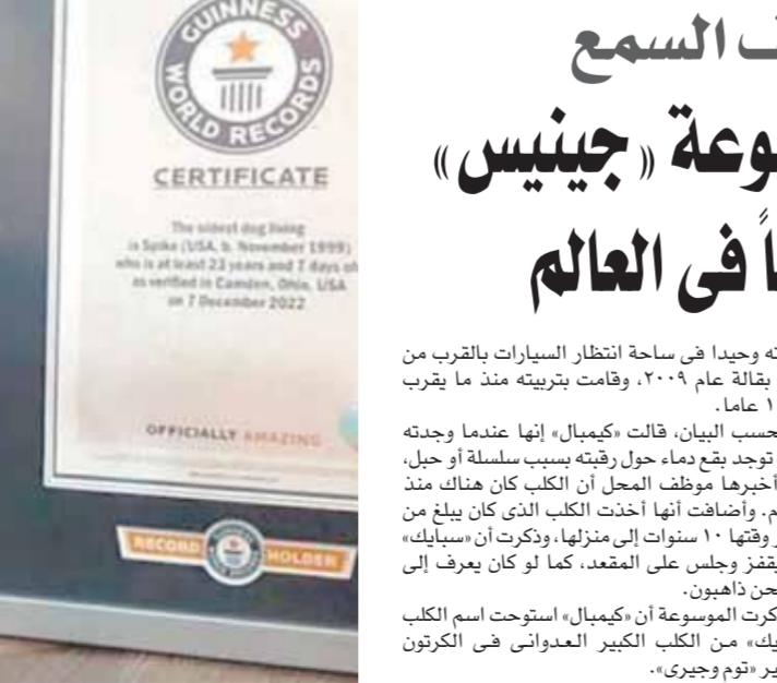
قطع بمطابع «الأخبار»