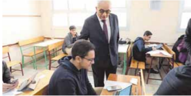
د. رضا حجازي أثناء تفقد لجان الامتحانات

تفقد الدكتور رضا حجازي وزير التربية والتعليم والتعلم الفني، أمس، سير امتحانات الشهادة الإعدادية، والصف الأول الثانوي بمدرسة الدكتور مجدى يعقوب الرسمية المتميزة للغات التابعة لإدارة القاهرة الجديدة التعليمية. وبدأ الوزير جولته بتفقد عدد من لجان امتحان الشهادة الإعدادية بالمدرسة، حيث أدى الطلاب امتحان مادة الدراسات الاجتماعية، والحاسب الآلى والتكنولوجيا. كما تفقد الوزير عدداً من لجان امتحان الصف الأول الثانوي، حيث يؤدي الطلاب امتحان مادتي الفيزياء والتاريخ، حيث يجيب الطلاب عن أسئلة الاختيار من متعدد باستخدام التابلت، بينما يجيبون عن الأسئلة المقالية القصيرة ورقيًا. وأطمأن الوزير على تحقيق الانضباط التام داخل اللجان الامتحانية والمتابعة الجادة من القائمين عليها ومنع أي