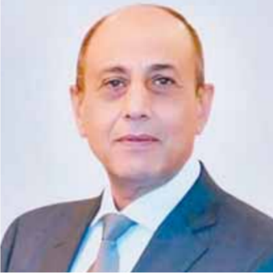
السفير الصيني بالقاهرة: مصر من أوائل دول العالم التي تستقبل السياحة الصينية بعد كورونا

باتى ذلك في ضوء توجيهات القيادة السياسية بتعزيز الجهود واستثمار إمكانات الدولة المصرية بما في ذلك موقع مصر الاستراتيجي الفريد بما يسهم في تنشيط الجوية والسياحة ويجذب المزيد من الاستثمارات إلى الطفرة التنموية والإجازات المثمرة التي تقفها الدولة المصرية في الفترة الأخيرة، وهو ما أظهرته زيارة وزير الآثار والطيران المدني.