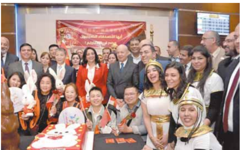
قيادات الطيران المدني والسياحة والآثار والسفير الصيني في استقبال أول فوج سياحي صيني باحتفالية مطار القاهرة