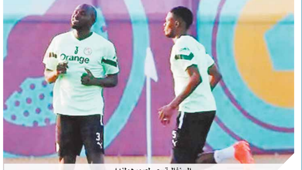
السنغال تسعى لعبور هولندا