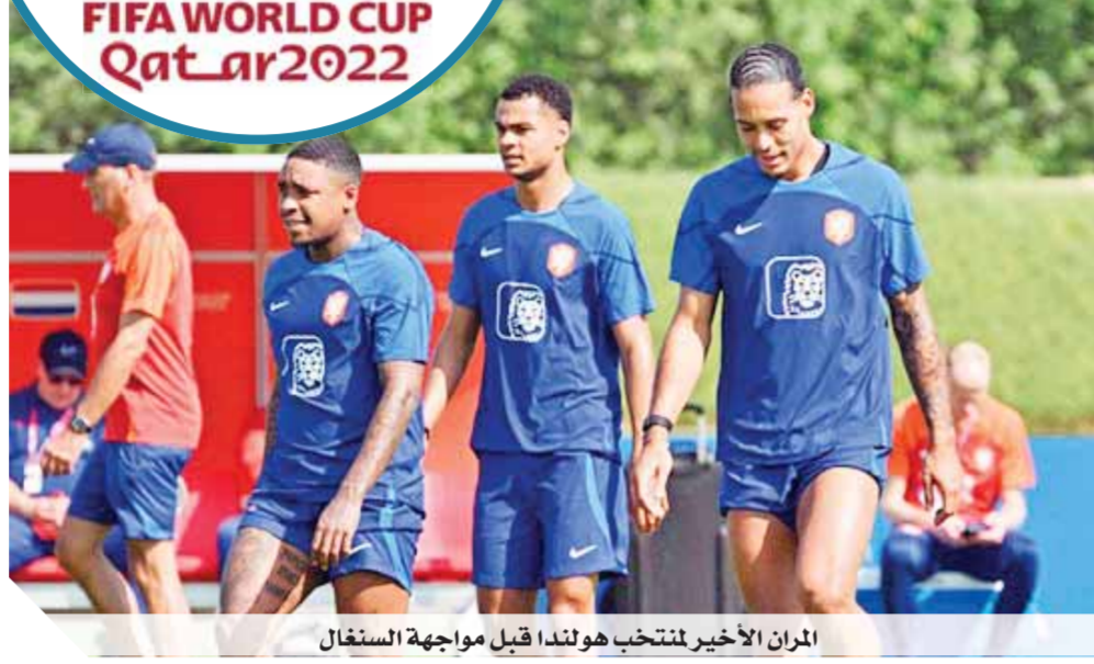
المران الأخير لمنتخب هولندا قبل مواجهة السنغال