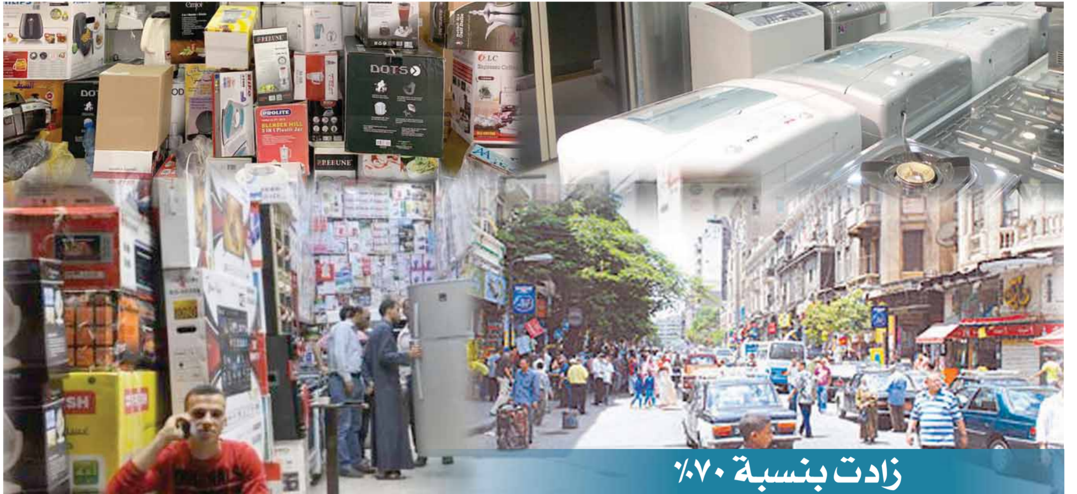
زادت بنسبة 70٪