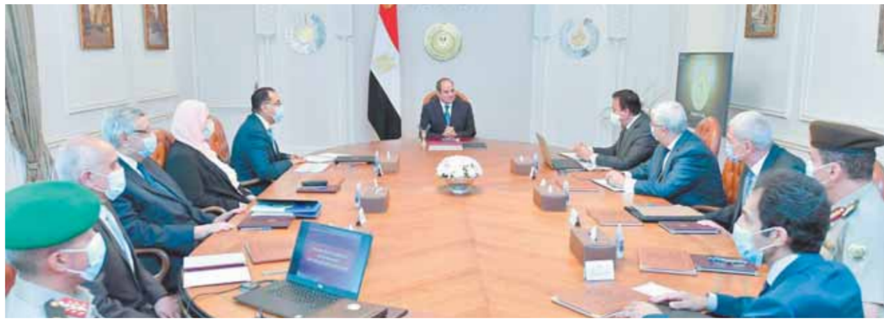
الرئيس خلال اجتماعه أمس بعدد من الوزراء لبحث توطين الأجهزة التعويضية

فضلاً عن الزيارات الميدانية الخارجية، للاطلاع على أحدث الإمكانيات في هذا المجال، سعياً نحو إقامة المجمع، من خلال عدة محاور رئيسية، أهمها إنتاج مكونات عالية الجودة، ونقل التكنولوجيا، وتوطين الصناعة، وتعزيز البحث العلمي والتطوير، أخذاً في الاعتبار أن المجمع من المقرر أن يشمل مجموعة من المصانع المتخصصة في إنتاج مكونات الأطراف الصناعية، وأجهزة الشلل