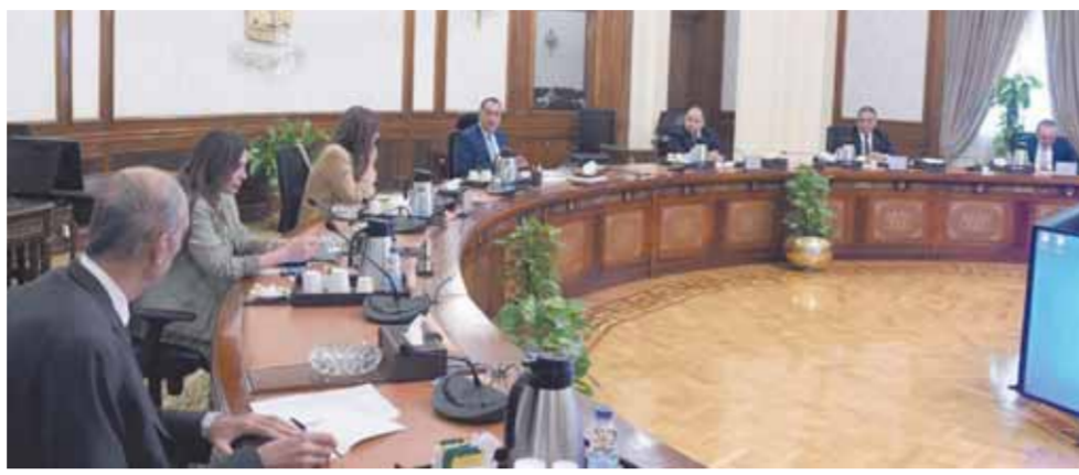
«مدبولي»، خلال الاجتماع الوزاري الذي عقده أمس لبحث الاستعداد للمؤتمر الاقتصادي