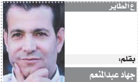
يقلم: جهاد عبد المنعم

ينظم مركز تقييم واعتماد هندسة البرمجيات بهيئة تنمية صناعة تكنولوجيا المعلومات ندوة مجانية بعنوان «بناء برنامج حوكمة أمنية فعالة للتخفيف من مخاطر الحوسبة السحابية» يوم ٢٥ سبتمبر عبر الإنترنت. ستسلط الندوة الضوء على نموذج الحوسبة السحابية الذي يوفر خدمات تكنولوجيا المعلومات، بما في ذلك الخدمات المطلوبة وموارد الحوسبة المرنة. كما ستناقش الندوة طرق الحد من المسائل الأمنية الناشئة عن البيئة الجديدة، والتي تعيق عملية تبني الخدمات السحابية. أسست وزارة الاتصالات وتكنولوجيا المعلومات مركز