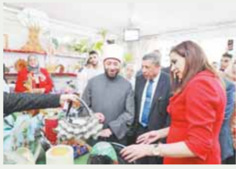
افتتاح معرض الكتاب بدمهور بحضور عدد من المسؤولين وأعضاء مجلس النواب.