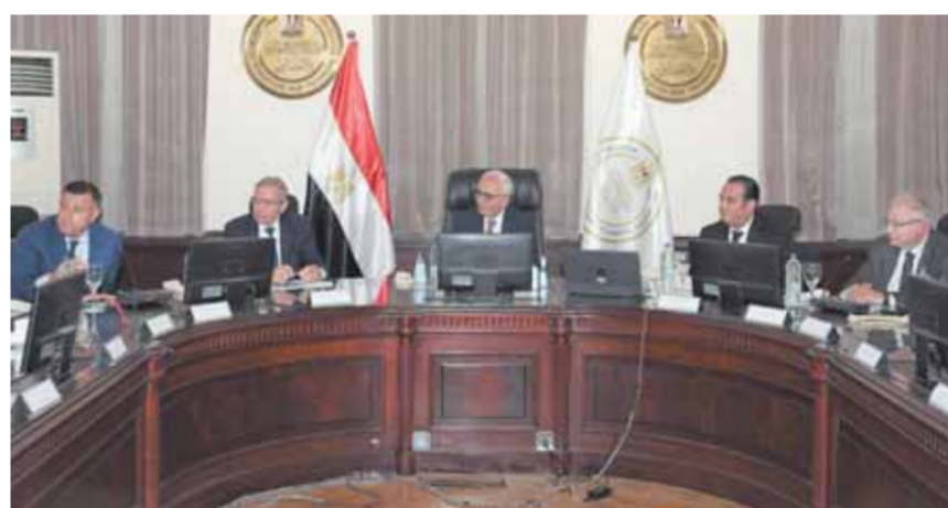
د. رضا حجازي يترأس اجتماع المجلس الأعلى للتعليم قبل الجامعي

كتب- صلاح شرابي: أصدر الدكتور رضا حجازي، وزير التربية والتعليم والتعليم الفني، قراراً وزارياً بتعديل أحكام القرار الوزاري رقم ١٣٦ لسنة ٢٠١٢ بشأن تنظيم امتحانات أبناء المصريين في الخارج، والمعدلة بالمادة الأولى من القرار الوزاري رقم ٤٦٦ لسنة ٢٠١٥. تضمن القرار أن تُعقد امتحانات أبناء المصريين في الخارج إلكترونياً تحت إشراف سفارات مصر بجميع دول العالم، طبقاً لأحكام قانون التعليم، وتعديلاته، وكل اللوائح والقرارات الوزارية المنظمة لهذا الشأن، ولا يجوز عقد هذه الامتحانات في أية دولة ليس لمصر تمثيل دبلوماسي بها. كما شمل القرار عقد الامتحانات على نظام الفصلين الدراسيين اعتباراً من العام الدراسي الجديد ٢٠٢٢-٢٠٢٣، على أن يعفى الطلاب المتقدمون لهذه الامتحانات من درجات أعمال السنة، والأنشطة التربوية المنصوص عليها بالقرارات الوزارية المنظمة لهذا الشأن. وترأس وزير التعليم أمس اجتماع المجلس الأعلى للتعليم قبل الجامعي لمناقشة خطة العام الدراسي الجديد ٢٠٢٢، الذي من المقرر أن يبدأ في