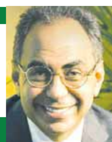
بقلم: د. هاني سري الدين