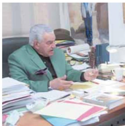
د. زاهي حواس خلال حوار مع الوفد

■ هو أهم مشروع ثقافي في القرن الواحد والعشرين، وهناك اهتمام كبير من الرئيس عبدالفتاح السيسي بنفسه تجاهه وهو اهتمام مشكور جداً، ولولا ذلك الاهتمام لما كان من الممكن أن يستكمل، وتحية كبرى لرجال القوات المسلحة الذين قاموا بإنجاز كبير في تشييد مباني المتحف، كما أن فاروق حسني وزير الثقافة الأسبق كان له الفضل الأول على المتحف الكبير، حيث تم وضع حجر الأساس في فبراير ٢٠٠٢ م