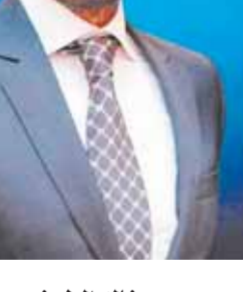
بقلم: د. هاني سري الدين

ربما تكون قمة جدة للأمن والتنمية قد وضعت العلاقات الأمريكية العربية، في مسار جديد لأول مرة منذ عدة عقود، بعد أن ظهرت ملامح التدية في كل فعاليات القمة شكلا ومضمونا، وطهرت فيها ملامح النضج السياسي العربي، وهو أمر يحسب للقادة العرب والدبلوماسية العربية التي أيقنت أن عودة الولايات المتحدة الأمريكية إلى الدول العربية ومنطقة الشرق الأوسط، ليس من أجل عبور العرب، وإنما مصلحة الولايات المتحدة التي فرضتها الظروف الدولية الجديدة وعلى رأسها الحرب الروسية الأوكرانية التي تسببت في ارتفاع حياالي لأسعار الطاقة، ولها تداعيات خطيرة على الاقتصاد الأمريكي والأوروبي، ربما تصل إلى حد انهيار الاقتصاد وانفجار المظاهرات والاحتجاجات في هذه الدول بسبب تأثر سلاسل الإنتاج والإمداد وارتفاع التضخم وزيادة الأسعار بشكل لا يتحمله المواطن، ولم تجد الولايات المتحدة بديلا عن السعودية ودول الخليج لزيادة الإنتاج والسيطرة على أسعار الطاقة.