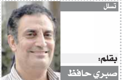
يقلم: صبري حافظ