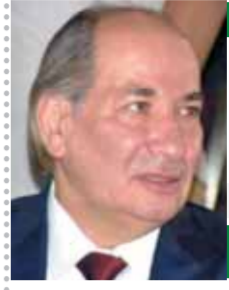
بقلم: د. خالد قنديل

ربما تكون قمة جدة للأمن والتنمية قد وضعت العلاقات الأمريكية العربية، في مسار جديد لأول مرة منذ عدة عقود، بعد أن ظهرت ملامح التدية في كل فعاليات القمة شكلا ومضمونا، وطهرت فيها ملامح النضج السياسي العربي، وهو أمر يحسب للقادة العرب والدبلوماسية العربية التي أيقنت أن عودة الولايات المتحدة الأمريكية إلى الدول العربية ومنطقة الشرق الأوسط، ليس من أجل عبور العرب، وإنما مصلحة الولايات المتحدة التي فرضتها الظروف الدولية الجديدة وعلى رأسها الحرب الروسية الأوكرانية التي تسببت في ارتفاع حياالي لأسعار الطاقة، ولها تداعيات خطيرة على الاقتصاد الأمريكي والأوروبي، ربما تصل إلى حد انهيار الاقتصاد وانفجار المظاهرات والاحتجاجات في هذه الدول بسبب تأثر سلاسل الإنتاج والإمداد وارتفاع التضخم وزيادة الأسعار بشكل لا يتحمله المواطن، ولم تجد الولايات المتحدة بديلا عن السعودية ودول الخليج لزيادة الإنتاج والسيطرة على أسعار الطاقة.