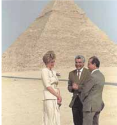
مع الأميرة الراحلة دينا