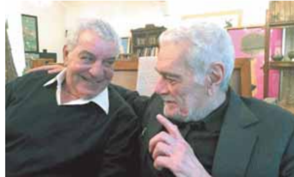
مع صديق عمره الفنان الراحل عمر الشريف

لا يوجد «عبراني» واحد ضمن أسماء عمال البناء