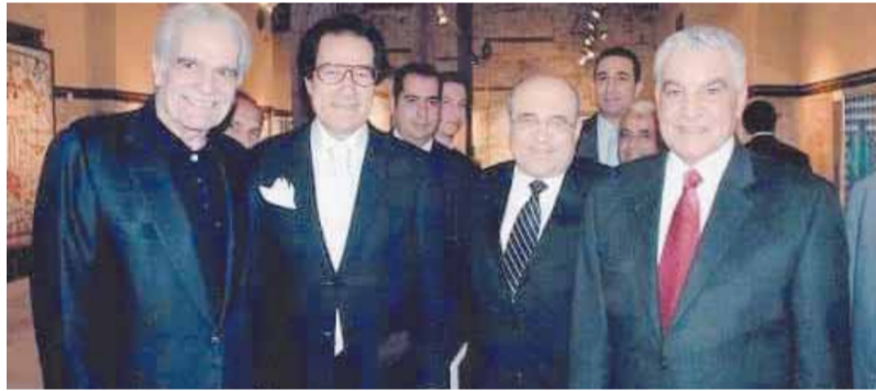
د. حواس برفقة مصطفى الفقي و فاروق حسني وعمر الشريف