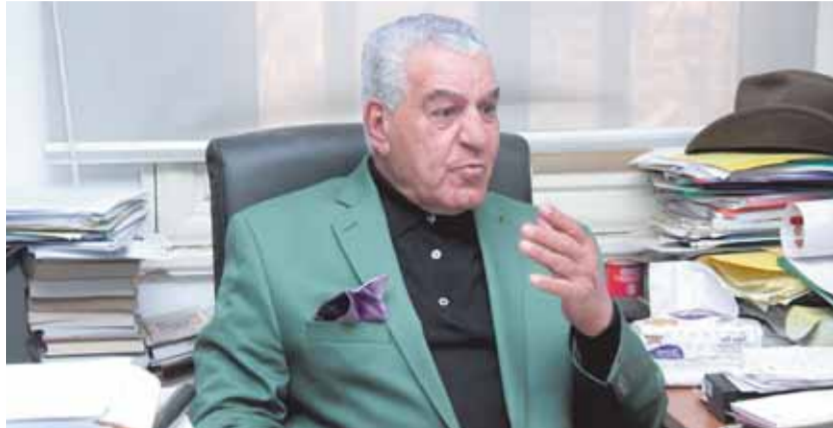
د. زاهي حواس