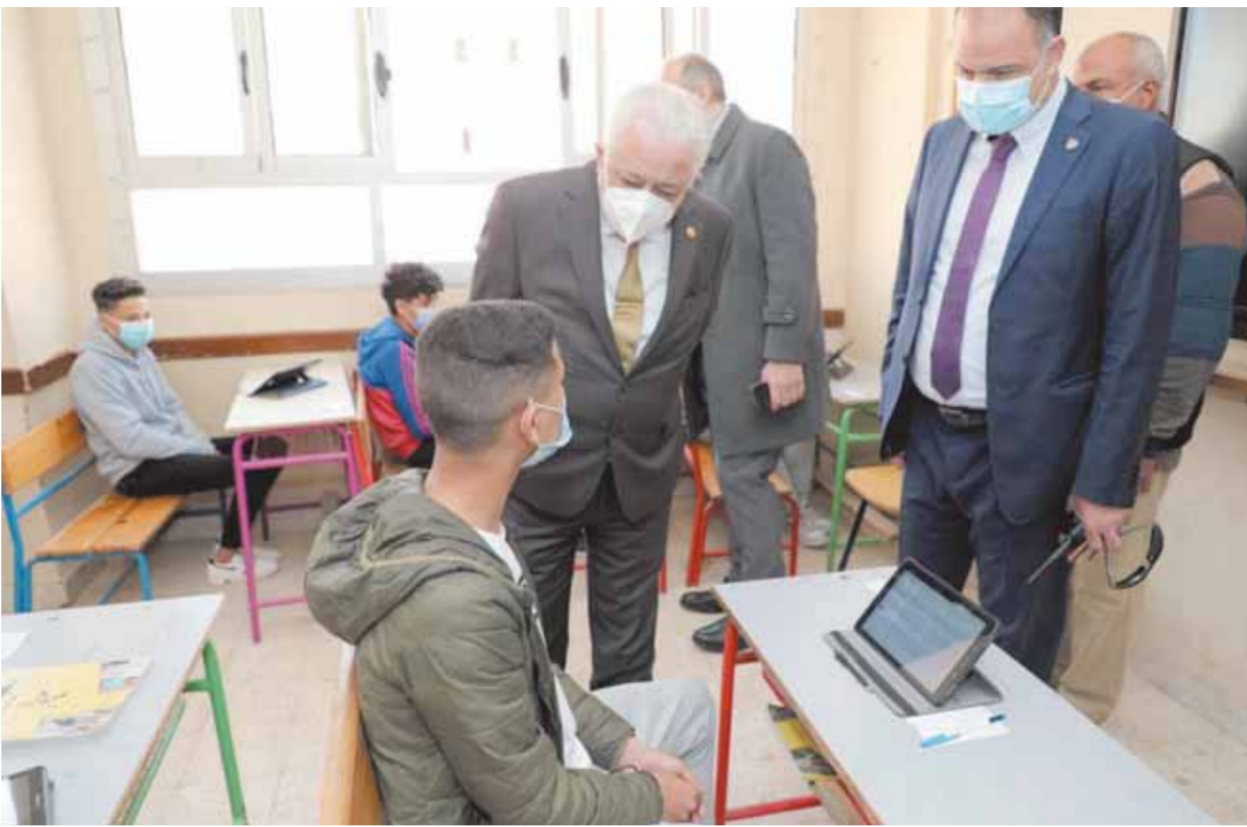
وزير التربية والتعليم خلال متابعة الامتحانات

وشددت وزارة التربية والتعليم على ضرورة التأكد من أن الطالب قام بتسجيل بياناته على ورقة الإجابة (البابل شيت) وكراسة الأسئلة