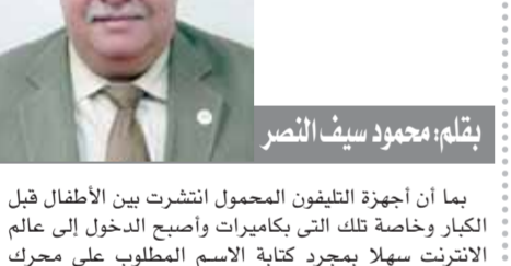
بقلم: محمود سيف النصر

بما أن أجهزة التليفون المحمول انتشرت بين الأطفال قبل الكبار وخاصة تلك التي يكاميرات وأصبح الدخول إلى عالم الانترنت سهلا بمجرد كتابة الاسم المطلوب على محرك البحث، فباتن لك ما تريد مثل الفانوس السحري فإن تعامل الأطفال مع تلك الأجهزة أصبح يتطلب الكثير من المتابعة والحذر تجنباً لبعض التأثيرات السلبية والخطيرة التي يمكن أن تنجم عن تقنية تلك الأجهزة دون أن ندري، وأنا هنا أتحدث عن أخطأ الأطفال والجلوس منفردين داخل المنزل والبحث عن بعض الافلام القذرة ليست فقط ذات المحتوى من العنف بل وصل الحال إلى تلك المتعلقة بالمحتوى الجنسي. أتوجه للأسرة المصرية بأعلى صوتي ولكل الآباء والأمهات وفي المدارس بمراقبة أبنائهم وارجو من الدولة التدخل بحجب هذه المواقع التي تعلم الأطفال الخلاعة والمجون والانحراف. بإسناد أقسم بالله التي رأيت أطفالا في العاشرة والرابعة عشرة يتبادلون هذه الافلام بين بعضهم عبر الماسنجر والواتس ويتبادلون الصور والأفلام الجنسية وهذا انذار إلى اهنا والأسرة ودعواتنا للدولة بسرعة حجب هذه المواقع. وفي هذا الصدد فإن مراقبة الأسرة ضروري وهام جدا ويجب أن لاترك الأولاد منفردين في غرف مغلقة دون أن ندري ماذا يفعلون ومراقبة تليفوناتهم يوميا للحفاظ على الأبناء من شحور هذا الظاهرة الخطيرة خوفا من نشي التعود وعدم الخوف ويصبح الأمر عابدا ويصبح الأمر كأنهم يشاهدون افلاما عادية ويكون الانحراف بين الجيل القادم فتشيع المصائب بين جيل كامل.