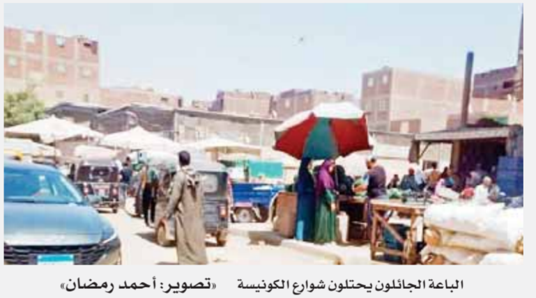
الباعة الجائلون يحتلون شوارع الكونيصة

تعيش منطقة الكونيصة التابعة لحي الطالبية بمحافظة الجيزة، حالة من الفوضى والعشوائية في الشوارع، نتيجة غياب الرقابة، وانتشار مركبات «التوك توك» وغرق الشوارع بمياه الصرف الصحي، وسيطرة الباعة الجائلين على الأرصفة والطرق، ما أدى إلى صعوبة الحركة والعيش في المنطقة. وناشد العشرات من الأهالي المنطقة مسئولى حى العمرانية والطالبية، لرفع الإشغالات من الشوارع، خاصة في شارع عثمان أحمد عثمان، التي تشهد انتشاراً كبيراً للباعة الجائلين دون مراعاة لسكان المنطقة، مشيرين إلى أهمية السيطرة على مركبات التوك توك، التي تؤدي إلى التكدس والإزدحام المستمر بالمنطقة.