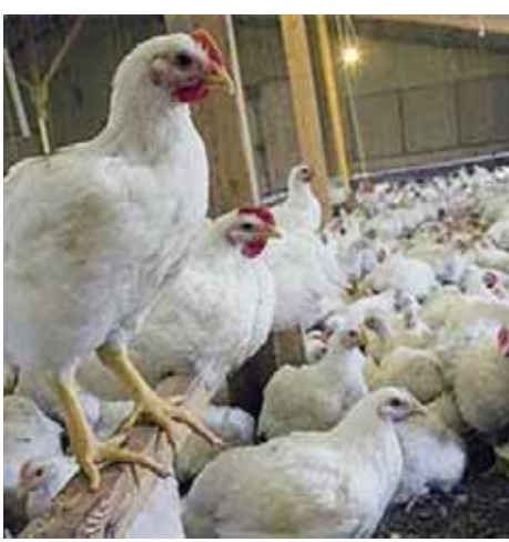
تقرير: طارق يوسف

استطلعت «الوقد» آراء بعض المربين الذين أكدوا أن فصل الشتاء في التربية من أصعب الفصول وذلك بسبب انتشار الأمراض الموسمية مثل انفلونزا الطيور ومرض (IB) والتوكسال والتي تحتاج إلى مضادات حيوية ارتفعت أسعارها إلى مستويات غير مسبقة مما يؤدي إلى ارتفاع التكلفة. من جهة أخرى يستغل أصحاب مزارع الأمهات الموقف ويرفضون خفض أسعار الكتاكتيت عمر يوم والتي توقفت على سعر من ٢٠ - ٢٥ جنيهًا للكتكتوت عمر يوم، وهذا يساعد في ارتفاع التكلفة.