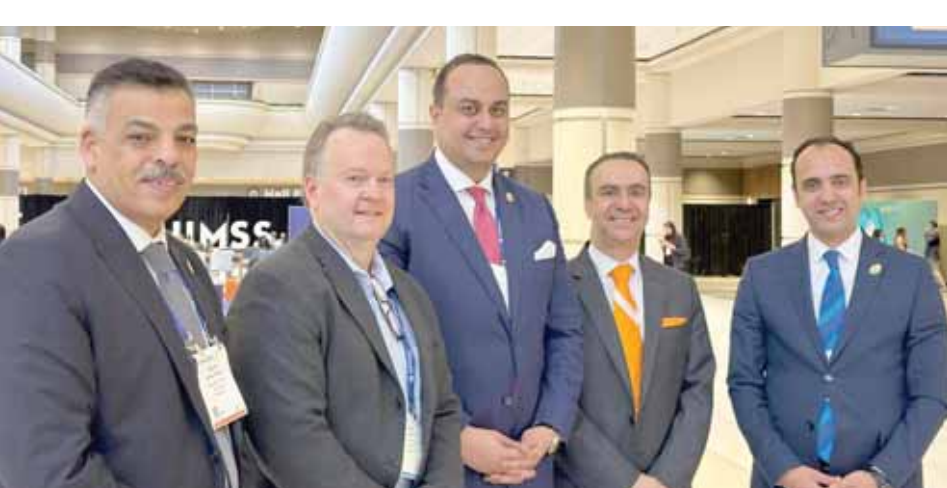
تم استعراض التجربة المصرية الرائدة في الإصلاح الصحي والتغطية الصحية الشاملة، ومجتمعات وأنجازات هيئة الرعاية الصحية المصرية في تطوير الخدمات الطبية والمعالجة، والميكنة والتحول الرقمي للخدمات، واستخدام التكنولوجيا والتشخيص الحديثة والمتكاملة التي تعزز الراحة والكفاءة وتيسير وصول الرعاية الصحية إلى المواطنين، وتحقيق رؤية مصر في أن تكون واحدة من الدول الرائدة في مجال الرعاية الصحية على المستوى العالمي تنفيذاً لتوجيهات القيادة السياسية.