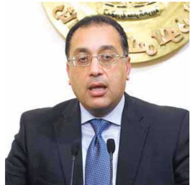
د. مصطفى مدبولي

كشفت أحمد عيسى وزير السياحة والآثار، عن أن مصر استقبلت ١١.٧ مليون سائح في عام ٢٠٢٢، مشيراً إلى أن هناك تقديرات بأن يشهد العام الجاري نمواً في السياحة الوافدة بنسبة ٢٨٪، وهو ما يسهم في الوصول بعدد السائحين إلى ١٥ مليون سائح في نهاية ٢٠٢٣. وأضاف الوزير، خلال استعراض تقرير أعمال الوزارة، في اجتماعه مع الدكتور مصطفى مدبولي، رئيس مجلس الوزراء، بحضور اللواء عاطف مفتاح، المشرف على المتحف المصري الكبير، وأحمد الوصيف، رئيس اتحاد الغرف السياحية، وعضو المجلس، مساعد وزير السياحة، أن حركة السياحة الوافدة في شهرى يناير وفبراير الماضيين شهدت نمواً بنسبة ٢٨٪، مقارنة بالفترة نفسها من العام الماضي، مشيراً إلى مجموعة من الإجراءات المهمة التي اتخذتها الدولة، مستعرضاً في هذا الإطار تسهيلات الحصول على التأشيرات السياحية. كما تطرق الوزير إلى استراتيجية الوزارة