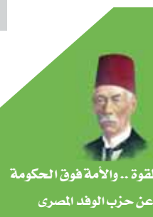
الحق فوق القوة.. والأمة فوق الحكومة تصدر عن حزب الوفد المصري