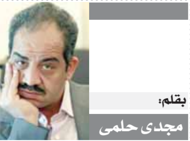
بقلم: مجدى حلمي