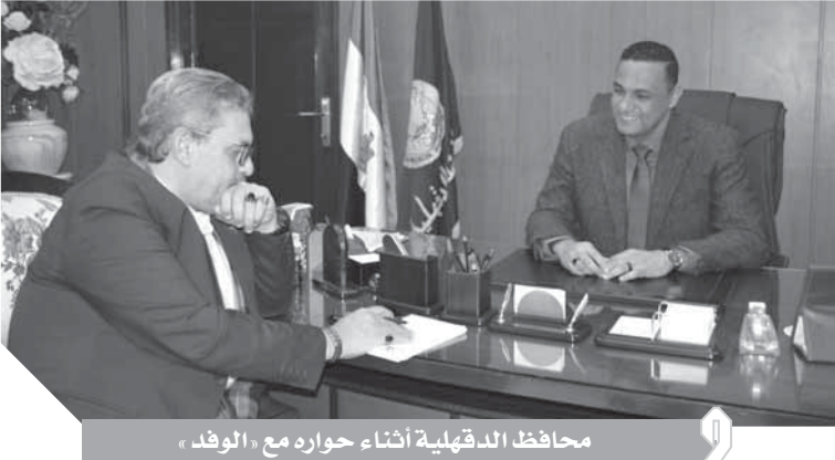
محافظ الدقهلية أثناء حوار مع «الوفد»

وطالب اهالى محافظة الإسماعيلية الدكتور مصطفى مديولى رئيس الوزراء مصطفى مديولى بزيارة عاجلة للوقوف على حد المشكلة قبل انهيار المصانع والمباني السكنية وانتشار الأوبئة والأمراض وحاسبة المخصرين من الشركة القابضة لياه الشرب والصرف الصحي بالإسماعيلية.