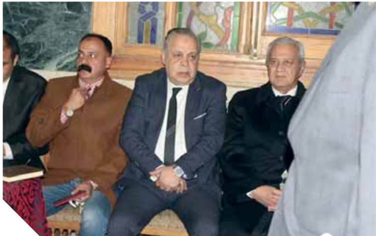
اللواء سفير نور والدكتور أشرف زكي خلال العزاء فى نجمة السينما المصرية