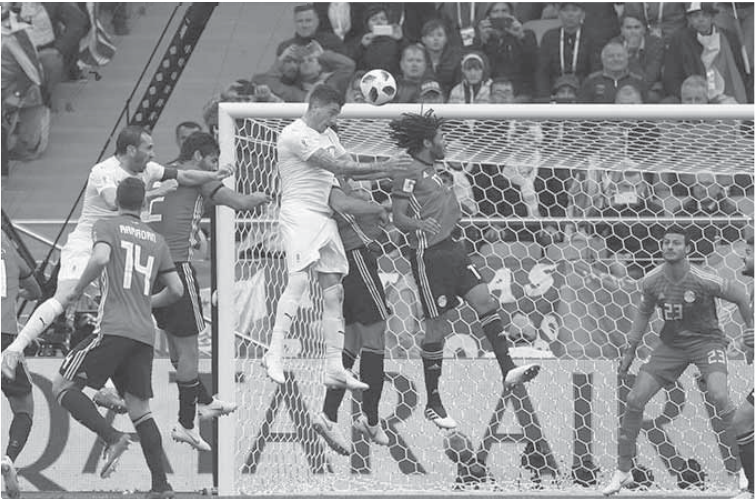
المنتخب شارك فى مونديال روسيا ويحلم بالاستمرار فى ٢٠٢٢