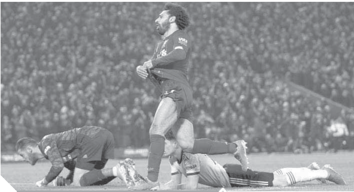
صلاح سجل هدفا تاريخيا في الموقت بدل الضائع