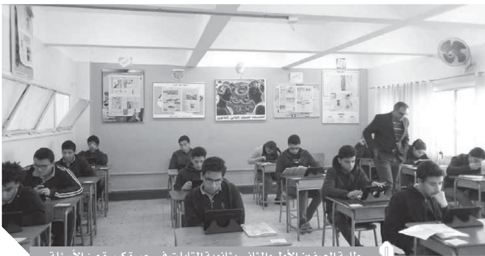
طلبة الصفين الأول والثانى بثانوية التابلت فى حيرة كبيرة من الأسئلة