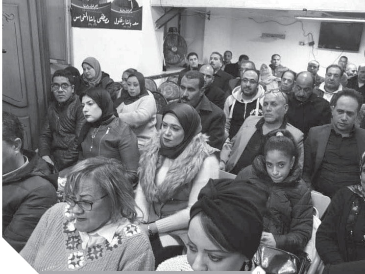
جانب من الحضور يتابعون المتحدثين