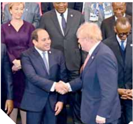
«السيسى» يصافح رئيس وزراء بريطانيا

باعتباره أحد أهم محفزات النمو للنشاط الاقتصادى، وبالتالي فإن تدشين شراكات بين القطاع الخاص الأجنبى والإفريقى وتذليل أية عقبات فى طريقها يعد جزءاً لا يتجزأ من استراتيجياتنا الوطنية. رابعاً: تمكين الشباب والمرأة بدول القارة، وتوفير فرص العمل، باعتبار ذلك ركيزة أساسية لتحقيق التنمية والاستقرار الاجتماعى، وكسابهم المهارات والخبرات التى تمكنهم من التعامل مع أدوات العصر وتيسير فنادهم إلى التكنولوجيا المتقدمة لمواكبة التطورات العالمية ذات الصلة، وتعزيزاً لحقوق الإنسان بمفهومها الشامل.