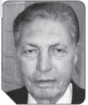
لواء سعد الجمال