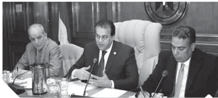
د. خالد عبدالغفار يترأس الاجتماع

وأضاف الدكتور الخشت أن امتحانات الفصل الدراسي الأول تواصلت في الكليات بهدوء منذ بدايتها ولم يتم رصد أية معوقات أو مشكلات بشأنها، عدا بعض حالات الغش الفردية التي تراجعت بصورة ملحوظة عن الأعوام السابقة، نتيجة الاجراءات الصارمة وتوفير كاميرات مراقبة في قاعات الامتحانات.