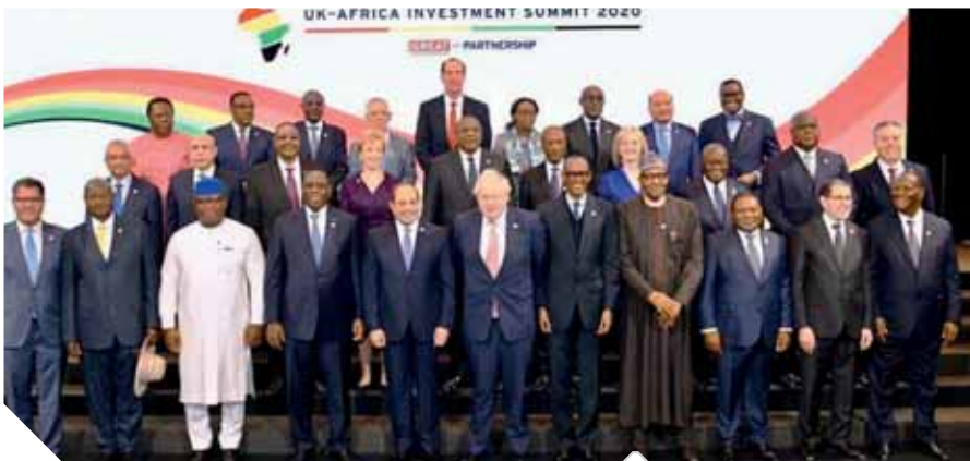
زعماء إفريقيا خلال افتتاح القمة

وأضاف «السيسى» أنه رغم ضخامة كافة تلك التحديات وتشابك آثارها على قارتنا الإفريقية، بما يتعارض مع نهية المناخ الملائم لتحقيق التنمية بكافة أبعادها، وعلى رأسها اجتذاب الاستثمار الأجنبى المباشر، وهو موضوع قمتنا، إلا أننا نستطيع القول، بعد مرور عام حافل من الجهد على طريق تحقيق أولويات القارة المتصلة فى إرساء الاندماج الإقليمى والتكامل الاقتصادى الإفرىقى، أن هناك فرصاً واعدة ومتنوعة أمام شركاء القارة على مستوى العالم تجعل من إفريقيا أحد أهم المقاصد أمام مؤسسات الأعمال