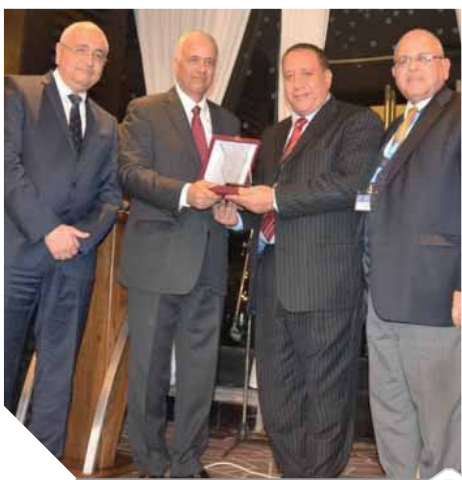
الدكتور عصام الكردى يكرم الزميل رزق الطرابيلى

كرم الدكتور عصام الكردى، رئيس جامعة الإسكندرية، الكاتب الصحفي رزق الطرابيلى نقيب الصحفيين بالإسكندرية ومحافظات غرب ووسط الدلتا ومدير تحرير «الوفد» فى حضور أساتذة ونواب الجامعة تقديراً للجهود المشتركة بين نقابة الصحفيين والجامعة، والدور الذى تلعبه الصحافة فى الإعلام الجامعى. حضر حفل التكريم الدكتور علاء رمضان والدكتور هشام جابر نائباً ورئيس الجامعة والدكتور سعيد علام عميد كلية الهندسة.