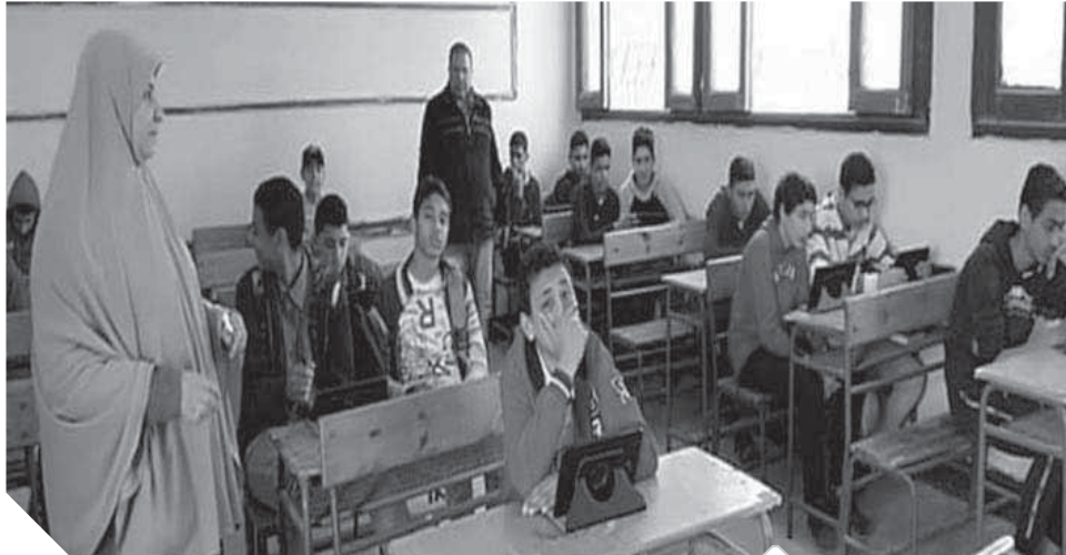
تفاوت رهيب فى مستوى الأسئلة بين الإدارات التعليمية