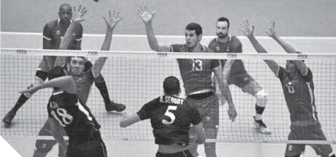
اتحاد الطائرة سقط بفعل فاعل