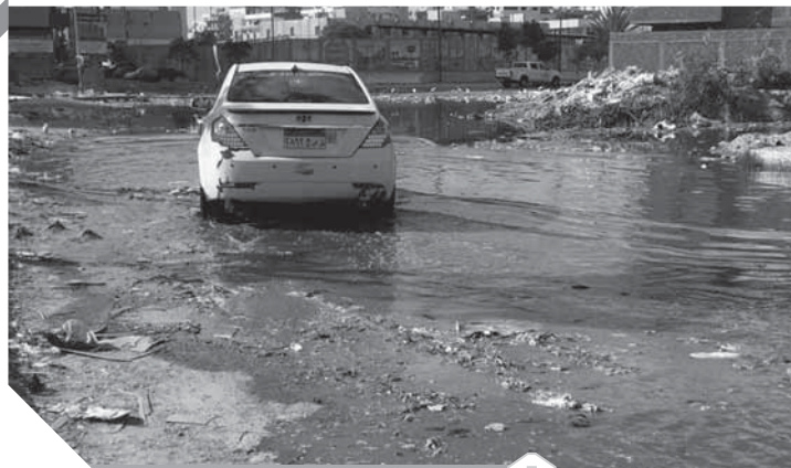
مياه الصرف تحاصر الديوان

مشيرا إلى أنه تبقى شيء آخر لاكمال خطة تحسين البيئة المرحوة، ألا وهي جمع القمامة من المنبع المنازل وهي أصعب شيء في نجاح المنظومة، وذلك لأن سبل كدونة بالاتفاق مع المجتمع المدني أننا ننشئ مصمعا أو مقبلا أو نشترى سيارات وصناديق للقمامة، ولكن الأصعب هو أن نقتن أصحاب الممارات والنازل أن نجعم منهم مقابلا ماليا ونجعم من كل شقة زبائهم وعند ٧ ملايين، وقد هذا كبير جدا للوصول إليهم وإقناعهم بهذه المنظومة، وقد نرى رفض البعض، ولذا بدأت من الجهة العسكرية أن تبدأ بالنسنا المستوليين أن رى المواطنين شوارعهم نظيفة، مكتومة وعمال نظافة منتشرين في كافة الشوارع ومعهم عربات صغيرة لجمع القمامة، وصناديق قمامة منتشرة أمام المحلات والتي ستجبر بضرورة وضع