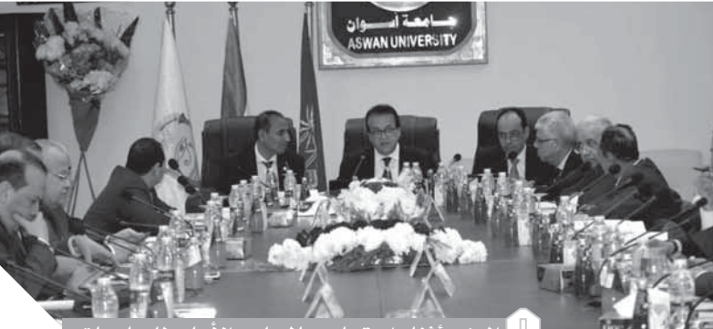
الوزير اثناء اجتماعه بالمجلس الأعلى للجامعات

الدراسى ٢٠١٩/٢٠٢٠، كما أوضح التقرير الانتهاء من تطوير نظم المعلومات الجغرافية (GIS) الخاص بوزارة التعليم العالى بالتعاون مع المديرين التقنيين للمعلومات بالجامعات. ووجه الوزير باسم المجلس الشكر لفريق العمل بمركز الخدمات الإلكترونية بالمجلس الأعلى للجامعات على نجاحه فى إعداد نظم المعلومات الجغرافى للجامعات المصرية (GIS) خلال مدة وجيزة، وسوف يساعد هذا النظام صانع القرار فى التعليم العالى فى معرفة توزيع الكليات والتخصصات العلمية بكافة الاقاليم الجغرافية بأحاء الجمهورية، إضافة إلى توافر كافة المعلومات المطلوبة التى تخص كل جامعة من الجامعات الحكومية والخاصة والأهلية. أكد المجلس الأعلى للجامعات أهمية تطوير إدارات لرعاية الطلاب الوافدين، وأن تقدم كل أوجه الرعاية للطلاب الوافدين، وأن تقدم هذه الإدارات نفس الخدمة بنفس المستوى المقدم، وذلك من خلال تطوير الإدارات المعنية بشئون أعضاء هيئة التدريس بالجامعات. وأكد المجلس الأعلى للجامعات فى اجتماعه اليوم على قراره السابق فى جلسته رقم٦٤ بتاريخ ٢٢ يونيو ٢٠١٦، والذي يقر أن الشهادات التى يمنحها نظام التعليم الإلكتروني المدمج من خلال برامجه المختلفة المقدمة ببعض الجامعات هى شهادات مهنية.