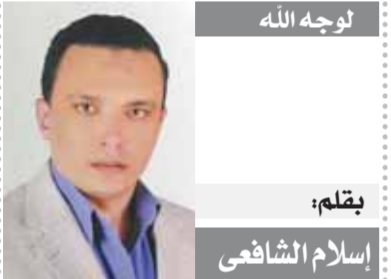
بقلم: إسلام الشافعي