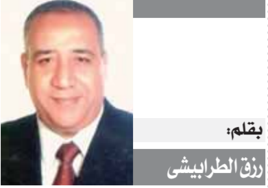
بقلم: رنا الطرايشي