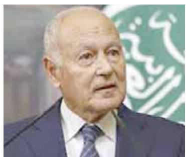
أحمد أبو الفيط

أعرب أحمد أبو الفيط الأمين العام لجامعة الدول العربية، عن أسفه بسبب الفيتو الأمريكي في مجلس الأمن الدولي لمنع صدور قرار بمنح دولة فلسطين العضوية الكاملة في الأمم المتحدة. وقال الأمين العام لجامعة الدول في دورته له عبر حسابه الرسمي على منصة إكس: «إنه أمر مؤسف للغاية أن يستخدم الفيتو لإعاقة إرادة دولية واضحة وموافقة على انضمام فلسطين عضواً كاملاً في الأمم المتحدة». وتابع «أبو الفيط»: ومع ذلك نعلم أنها ليست سوى خطوة في طريق كفاح سياسي طويل سيتهيئ حتماً بانتصار الإرادة الفلسطينية المدعومة عربياً ودولياً. وقال السفير حسام زكي الأمين العام المساعد لجامعة الدول العربية، إن قوة الاحتلال تعبت بإرادة مجلس الأمن وترفضها وتواصل حربها الغاشمة لتدمير البشر والحجر في غزة، لافتاً أنه منذ صدور قرار مجلس الأمن رقم ٢٧٢٨ والخاص بوقف فوري لإطلاق النار في غزة، وإدخال المساعدات الإنسانية من جميع الممرات البرية، مازال أبناء غزة الصامدون ينتظرون تنفيذ هذا القرار، مؤكداً أن الجريمة المتواصلة في غزة تمثل عدواناً على الجور الأخلاقي والقانوني لنظام الدولي، والسكوت على هذه الجريمة يضع شرعية هذا النظام ومصداقية هذا المجلس على المحك، وأضاف «زكي» خلال كلمته أمام مجلس الأمن، أن استمرار هذه الحرب يُفرض حتماً على توسيع رقعة الصراع، ودخول أطراف أخرى إلى ساحة، بصورة يصعب