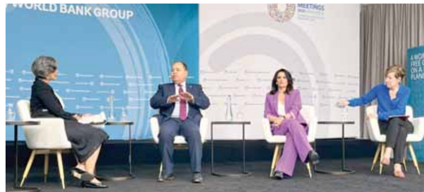
يستهدف حماية كل أفراد الأسرة المصرية من أي مخاطر صحية أو مالية مرتبطة على المرض. وأضاف الوزير أننا نعمل على تكوين احتياطات

وقال الوزير، في جلسة نقاشية حول «التغطية الصحية للجميع» على هامش اجتماعات الربيع لصندوق النقد والبنك الدوليين بواشنطن، إن مصر تتحرك بقوة لبناء نظام قوى للتأمين الصحي الشامل؛ رغم كل التحديات الاقتصادية والضعف المالي، لافتاً إلى أن نظام التأمين الصحي الشامل