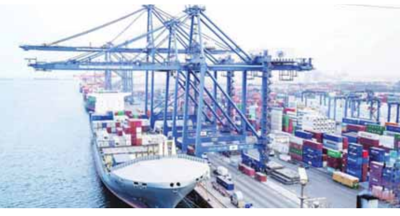
الموانئ العمانية تحقق طفرات تنموية عام ٢٠٢٣

أبرزت الموانئ العمانية خلال عام ٢٠٢٣ فعاليتها وكفاءتها بصفتها أحد أهم الموانئ في المنطقة، حيث شهدت خلال عام ٢٠٢٣ مئمة في «ميناء السلطان قابوس، وميناء صلالة، وميناء صحار، وميناء خصب، وميناء شناص، وميناء السويق، وميناء برك» ٩٢.٢ مليون طن، مقارنة بحوالي ٩١.٨ مليون طن تمت مناولتها خلال عام ٢٠٢٢ بحسبة ذلك ارتفاعاً في حجم مناولة البضائع العامة والسائفة والسائفة بنسبة ١٠.٥ ٪، عام ٢٠٢٣.