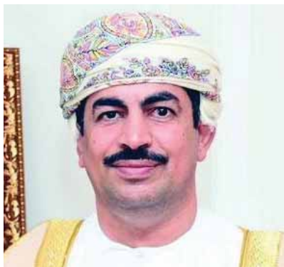
الدكتور عبدالله بن ناصر الحراسي وزير الإعلام العماني

يستعرض وزير الإعلام بسلطنة عمان الدكتور عبدالله بن ناصر الحراسي بعد غد الثلاثاء، أمام مجلس الشورى، ملامح الاستراتيجية الإعلامية خلال جلسة علنية، وذلك ضمن أعمال الجلسة الاعتيادية الثامنة لدور الانعقاد السنوي الأول من الفترة العاشرة (٢٠٢٣-٢٠٢٧) في سبيل سبيل المجلس جلسته الاعتيادية السابعة فعلاً الأحد ٢١ أبريل الجاري، والتي ستخصص لمناقشة «مشروع قانون الإعلام، المحال من الحكومة».