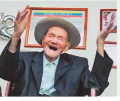
أصبح المزارع القنزويلي خوان فيسينته بيريز الذي يبلغ من العمر ١١٢ عاماً رسمياً أكبر رجل على قيد الحياة، بعدما توفي حامل لقب السابق، وأعلنت موسوعة «جيتيس» للأرقام القياسية في بيان نشرته على موقعها الإلكتروني، أن «بيريز» هو أكبر رجل على قيد الحياة.

كتب - صلاح صيام: أصبح المزارع القنزويلي خوان فيسينته بيريز الذي يبلغ من العمر ١١٢ عاماً رسمياً أكبر رجل على قيد الحياة، بعدما توفي حامل لقب السابق، وأعلنت موسوعة «جيتيس» للأرقام القياسية في بيان نشرته على موقعها الإلكتروني، أن «بيريز» هو أكبر رجل على قيد الحياة. وأوضحت الموسوعة أن «بيريز» يتمتع بصحة ودأكرة ممتازتين، إذ يتذكر طفولته وزواجه وأسماء أشقائه وأطفاله وأحفاده. وأضافت أن بيريز «يحب» أن يكون محاطاً بأفراد عائلته وأصدقائه الذين يخبرونه قصصاً ويجرون محادثات ممتعة معه، كما أفادت الوكالة الفرنسية.