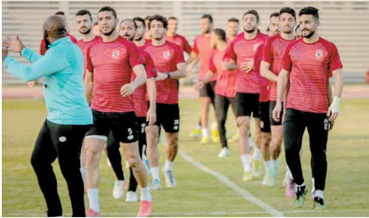
الأهلى يتمسك بحقوقه فى نهائى دورى الأبطال

بحقوقه كاملة فى اللقاء النهائى لتتحول الأزمة إلى محورين مهمين الأول هو ملف تعيين الحكام والثانى هو توزيع تذاكر اللقاء بين الأهلى والوداد. وطلب الأهلى بشكل رسمى من الكاف تعيين طاقم أوروبى لتقنية الفيديو أسوة بما حدث فى تصفيات كأس العالم عن قارة إفريقيا بخلاف الإبتعاد عن تعيين الحكام أصحاب السوابق السوداء والمشكلات السابقة وعلى رأسهم بكارى جاساما الذى يتردد أنه سيكون حكم النهائى. ويسعى الملف الآخر متعلقاً بجزئية التذاكر بين الأهلى والوداد، فالإدارة الحمراء قررت المطالبة بالحصول على نصف سعة استاد محمد الخامس وهو ما يقرب من ٢٢ ألفاً و ٥٠٠ تذكرة وتخصيصها لجمهور الأهلى مع التمتع بتوفير الحماية للفريق الأحمر ومشجعيه.