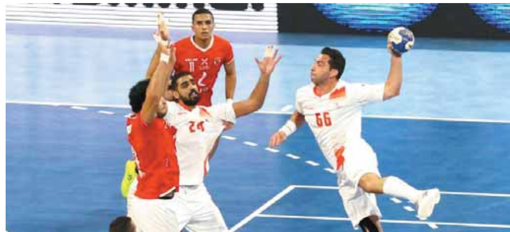
الأهلى يواجه الزمالك فى نهائى كأس الكؤوس الإفريقية ليد