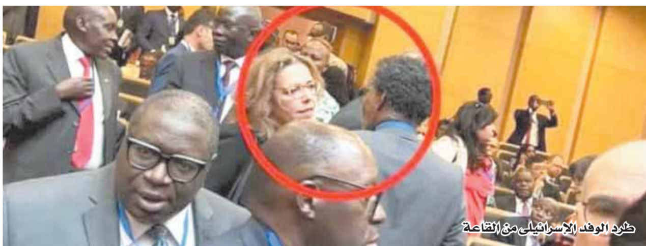
ظهور الوفد الإسرائيلي مع القاعة

وقال رئيس مفوضية الاتحاد الإفريقي موسى هكي إن المطلوب هو تفعيل منطقة التجارة الحرة الإفريقية سريعاً لمواجهة التحديات المختلفة، مضيفاً أن شركاء القارة السمراء «يفرضون شروطاً صارمة لتحويل مشاريعنا المختلفة». كما دعا هكي إلى «وجوب إصلاح الحكومة العالمية التي تقصير إفريقيا من مجلس الأمن».