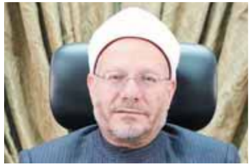
د. شوقي علام