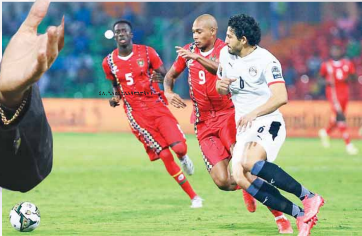
كتب- محمد سعيد

الفراعنة يتحزون لصيد صقور الجديان «كيروش» يضغط هجومياً.. ومهام خاصة لـ«السولية» و«البنى»