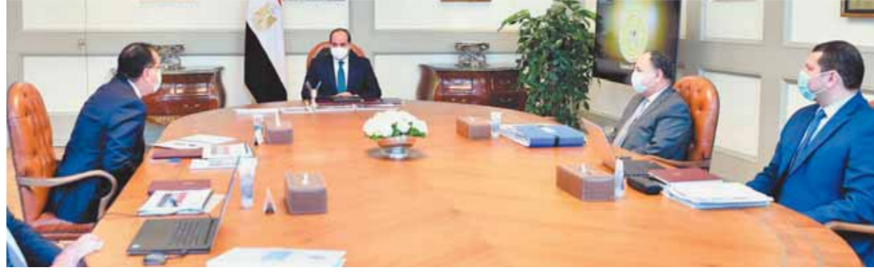
الرئيس السيسي خلال اجتماعه أمس برئيس الوزراء ووزير المالية

تعيين ٣٠ ألف مدرس سنوياً وحافز إضافي للمعلمين وأعضاء هيئات التدريس بالجامعات