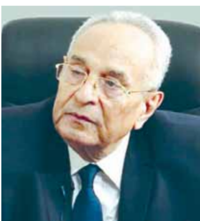
بهاء أبو شقة