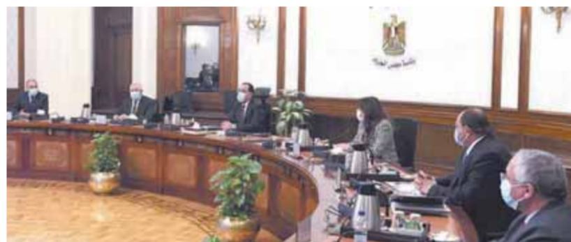
رئيس الوزراء خلال اجتماعه بوزير الزراعة وعدد من المسؤولين

الصيد المخالفة نهائياً، وكذا منع صيد الزريعة من البحيرات المتصلة بالبحر، وأيضاً تدعيم البحيرات الملقية بالزريعة المطلوبة لها. كما عرض وزير الزراعة خلال الاجتماع أبرز ملامح المشروع القومي لزراعة قصب السكر بنظام الشتلات، الذي يستهدف تحديث طرق زراعة قصب السكر باستخدام تقنيات إنتاج شتلات القصب، للتغلب على مشاكل الزراعة التقليدية. وأشار الوزير إلى أن الأسباب التي دفعت إلى تحديث زراعة قصب السكر بنظام الشتلات هي أن النظام التقليدي المتبع ينتج عنه انخفاض متوسط إنتاجية الفدان، وصعوبة مكافحة الحشائش نظراً لعدم القدرة على استخدام المبيكة، إلى جانب زيادة الاستهلاك المائي، الذي يصل إلى أكثر من ١٠ آلاف م ٣ لكل فدان؛ نظراً لأن الري بالغمر لا يمكن معه التحكم في كميات مياه الري المستخدمة، وبالتالي زيادة الاستهلاك من الأسمدة، وفقدان جزء كبير منها بسبب زيادة مياه الري المستخدمة.