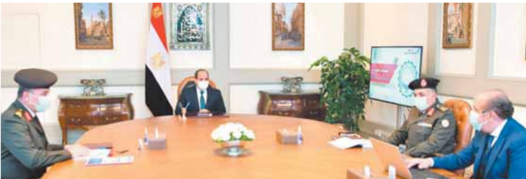
الرئيس خلال اجتماعه بمدير جهاز الخدمة الوطنية وعدد من المسؤولين

اجتمع الرئيس عبدالفتاح السيسي، أمس، مع اللواء أ.ح. وليد أبو الجعد، مدير جهاز مشروعات الخدمة الوطنية للقوات المسلحة، واللواء إيهاب عبدالسميع، رئيس مجلس إدارة شركة التصنيع للكيماويات الوسيطة، والدكتور عبدالمنعم عزمي رئيس مجلس إدارة شركة PII للضمادات الطبية، وصرح السفير بسام راضى، المتحدث الرسمي باسم رئاسة الجمهورية، بأن الرئيس أطلع على التفاصيل الخاصة بمشروع إنشاء مصنع للضمادات الطبية عالية الجودة، وذلك بالشراكة مع الخبرة الكندية، ووفق أعلى المواصفات الدولية المعتمدة، وذلك للمساهمة في تغطية الاحتياجات المحلية ذات الصلة. وقد وجه الرئيس في هذا الإطار بمضاعفة القدرة الإنتاجية المقترحة للمشروع بما يساعد لاحقاً على التصدير للخارج. كما شهد الاجتماع عرض التفاصيل الخاصة بإنشاء مجمع صناعي ضخم في العين السخنة لإنتاج الأسمدة الفوسفاتية والأزوتية، وذلك بالتعاون مع الشركة الأجنبية العريقة في هذا الإطار. وقد وجه الرئيس بتدقيق كل التفاصيل الخاصة بهذا المشروع المهم، وذلك باعتباره إضافة جديدة لمنظومة إنتاج الأسمدة على المستوى المحلي، التي تعد من أهم الدلائل والمستلزمات المؤثرة في الإنتاج الزراعي والأمن الغذائي، بما يساعد على تلبية التوجه الاستراتيجي للدولة لزيادة رقعة الأراضي الزراعية في مصر.