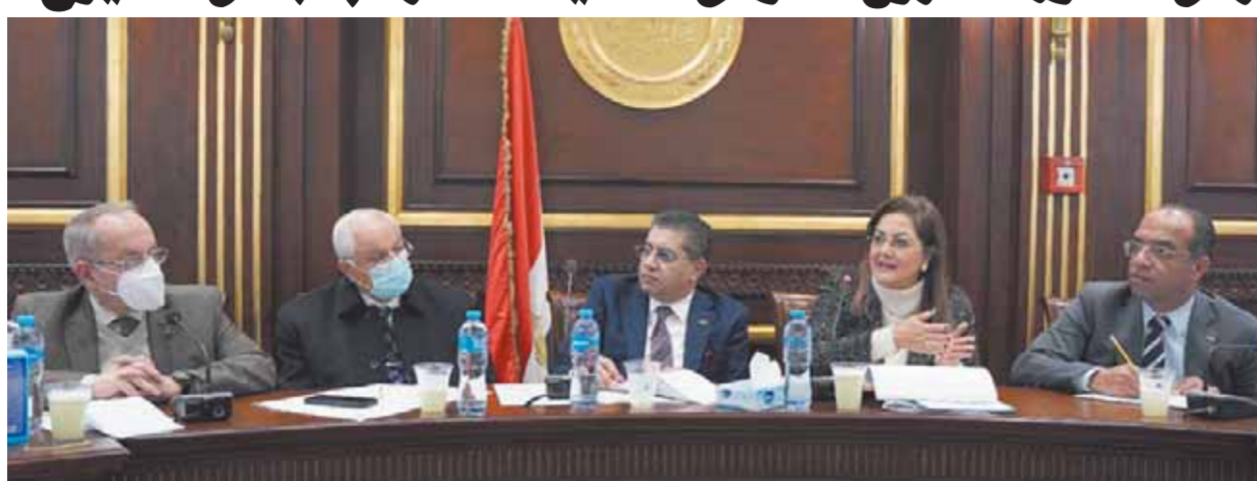
جانب من اجتماع اللجنة المشتركة

الالتزام بالمحددات الدستورية التي تراعى حقوق الإنسان المختلفة وعدم التمييز بين المواطنين، وكذلك «الآثار الإيجابية» التي تنتج عن حق الأسرة في تحديد عدد أبنائها مع تأمين حياتها في المستقبل، والاعتماد على المعلومات وفي الحصول على وسائل تنظيم الأسرة والصحة الإنجابية التي تمكنها من الوصول إلى العدد المطلوب من الأطفال، وكذلك الاهتمام الكبير بصحة المرأة والطفل، مضيفة أن الدراسة أشارت إلى أهمية