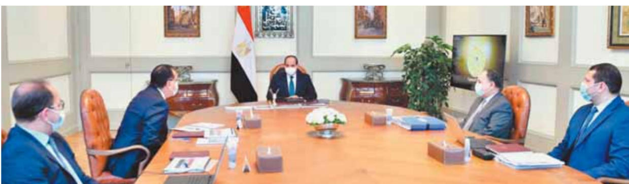
الرئيس السيسي خلال اجتماعه أمس برئيس الوزراء ووزير المالية

المسبق للشحنات، موجهاً بضرورة مراعاة تطبيق كل المعايير العالمية الخاصة بجودة السلع الواردة إلى مصر في هذا الإطار، فضلاً عن العمل على بدء تطبيق نظام التسجيل المسبق للشحنات في الموانئ الجوية.