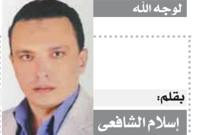
بقلم: إسلام الشافعي