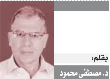
بقلم: د. مصطفى محمود

كاتب- محمد سعيد: وسط حالة معنوية مرتفعة، يخوض المنتخب الوطني الأول مساء اليوم السبت، مرانته الرئيسية على ملعب صامويل كاتيون، في ليبيريا استعداداً لمباراته المرتقبة مع سيراليون، مساء غد الأحد في الجولة الثانية من مناصبات المجموعة الأولى بالمنافسات الأفريقية المؤهلة إلى كأس العالم ٢٠٢٦.