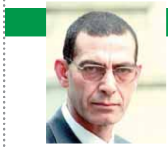
بقلم: د. وجدى زين الدين

شكراً «المتحدة» حرية كاملة للمرشحين في الانتخابات الرئاسية