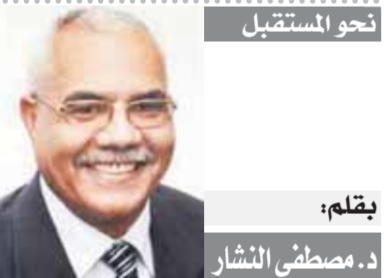
بقلم: د. مصطفى الشار

جيبوتى، اعتراضا على عدم الدفع بهم في المباراة، لذلك قرر مدرب المنتخب فرض نقطة نظام في المسكر واستعدم الثلاثي المتمرد مقررًا السفر إلى ليبيريا بدونهم.