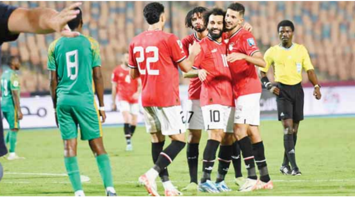
المنتخب ينسى أفراح الفوز على جيپوتى ويستعد لسيراليون

«فيتوريا» يرفض اعتذار «الثلاثي المتمرد».. ويؤكد: لن أقبل أي تهاون في حق المنتخب