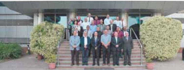
العاملون بمصر للطيران للصيانة والأعمال الفنية وقطعة تذكارية بعد تحقيق اعتماد الأيزاجو