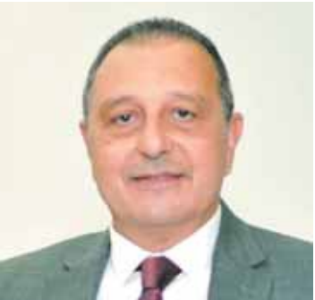
عمرو أبو العينين

نجحت الشركة القابضة مصر للطيران في اجتياز تجديد اعتماد شهادة ISAGO «أيزاجو» الدولية على محطة القاهرة للمرة الثامنة بواسطة فريق التفتيش دون إبداء أي ملاحظات... وبهذه المناسبة توجه الطيار عمرو أبو العينين رئيس الشركة القابضة لمصر للطيران بالتهنئة للعاملين بمصر للطيران وفريق عمل ISAGO لما بذلوه من جهد في معاونة لجنة التفتيش التابعة للاتحاد الدولي للنقل الجوي IATA الذي كان له عظيم الدور في حصول مصر على شهادة اعتماد ISAGO على محطة القاهرة، كما أشى على تفوق العاملين في تطبيق أعلى معدلات السلامة بما يتوافق مع المعايير الدولية، كما أكد أبو العينين أن هذه الاعتمادات الدولية تزيد من مكانة الشركة الوطنية على المستويين الإقليمي والدولي وتسهم في جذب المزيد من عملاء مصر للطيران من شركات الطيران الأجنبية والعربية لتقديم الخدمة لهم، ومن جانبها أشادت لجنة التفتيش بجميع الإجراءات المنبعا والمرجعات الفنية دون وجود أي نقاط أو ملاحظات فنية بما يتناسب مع مكانة وعراقة الشركة الوطنية مصر للطيران التي تعد من أقدم شركات الطيران بالقارة الأفريقية ويمتد تاريخها إلى ٩٠ عاماً. وشملت المرجعات جميع أنشطة الخدمة الأرضية لقطاع الركاب والطائرات وأنشطة المحطة والخدمة الأمنية