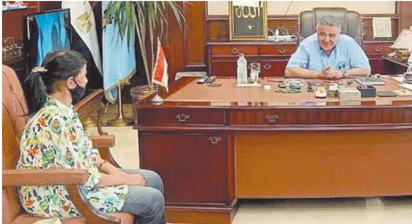
اللواء عمرو حنفي خلال حوار مع «الوفد»

بـ ٦٠٠ أجهزة وه أسرة وخزان أكسجين بسعة ١٢ تقسيم، وتمت تغطية ٢ تقسيم بالكامل، وعمل ووافع وخدمات، وكانت هناك موعات تتمثل في أن التربة الموجودة لتزويد تركيب الصرف الصحي تربة طفيلية، وتم التغلب على هذه المشكلة بعمل تدعيمات تركيب وصلات الصرف، علما بأن الصرف الصحي يغلى ٥٠٪ من مدينة الغردقة وجزء واحد