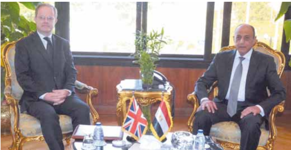
وزير الطيران خلال لقائه السفير البريطاني بمصر

التنمية الشاملة وزيادة معدلات النمو الاقتصادي، كما أنها لا تدخر جهداً في دعم أوجه التعاون والتدريب وتبادل الخبرات بين البلدين في مجال الطيران المدني، مشيداً بالتعاون المثمر بين مصر وبريطانيا في مختلف أنشطة الطيران في ظل العلاقات الوطيدة بين البلدين.. ومن جانبه أعرب السفير البريطاني عن شكره وتقديره لوزير الطيران على تعازيه في وفاة الملكة إليزابيث الثانية، مشيراً إلى التعاون الوثيق بين مصر وبريطانيا في مجال النقل الجوي في ضوء العلاقات التاريخية والتجارية بينهما.. وأشاد السفير البريطاني بالإجراءات التطبيقية في المطارات المصرية التي تتوافق مع أعلى المعايير العالمية لأمن وسلامة الطيران، موضحاً أن بلاده تتطلع إلى مزيد من التعاون بما يسهم في تدعيم الحركة الجوية والسياحية، حيث إن السائح البريطاني يفضل السفر إلى مصر كوجهة سياحية لما تمتلكه من مقومات سياحية وأثرية متنوعة وفريدة، متمنياً مزيداً من التطور لقطاع الطيران المدني المصري في ضوء المشروعات التنموية التي تشهدها الدولة المصرية الحديثة.