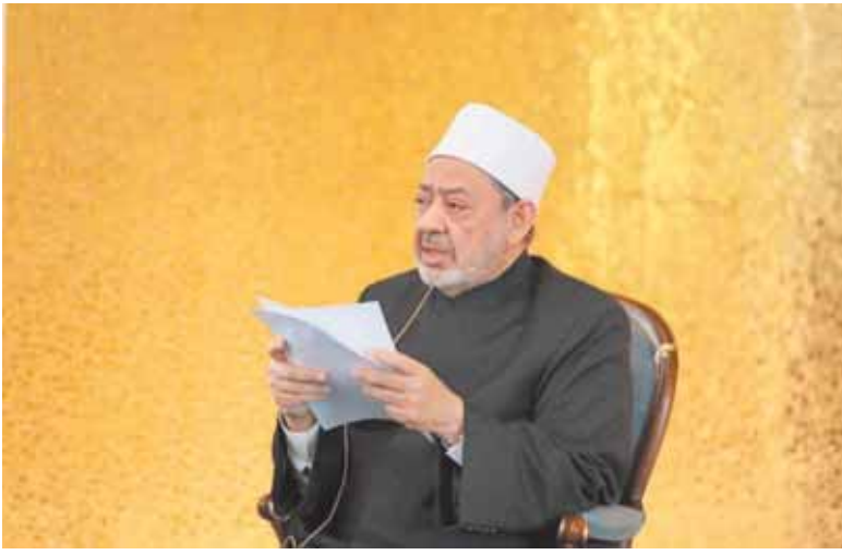
د. أحمد الطيب

استذكر الإمام الأكبر اقتراح بعض الحروب على مر التاريخ باسم الدين، وإراقته لدماء الناس تحت لافتته، مؤكد أن الدين لم يبع قتل الأتس وسفك الدماء، وأن ما حدث إنما هو احتطاف لراية الدين لتحقيق أغراض