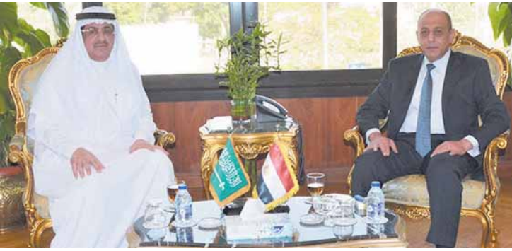
مباحثات مصرية - سعودية في لقاء وزير الطيران ووزير الدولة عضو مجلس الوزراء السعودي