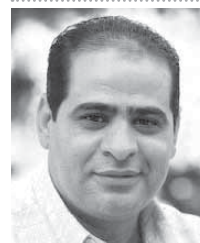
رسالة الكاميرون مصطفى جويلي

يبدأ الفريق الأول لكرة القدم بنادى الزمالك أولى خطوات مشواره الإفريقى بمواجهة إيليكيت سبورت التشادى في تمام الخامسة عصر اليوم بتوقيت القاهرة في ذهاب الدور التمهيدي لدورى أبطال إفريقيا باستاد أحمدو أويديو بالعاصمة الكاميرونية ياوندى. يدخل الأبيض المباراة مواجهاً المجهول خصوصاً أن المعلومات المتوفرة لديه ليست كثيرة بسبب ندرة الفيديوهاات التي حصل عليها للمنافس الذى لم يشارك في البطولات الإفريقية سوى ثلاث مرات لعب خلالها ثمانى مباريات لم يحقق الفوز سوى فى مباراة واحدة وخسر ثلاث مرات وتعادل فى أربع. حرص البرتغالى فيريرا على عقد جلسة مع معاونيه فور الوصول إلى ياوندى أمس الأول بعد تناول طعام العشاء لدراسة التقرير الذى تم إعداده عن المنافس ووضع الخطة المناسبة والتي وضع أنها ستعتمد على اللعب عن طريق التأمين الدفاعى الجيد من منتصف الملعب مع الاعتماد على المرتدات السريعة خصوصاً في الشوط الأول للتعرف على طبيعة لعب المنافس ومعرفة نقاط القوة والضعف مع تغيير خطة اللعب في الشوط الثانى بحسب رؤية فيريرا لأداء الفريق التشادى. وأكد فيريرا أنه سيلعب من أجل تحقيق الفوز حتى يستريح في لقاء العودة الذى سيقام الأحد المقبل باستاد القاهرة الدولى.