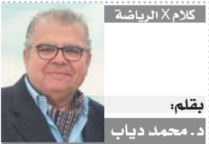
كلام X الرياضة