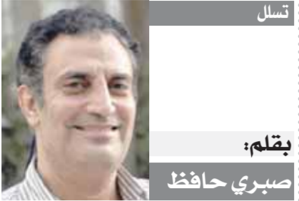
يقلم: صبري حافظ

«أكرم توفيق» يطلب المشاركة فى المباريات.. وإراحة «ديانج» لنهاية الدورى