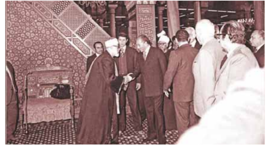
الشيخ الحصري يصفاح الرئيس الراحل أنور السادات بمسجد الحسين