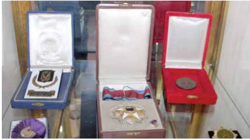
بعض الأوسمة والنياشين التي حصل عليها الحصري