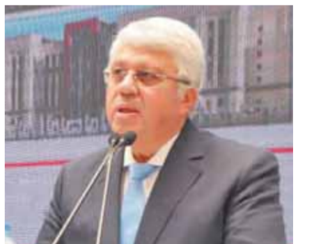
عاشور وزير التعليم العالي

كتب - صلاح شرابي: أعلن الدكتور محمد أمين عاشور، وزير التعليم العالي أمس نتائج تنسيق المرحلة الأولى للقبول بالجامعات الحكومية، إلى جانب بدء تنسيق المرحلة الثانية، وذلك في مؤتمر صحفي بحضور السيد عطا المشرف العام على مكتب التنسيق والدكتور عادل عبدالغفار المستشار الإعلامي والمتحدث الرسمي للوزارة. وجاءت كليات الطب البشري في المرتبة الأولى بـ ٩١,٠٦٪، ثم طب الأسنان بنسبة ٩١,٣٤٪، والعلاج الطبيعي ٩٠,٧٣٪، والصيدلة ٩٠,٦٥٪. وللشعبة الرياضيات ٨٢,٦٥٪. وفي المجموعة الأدبية، جاءت كليات الاقتصاد والعلوم السياسية في المرتبة الأولى بـ ٨٢,٩٢٪، تليها كلية الألسن بـ ٨٠,٢٤٪، والإعلام ٧٧,٠٣٪، والآثار ٧٦,٨٢٪.