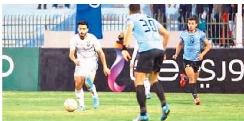
المحلة والجونة.. لقاء للابتعاد عن الهبوط