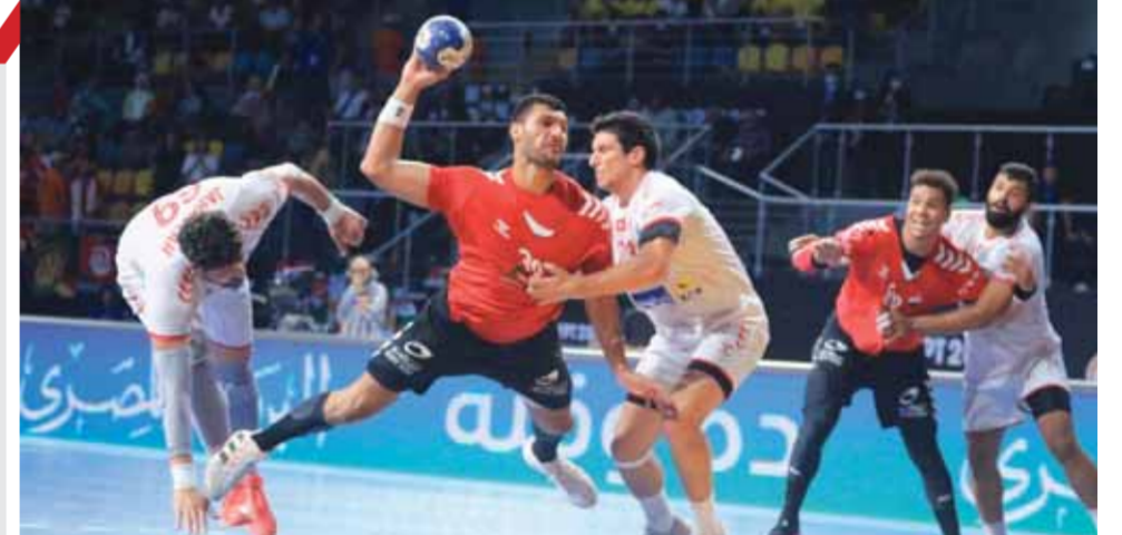
منتخب اليد يسعى للفوز بلقب أمم أفريقيا

وتوجه لاعبو الأبيض إلى الجماهير للاحتفال معها عقب انتهاء المباراة، وحرصت الجماهير على توجيه التحية لجميع لاعبي الفريق والجهاز الفنى ومطالبهم باستمرار الانتصارات والفوز بالدرع للموسم الثانى على التوالى.