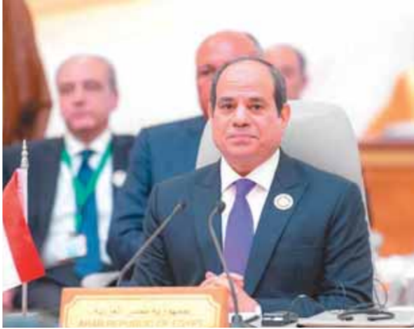
الرئيس السيسي يشارك في فعاليات حوار بيترسبرج للمناخ بألمانيا

كتب - ناصر عبد الجيد: بدأ الرئيس عبد الفتاح السيسي يومين إلى مدينة برلين الألمانية، وذلك بناءً على دعوة المستشار الألماني «أولاف شولتز» للمشاركة في فعاليات «حوار بيترسبرج للمناخ» اليوم، وذلك برئاسة مشتركة بين مصر وألمانيا. وصرح السفير بسام راضي المتحدث الرسمي باسم رئاسة الجمهورية بأن «حوار بيترسبرج» يعد إحدى المحطات المهمة قبل انعقاد الدورة المقبلة من قمة المناخ العالمية بمدينة شرم الشيخ في شهر نوفمبر القادم، وذلك لما يمثلته من فرصة للتشاور والتنسيق بين مجموعة كبيرة من الدول الفاعلة على صعيد جهود مواجهة تغير المناخ، حيث تأتي دعوة مصر للرئاسة المشتركة لهذا المحفل الهام تقديراً للدور الحيوي الذي تقوم به مصر بقيادة الرئيس في إطار مفاوضات تغير المناخ على مدار السنوات الماضية. ومن المقرر أن تشهد زيارة برلين لقاء الرئيس مع عدد من المسؤولين الألمان، وعلى رأسهم المستشار الألماني «أولاف شولتز» وذلك ليبحث سبل تعزيز العلاقات الثنائية على كافة الأصعدة، في إطار حرص البلدين على تدعيم التعاون بينهما ومواصلة التشاور المكثف حول القضايا ذات الأهمية المشتركة.