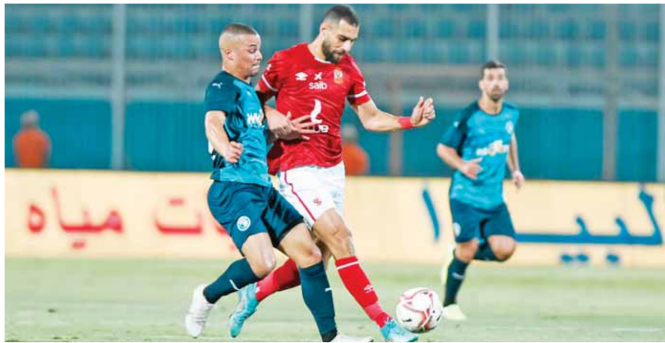
الأهلى خسر من بيراميدز بثنائية نظيفة