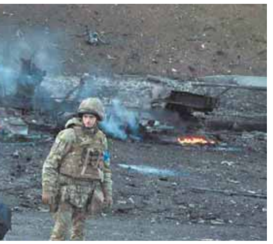
تقرير المخابرات البريطانية حول المزايم الروسية في أوكرانيا

كتب - أحمد الأطرش: في تقريرها اليومي للحرب، ركزت وزارة الدفاع البريطانية على القتال في إقليم دونباس، وكيف أن الوضع الحالي يعيد لصالح الجيش الأوكراني، ففي اليوم ١٤٤ من الغزو الروسي لأوكرانيا، بدأ القتال في دونباس يتبدل مرة أخرى، حيث زاد الجيش الروسي من عملياته الهجومية في المنطقة. وقالت المخابرات العسكرية البريطانية إن العمليات الهجومية الروسية لا تزال محدودة من حيث النطاق والحجم، حيث تركز القتال غرب ليسيتشانسك على سيفيرسك وباخموت، وعلى الرغم من المزاعم الروسية لدخولها ضواحي مدينة سيفيرسك في وقت سابق من الأسبوع الماضي، قدمت روسيا في السابق مزاعم نجاح سابقة لأوانها وكاذبة. وأشارت المخابرات البريطانية إلى أن هذا على الأرجح يهدف إلى إظهار النجاح