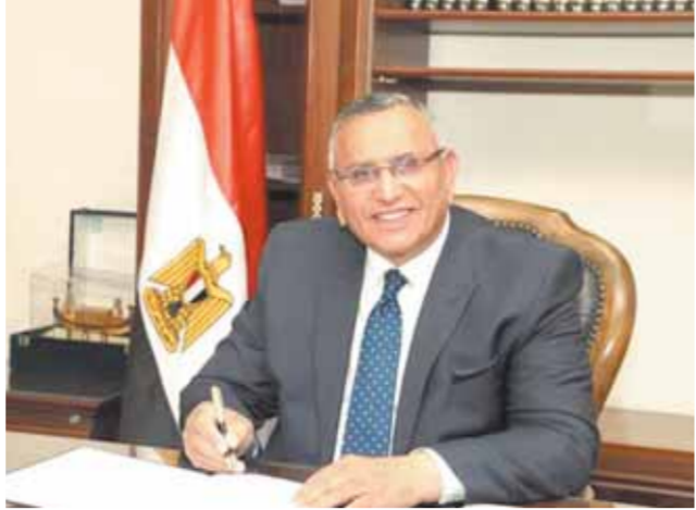
الوفد يشيد بكلمة «السياسي» أمام قمة جدة للأمن والتنمية