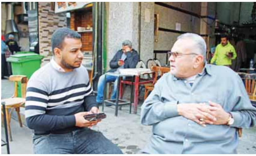
محرر الوفد يعايش المواطنين أهمهم على المقاهى