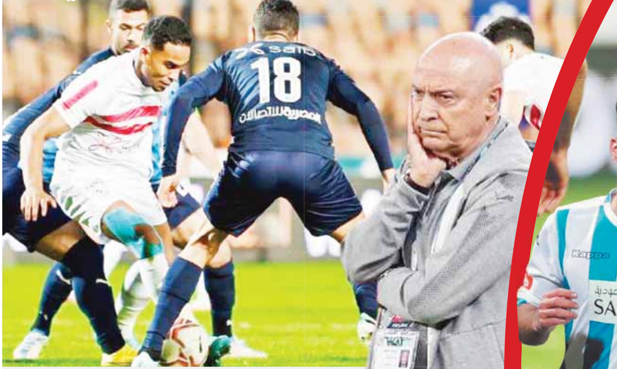
الزمالك ودع الكأس أمام بيراميدز