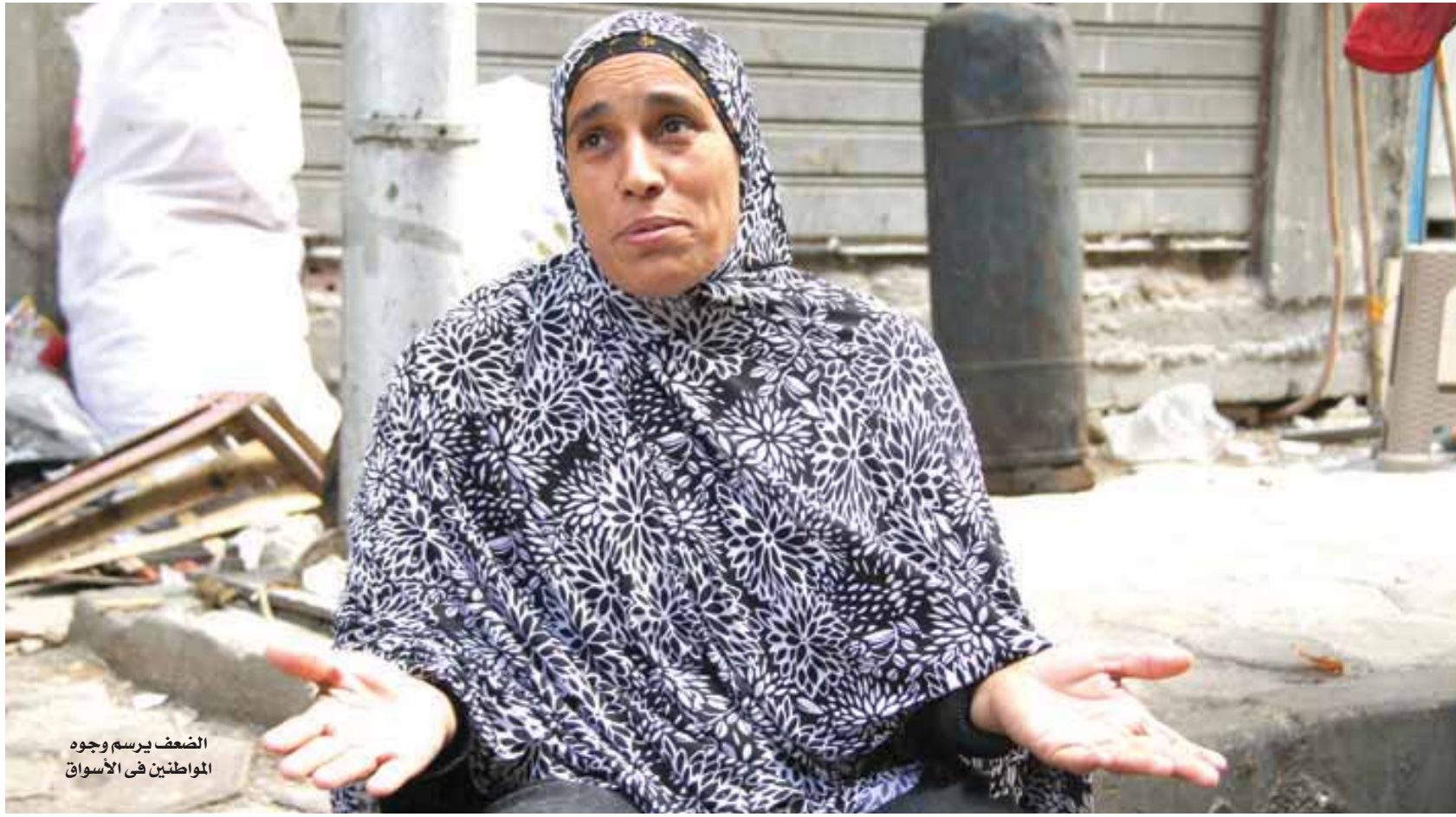
الضعف يرسم وجود المواطنين في الأسواق