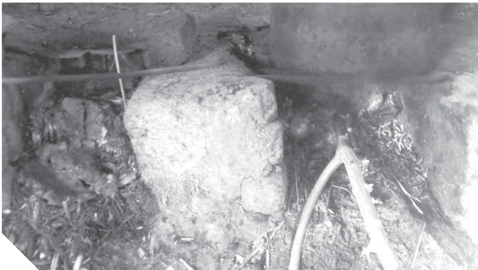
الادوات البدائية تعود من جديد في سوهاج بسبب أزمة الأتالبيب