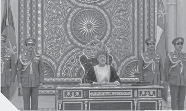
السلطان هيثم بن طارق على العهد باق وسياسة عمان ستتمضى على ذات المسار داخليا وخارجيا