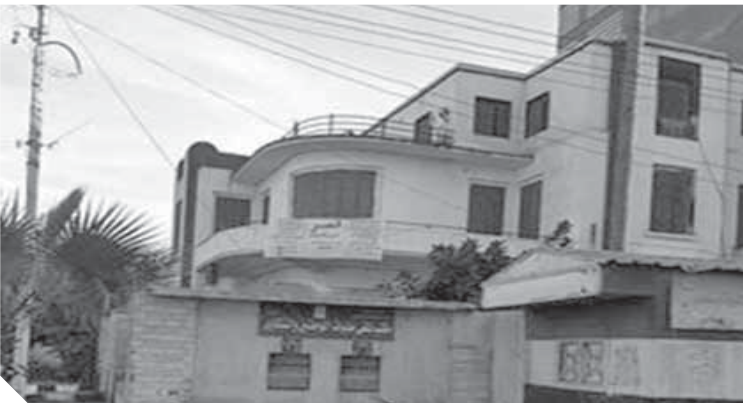
قصر النحاس باشا بسمنود

أو صالة أفراح. وأضاف «بدره» أن سمنود هى المدينة الوحيدة فى الغربية التى ليس بها قصر ثقافة أو مكتبة عامة. وتساءل: لماذا لا يتم