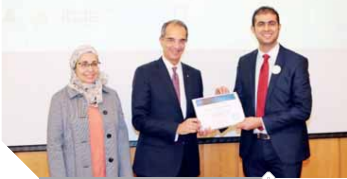
وزير الاتصالات خلال حفل تخريج المتدربين

ومعمل الاختبارات. وفى كلمته التى ألقاها فى حفل تخريج المتدربين: أكد الدكتور عمرو طلعت أن افتتاح المركز يؤكد أننا ماضون فى تنفيذ استراتيجية متكاملة لبناء مصر الرقمية على أحدث تقنيات الاتصالات وتكنولوجيا المعلومات؛ التى تستلزم توافر شبكة عريضة من الألياف الضوئية وكذلك توافر كوادر بشرية مدربة وقادرة على بناء هذه الشبكة وإدارتها وصيانتها وتادية خدمات ما بعد تشغيلها عبر كافة المدن والمحافظات فى ظل مشروعات الدولة لبناء منظومات رقمية ومدن جديدة بالإضافة الى إنشاء العاصمة الادارية الجديدة.