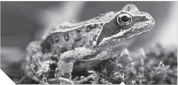
أول روبوت من خلايا حية

التصميم. وقال عالم الكمبيوتر فى جامعة فيرمونت جوشوا، إن هذه الروبوتات عبارة عن آلات حية وليست روبوتات تقليدية ولا نوعا جديدا من المخلوقات، وهى تستلحق التحرك على شكل دوائر، ويمكنها أن تدفع بصورة جماعية كريات إلى موقع مركزى، إنها كائنات حية قابلة للبرمجة، ويمكن استخدام الروبوتات الحية فى التوصيل الذكى للأدوية عن طريق كائنات اكسينوبوت، الدقيقة لنقل الدواء داخل جسم المريض، أو