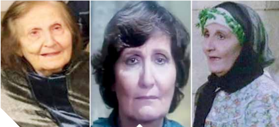
الضائفة القديرة نادية رفيق

اعتزالها، ونشر نجلها «فاضل» عبر صفحته الشخصية على موقع التواصل الاجتماعى «فيس بوك»، قائلاً: «أمى ماما نانا لبقها أحفادها بزم الغلابة» كما يعرفها البعض.. الفنانة القديرة نادية رفيق أتمت مهمتها الدنيوية تجاه أولادها وأحفادها وأحبائها على خير وجه وغادرت أرض الشقاء إلى الفردوس الأعلى.. صلى لنا يا ماما».