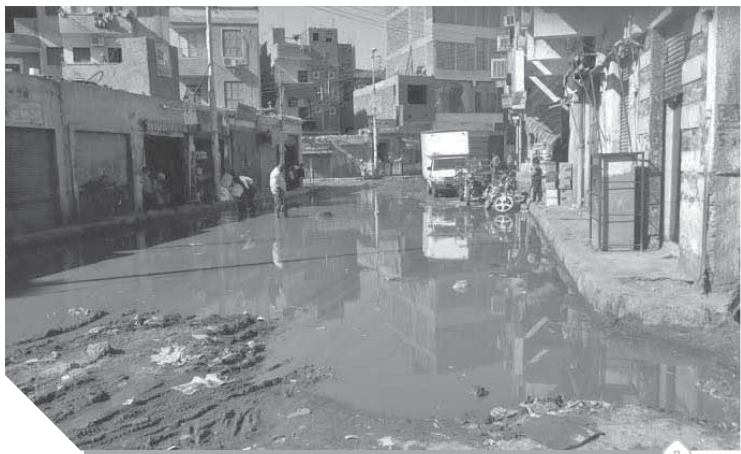
شوارع نجع الشواهد تفرق في مياه الصرف الصحي