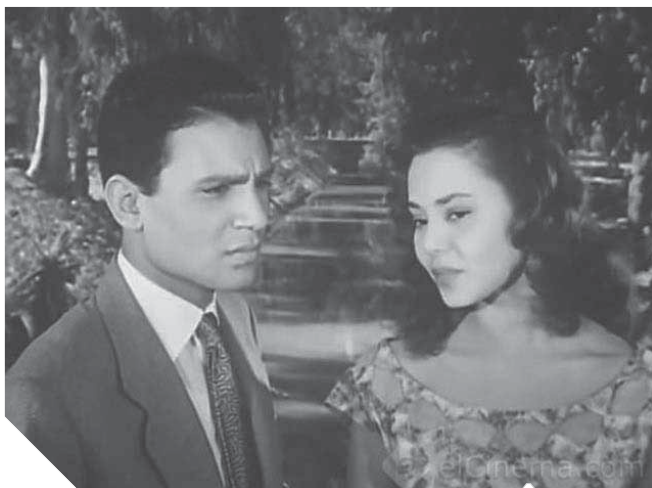
.. ومع التعديل