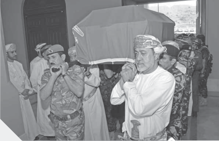
تشجيع جثمان المغفور له السلطان قابوس بن سعيد