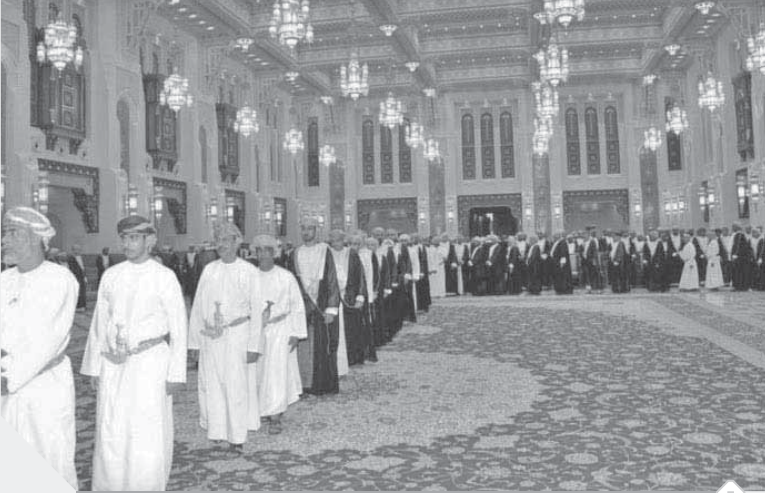
جموع العمانيين ما زالوا يقدمون التعازى في وفاة السلطان قابوس بن سعيد