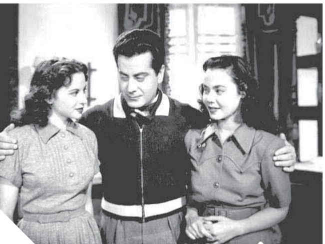
ماجدة وفريد الأطرش وفاتن حمامة