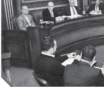
اجتماع لجنة الصناعة بمجلس النواب

ويرى مدود زكى، عضو غرفة الجيزة التجارية، أن القرار تأخر كثيراً وخاصة عندما تأكد للجميع