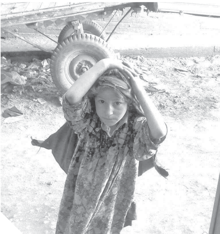
استغلال الأطفال في أعمال التسول فى بنها

طالب العشرات من مواطنى مدينة بنها والوافدين عليها بتدخل عاجل من اللواء عبدالحاميد الهجان، محافظ القليوبية، لمواجهة مشكلة استغلال الأطفال فى أعمال التسول والأعمال غير المشروعة. وأكد مواطنو المدينة ضرورة تدخل المحافظ وتدخل مسئولى أجهزة حماية الطفولة بالمحافظة والمجلس القومى للمرأة والتضامن الاجتماعى وغيرها من الأجهزة لمواجهة استغلال الأطفال الصغار فى التسول بالشوارع واستعطاف المواطنين من أجل منحهم القليل من النقود وتعرض هؤلاء الأطفال للمضايقات والقهر النفسى من قبل من يقومون على تشغيلهم وعملهم.