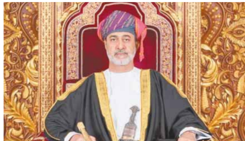
السلطان هيثم بن طارق سلطان عمان

جديد ومقال وحوار وتقدير بالكلمة الصادقة والصورة الحقيقية، والعنوان الكبير الذي يضع عمان دائماً وأبداً في صدر الصفحة الأولى. على مدى ٥٠ عاماً، انتقلت جريدة (عمان) من مرحلة من مرحلة من التطور إلى أن وصلت إلى وجهها المشرق الجلالة السلطانية هيثم بن طارق المعظم- حفظه الله كريمة في عهد السلطان الراحل قابوس بن سعيد- طيب ورعاً- ودعمه، كما كانت قد حظيت بدعم ورعاية كريمة في عهد السلطان الراحل قابوس بن سعيد- طيب الله ثراه-، وهذه العناية والرعاية الكريمة من القيادة لهذا الصرح التنويري يحمل المزيد من المسئوليات على عاتق كل من يعمل بجريدة عمان، وهم أهل لذلك. إن مسيرة النجاح الواضحة لجريدة عمان تقف اليوم شاخصاً للجميع، لأن النجاح لا يأتي إلا بالاستمرارية في العطاء، وعمان اليوم ماضية من نجاح إلى نجاح، تواكب كل التطورات العلمية الحاصلة على مستوى الصحافة، والأرقام والإحصائيات توضح النجاحات التي تحققت جريدة عمان. لقد أخذت الجريدة على عاتقها مرحلة التطور الإعلامي، بكل تفاصيلها الحديثة، وضمت تستقطب الكوادر المعنية المؤهلة والناشرة على الإنترنت بالترام، كما وأسلت الجريدة عطاها في مسابرة التطور التكنولوجي ووسائل التواصل الحديثة، بزخم يحرص على الصدقية والنهج الإعلامي المبتن. فقد توغها وثرانها الصحف الكبرى. احتلت (عمان) بممرور ٥٠ عاماً على تأسيسها، والمرحلة الصعبة تحملاً مزيداً من المسئولية تجاه هذه الصحافة التي استارتت بها أطيال وأجيال، وعلى طريق الرقى والتقدم.