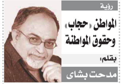
المواطن «حجاب» وحقوق المواطنة

مركز محمد بن راشد للفضاء، للتحقق من عمل المستكشف، وذلك بعد عملية فحص جميع الأنظمة للتأكد من صحة المستكشف راشد، والتي استغرقت نحو ساعتين، حيث تم تأكيد عمل المستكشف بفعالية تامة، واستعداده لبدا المرحلة الثانية وهي مرحلة الملاحة التي تستمر لمدة ٤ أشهر. ولتق فريق مركز التحكم بالمهام الفضائية، في مركز محمد بن راشد للفضاء، حزمة من البيانات لكل ٣٠ ثانية، ما أوضح عمل الأنظمة بفعالية تامة، أعقب ذلك قراءة حرارة الأنظمة والتي كشفت عن صحة أنظمة المستكشف، وتم الانتهاء من العملية، التي استغرقت قرابة ساعتين، بفحص حالة البطارية التي تبين بانها مشحونة بنسبة ٧٨٪ حيث تم توجيه طلب بإعادة شحن المستكشف بالاستعانة بطاقة مركبة الهبوط، ومن المقرر أن يهبب المستكشف الفضائي الإماراتي «راشد» على سطح القمر، في أبريل ٢٠٢٢، حيث يحمل مركبة الهبوط الباهائية «هاكتورز» آره، على متن صاروخ الإطلاق «سيبس إسكس فالكون تسعة».