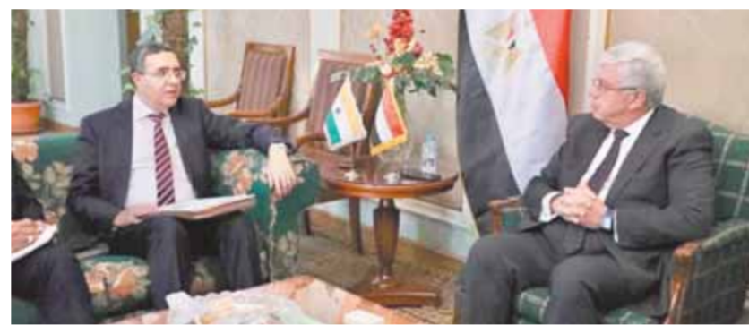
وزير التعليم العالي أثناء استقبال السفير الهندي

التأهيل للاقتصاديات الناشئة عام ٢٠٢٢. وأشار السفير الهندي إلى بعض نماذج التعاون المثمرة مع مصر في مجال التعليم العالي، ومنها اتفاقيات التعاون بين الجامعات الكبرى بالهند ونظيراتها المصرية، ومنها: جامعات عين شمس، وبنى سويف، وكذلك مجموعة السويد، فضلاً عن التعاون في مجالات التكنولوجيا والذكاء الاصطناعي، والبرامج التعليمية المشتركة، وتبادل الطلاب وأعضاء هيئة التدريس. في سياق آخر، أعلن وزير التعليم العالي أمس، عن إطلاق النسخة المحدثة للمنصة الرقمية لخدمات طلاب الإشراف العلمي. وأشار الوزير إلى أن المنصة تهدف إلى ميكنة إجراءات وضع المرشحين المصريين في الخارج تحت الإشراف العلمي لوزارة التعليم العالي والبحث العلمي، وتقديم الخدمات المُختصة للدراسين في الخارج، وذلك وفقاً لأحكام قانون البعثات ١٤٩ لسنة ٢٠٢٢ وبما يتماشى مع رؤية الدولة لتقديم خدمات رقمية وتسهيل الإجراءات وتحسين مستوى الخدمة المقدمة للمواطنين.