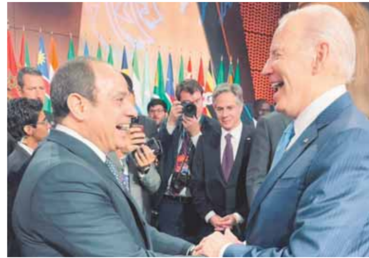
مشاركته في جلسة تعزيز الأمن الغذائي وتعزيز النظم الغذائية بالقمة الإفريقية الأمريكية. وأكد الرئيس أن هناك ارتباطاً وثيقاً بين الأمنين

الغذائي والمائي وتنتظر مصر لهذا الرباط باعتباره أمناً قومياً، بما يحتم توافر الإرادة السياسية لصياغة أطر قانونية لضبط مسار التعاون بين