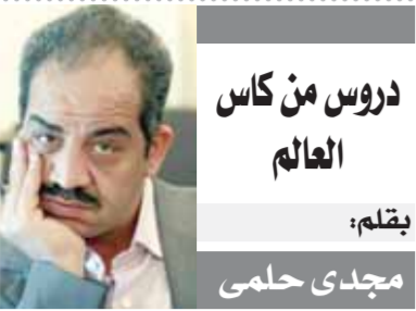
دروس من كأس العالم يقلم: مجدى حلمي

غدا اليوم الأخير في كأس العالم لكرة القدم... شهر من أمتة الكروية والتنظيم الرائع والتشجيع المثالي عشائه وعاشته مليارات البشر... كرة القدم جمعت العالم كله في ٢٢ يوما خلف الشاشات أو في الملاعب... نجوم سلطت في سماء الكرة ونجوم خشت وانتهت مسيرتها تقريبا في عالم الكرة، وفي الشيء الأهم هو الإنجاز العربي للمنتخب المغربي الذي أصبح الآن ضمن الأربعة الكبار في العالم... هذا الفريق الذي أعطى درسا لكل لاعبي كرة القدم في عالمنا العربي أن المواهب الحقيقية تستل من يصنع الفارق في الملاعب وفي أي رياضة أخرى.