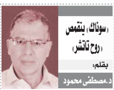
سوناك يتقمص روح تاتش بقلم: د.مصطفى محمود

أسلوب رئيس وزراء بريطانيا «سوناك» في التعامل مع إضرابات ديسمبر، طرح سؤالا مهما: أي نسخة من رئيس الوزراء السابق يريد أن يكون؟ هل تنقذه روح السيدة تاتشر ورد الفعل العنيف ضد ضدها، السخط في 1978-1979 والذي مثل تغييراً جذرياً، في الرأي العام وتوضيحاً لنقص أجنحة، النقابات العمالية. لكنها كانت أيضاً إرغامية قامت في عام 1979 بمنع موظفي القطاع العام زيادة نسبة 7.5% للآجور -ضعف معدل التضخم تقريبا وأكثر من 20% في حصل عليها عمال القطاع الخاص- لتجنب شتاء السخط، الثاني على التوالي. وفي الحقيقة أن الإشارة إلى السمعيات ستثير ذكريات غير مريحة من الإضرابات التي عرفت البلاد في ذلك العقد.. وبلغت ذروتها في شتاء السخط عندما تركت التضام في الشوارع، وظلت الممتدون دون دفن لا يزال استحضار شتاء السخط، وهو سلسلة من الإضرابات منذ أكثر من 24 عاماً، شاتكا في الثقافة السياسية البريطانية في 1978-1979 شارك العمال في سلسلة من الإضرابات احتجاجاً على حدود أجور حكومة حزب العمال آنذاك. استفاد حزب المحافظين، بقيادة مارجريت تاتشر، من هذه الإضرابات كاملة مشرفة على عدم قدرة حزب العمال على السيطرة على مؤيديه في الحركة النقابية أثبتت هذه الاستراتيجية فاعليتها، وانتخب تاتشر في المنصب في 2 مايو 1979 مع تفويض مفرض يقضي أجنحة النقابات العمالية.