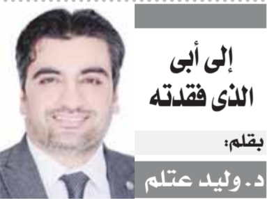
إلى أبي الذي فقدته يقلم: د. وليد عتلم

ومن مظاهر الفضل الكروي أننا نجد مدربين في فرق الدوري لا يحملون رخص تدريب ونجدهم في المباريات الإفريقية يجلسون في المدرجات مثل الجماهير وهو أمر لا يحدث في أي دولة في العالم إلا مصر... ففي كل بلاد العالم نجد الاتحادات الرياضية تأتي بخبرات عالمية في مجال التدريب والتحكيم والإدارة في دورات متخصصة يشارك فيها الجميع للاطلاع على ما هو الجديد في مجال اللعبة إلا في مصر فهناك إدارات فنية في الاتحادات الرياضية لا تعمل ولكنها موجودة فقط للمنظرة وتسيب الأوراق والحصول على الأموال... ولا أعلم حتى الآن دور اللجنة الأولمبية والاتحادات الرياضية ووزارة الرياضة وماذا فعلوا لانقاذ هذا الوضع المتدهور فمصر في السنوات الأخيرة اتخذت طريق التخطيط الاستراتيجي في كل القطاعات فوجدنا مجموعة من الخطط الاستراتيجية في مختلف المجالات إلا الرياضة وهي أكثر مجال يحتاج إلى تخطيط معن وأسناد أدوار محددة لكل اتحاد وهيئة... يتم تنفيذه وفق جدول زمني محدد والعمل على اكتشاف المواهب الملهية بها الريف والمدن المصرية العديدة من أضواء وشلل القاهرة.