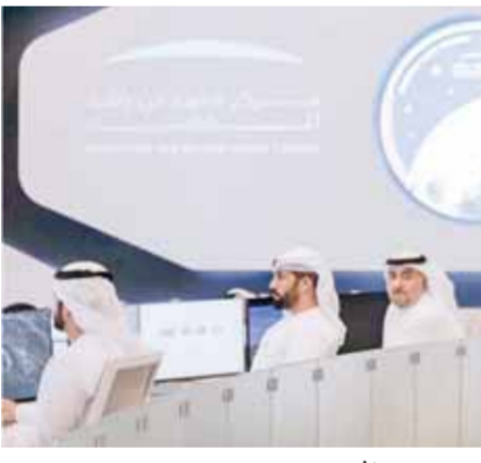
محمد بن راشد

مركز محمد بن راشد للفضاء، للتحقق من عمل المستكشف، وذلك بعد عملية فحص جميع الأنظمة للتأكد من صحة المستكشف راشد، والتي استغرقت نحو ساعتين، حيث تم تأكيد عمل المستكشف بفعالية تامة، واستعداده لبدا المرحلة الثانية وهي مرحلة الملاحة التي تستمر لمدة ٤ أشهر. ولتق فريق مركز التحكم بالمهام الفضائية، في مركز محمد بن راشد للفضاء، حزمة من البيانات لكل ٣٠ ثانية، ما أوضح عمل الأنظمة بفعالية تامة، أعقب ذلك قراءة حرارة الأنظمة والتي كشفت عن صحة أنظمة المستكشف، وتم الانتهاء من العملية، التي استغرقت قرابة ساعتين، بفحص حالة البطارية التي تبين بانها مشحونة بنسبة ٧٨٪ حيث تم توجيه طلب بإعادة شحن المستكشف بالاستعانة بطاقة مركبة الهبوط، ومن المقرر أن يهبب المستكشف الفضائي الإماراتي «راشد» على سطح القمر، في أبريل ٢٠٢٢، حيث يحمل مركبة الهبوط الباهائية «هاكتورز» آره، على متن صاروخ الإطلاق «سيبس إسكس فالكون تسعة».