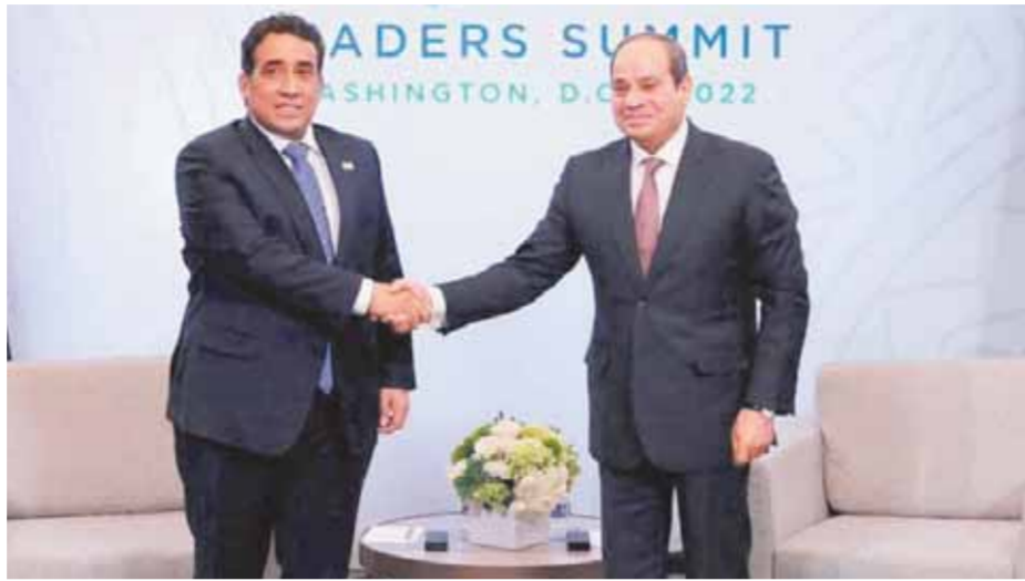
الدول التي تشارك الموارد المائية وبما يسهم في تحقيق التنمية دون إلحاق ضرر ذي شأن. ولم ينس الرئيس الملف الليبي الذي يرتبط

بالأمم المتحدة، حيث التقى الرئيس عبدالفتاح السيسي برئيس المجلس الرئاسي الليبي محمد المنفي، وذلك على هامش فعاليات القمة الإفريقية بالعاصمة واشنطن. وشهد اللقاء التباحث حول مستجدات الأوضاع على الساحة الليبية، حيث شدد الرئيس على موقف مصر الثابت من دعم جهود المجلس الرئاسي الليبي برئاسة السيد محمد المنفي وإنجاح هذه الجهود ومساعدة الأشقاء الليبيين على تهيئة المناخ المطلوب من أجل تنفيذ الاستحقاق الانتخابي الرئاسي والبرلماني بالتزامن، وذلك ارتباطاً بانعكاساتها الإيجابية على الجهود السياسية لإنهاء الأزمة الراهنة من خلال تفعيل إرادة واختيار الشعب الليبي. من جانبه، أكد رئيس المجلس الرئاسي الليبي التقدير والاعتزاز الشديد من قبل بلاده على المستويين الرسمي والشعبي للدور المصري الحيوي بقيادة السيد الرئيس في استعادة السلم والاستقرار في ليبيا، وذلك في ظل العلاقات الأخوية والتاريخية التي تربط بين البلدين الشقيقين، والدور المصري الرائد تحت القيادة الحكيمة للسيد الرئيس، لاسيما فيما يتعلق بدعم المؤسسات الوطنية الليبية.