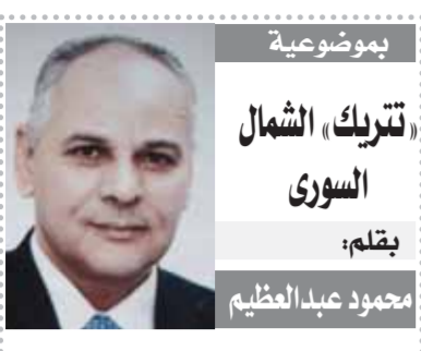
بموضوعية تترك الشمل السوري بقلم: محمود عبد العظيم