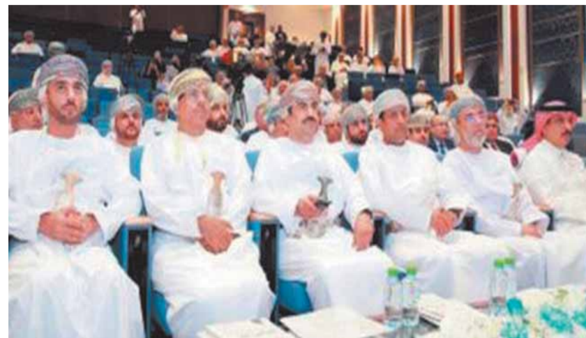
وزير الإعلام العماني الدكتور عبدالله الحرصي

جديد ومقال وحوار وتقدير بالكلمة الصادقة والصورة الحقيقية، والعنوان الكبير الذي يضع عمان دائماً وأبداً في صدر الصفحة الأولى. على مدى ٥٠ عاماً، انتقلت جريدة (عمان) من مرحلة من مرحلة من التطور إلى أن وصلت إلى وجهها المشرق الجلالة السلطانية هيثم بن طارق المعظم- حفظه الله كريمة في عهد السلطان الراحل قابوس بن سعيد- طيب ورعاً- ودعمه، كما كانت قد حظيت بدعم ورعاية كريمة في عهد السلطان الراحل قابوس بن سعيد- طيب الله ثراه-، وهذه العناية والرعاية الكريمة من القيادة لهذا الصرح التنويري يحمل المزيد من المسئوليات على عاتق كل من يعمل بجريدة عمان، وهم أهل لذلك. إن مسيرة النجاح الواضحة لجريدة عمان تقف اليوم شاخصاً للجميع، لأن النجاح لا يأتي إلا بالاستمرارية في العطاء، وعمان اليوم ماضية من نجاح إلى نجاح، تواكب كل التطورات العلمية الحاصلة على مستوى الصحافة، والأرقام والإحصائيات توضح النجاحات التي تحققت جريدة عمان. لقد أخذت الجريدة على عاتقها مرحلة التطور الإعلامي، بكل تفاصيلها الحديثة، وضمت تستقطب الكوادر المعنية المؤهلة والناشرة على الإنترنت بالترام، كما وأسلت الجريدة عطاها في مسابرة التطور التكنولوجي ووسائل التواصل الحديثة، بزخم يحرص على الصدقية والنهج الإعلامي المبتن. فقد توغها وثرانها الصحف الكبرى. احتلت (عمان) بممرور ٥٠ عاماً على تأسيسها، والمرحلة الصعبة تحملاً مزيداً من المسئولية تجاه هذه الصحافة التي استارتت بها أطيال وأجيال، وعلى طريق الرقى والتقدم.