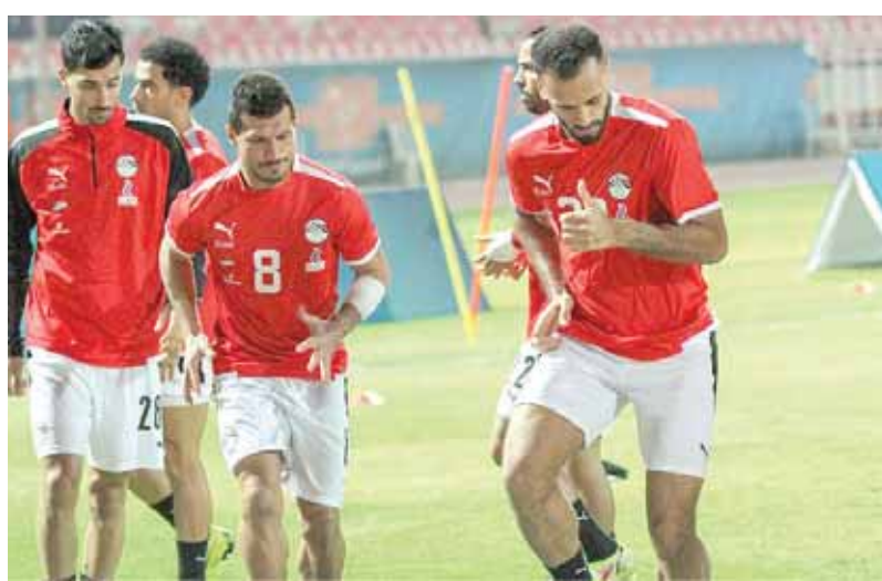
تدريبات قوية للمنتخب استعدادا لمواجهة بلجيكا