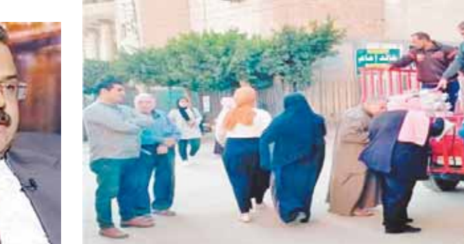
سيارات التموين تباع الأرز في الشوارع