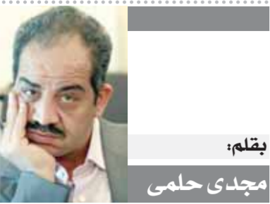
يقلم: مجدى حلمي

اتخذت محافظة القاهرة، بالتعاون مع مؤسسات المجتمع المدنى، خطوات فعلية نحو بيئة نظيفة، والحد من الزحام من خلال مشروع «كايرو بايك»، الذى جرى تعميمه ونشره فى منطقة وسط البلد، لتشجيع ثقافة ركوب الدراجات بين المواطنين والشباب، بديلاً عن استخدام السيارات الخاصة، حيث يمكن التنزه أو الوصول للعمل أو السكن أو الجامعة، أو