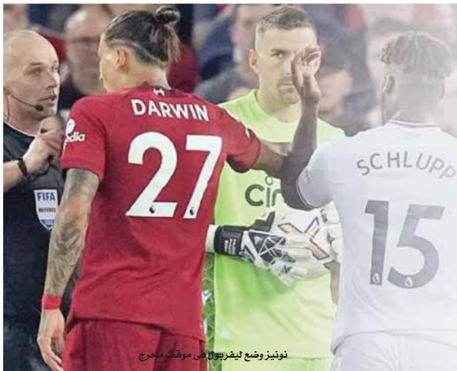
نونيز وضع ليفربول فى موقف محرج

رئيس المنتدى الاستراتيجى للتنمية والسلام