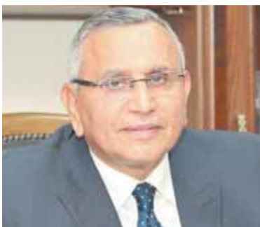
د. عبدالسند يمامة

د. عبدالسند يمامة: مصر والسودان شعب واحد تربطهما أواصر أخوية وتاريخية راسخة