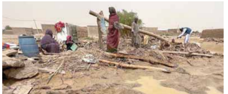
فيضانات السودان تجتاح الولايات وتدمر كل ما في طريقها