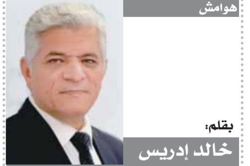
بقلم: خالد إدريس