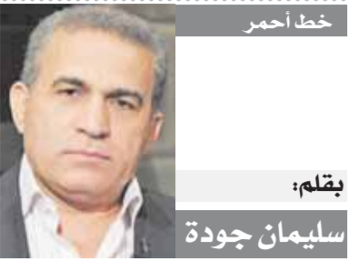
بقلم: سليمان جودة