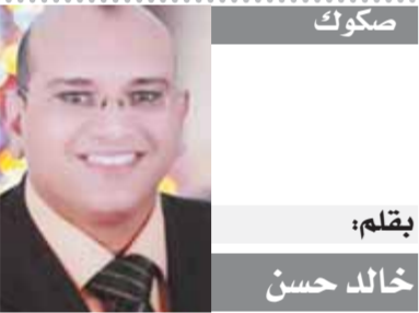
بقلم: خالد حسن

ومن المعروف أيضاً أن قضية تعليم البنات محل خلاف داخل الحركة منذ مجيئها إلى السلطة، وأن الغالبية من قياداتها ترى أن تعليم البنات يجب أن يتم وفق قواعد شرعية محددة، ولأن هذه القواعد ليست متوفرة في الوقت الحالي، فإن كل بنت أفغانية تواجه مشكلة في الذهاب إلى المدرسة، إلى أن ترى طالبان أن القواعد الشرعية صارت متوفرة في البلاد! ولا تزال قضية تعليم البنات سبباً في أن الولايات المتحدة الأمريكية لا تعترف بحكومة طالبان، ولا توافق على فك الحظر عن الأموال الأفغانية المجمدة في البنوك الأمريكية! ومن قبل كانت ملالا يوسفزاي قد تعرضت لاعتداء على حياتها على يد حركة طالبان باكستان، وكان عنصر من الحركة قد صعد إلى الحافلة المدرسية التي كانت تقل ملالا إلى مدرستها ثم أطلق بها الرصاص، بعد أن كان قد نادى عليها بالاسم بعد صعوده الحافلة! تحت ملالا من الحادث بمعجزة سماوية، وأخذوها للعلاج خارج باكستان، وهناك ازداد حماسها لتعليم البنات أكثر وأكثر، واشتهرت في أنحاء العالم، وتعاطف كثيرون معها، وبلغ التعاطف إلى حد أنها حصلت على جائزة نوبل، وكانت ولا تزال أصغر حائزة عليها! ومن ملالا إلى حقاني، سوف تظل قضية تعليم البنات تبحث عن حل في أفغانستان، وسوف يظل على طالبان أن تدرك أن وجودها في الحكم هو لحل مشاكل رعاياها، لا لاصطناع خصومة بين العصر وبين الإسلام!