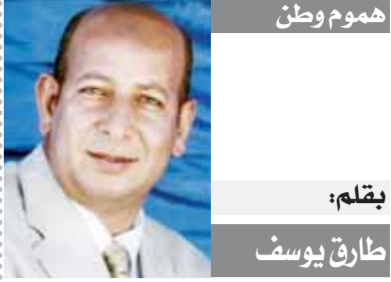
هشام وطن بقلم: طارق يوسف

ويشارك أيضاً فيلم The Banshees of In-Sherin الذي منظر أن يتم عرضه العالمي الأول في مهرجان فينيسيا السينمائي في ٤ سبتمبر ٢٠٢٢. يليه العرض الأول في أمريكا الشمالية في مهرجان تورونتو السينمائي الدولي في نفس الشهر. ومن المقرر أن يمتنع إصداراً مسرحياً محدوداً في ٢١ أكتوبر ٢٠٢٢. هو