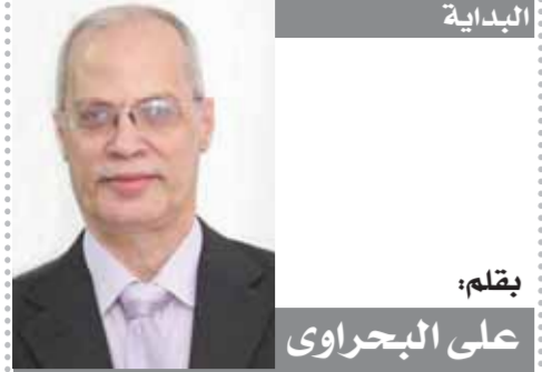
بقلم: علي البحراوي