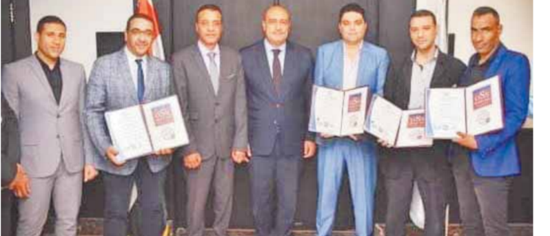
الشنح الجوي تحصد «الأيزو» في الجودة والسلامة والبيئة والصحة المهنية