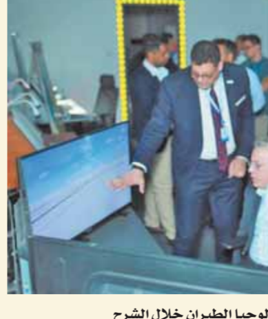
رئيس المتحدة لخدمات تكنولوجيا الطيران خلال الشرح

تصميم إجراءات الهبوط والاقتراب والمغادرة لكل من مطار البحر الأحمر والمدرج المائية بجزر المشروع، كما استعرضت شركة المتحدة، تطويق كافة إمكانياتها من محاكاة برج المراقبة ٣٦٠ درجة، ومحاكي مراقبة المنطقة ومراقبة الاقتراب، وبرج المراقبة التخيلية ومحاكيات الطائرات المستخدمة. وتم تنفيذ تجربة محاكاة حية لأعمال الطيران بالمشروع خلال وقت الذروة المتوقع لعام ٢٠٢٢، تضمنت تشغيل الطائرات التجارية جنباً إلى جنب مع الطائرات المرحلية والبرمائية أيضاً. وأعرب الوفد عن تقديره وبالغ مساهمته، وفتحه بقرارات الشركة المصرية الرائدة في خدمات تكنولوجيا الطيران United ATS وما تملكه من كوادر وإمكانيات جعلها في مرتبة قوية بين كبرى الشركات العالمية الرائدة في مجال تكنولوجيا خدمات تصميم إجراءات الاقتراب والهبوط والمغادرة، وأعرب الوفد عن تعلقه بمزيد من التعاون وتقديره للجهد المبذول في مشروع البحر الأحمر على مدار الفترة الماضية. وفي اليوم الختامي لورشة العمل والتناقشات،