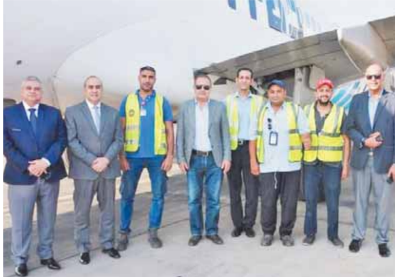
وزير الطيران ونائبه ورئيس القابضة لمصر للطيران والخوطوط خلال تفقد حركة التشغيل بمهبط المطار

التقى وزير الطيران خلال جولته عدداً من المسافرين، حيث هنأهم بسلامة الوصول للمبارك واستمع إلى آرائهم ومدى رضاهم من مستوى الخدمات المقدمة لهم ومقترحاتهم لتطويرها. ووجه وزير الطيران بضرورة تكثيف الجهود والتنسيق المستمر بين مختلف الأجهزة العاملة