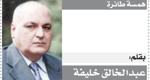
بقلم: عبد الخالق خليفة

أرض الوطن بعد أداء المناسك وتقديم أعلى مستويات من الخدمات لهم ولذويهم والعمل على تيسير إجراءات وصولهم بسهولة ويسر، مشيداً بالتعاون المشر والشعال بين جميع الجهات العاملة بالمطار لتحقيق انتظامية التشغيل والالتزام بمستوى جودة الخدمات المقدمة للمسافرين.