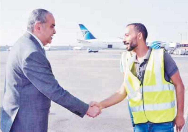
وزير الطيران ونائبه ورئيس القابضة لمصر للطيران والخوطوط خلال تفقد حركة التشغيل بمهبط المطار

الحرّة واستراحات الخدمة المميزة ودرجة رجال الأعمال وبوابات السفر ومنطقة سيور الحقائق، كما تفقد وزير الطيران مهبط الطائرات لمتابعة انتظامية حركة التشغيل بالمهبط والتقى بعدد من العاملين، للاطمئنان على توفير كل ضمانات الأمن والحماية لهم أثناء أداء عملهم.