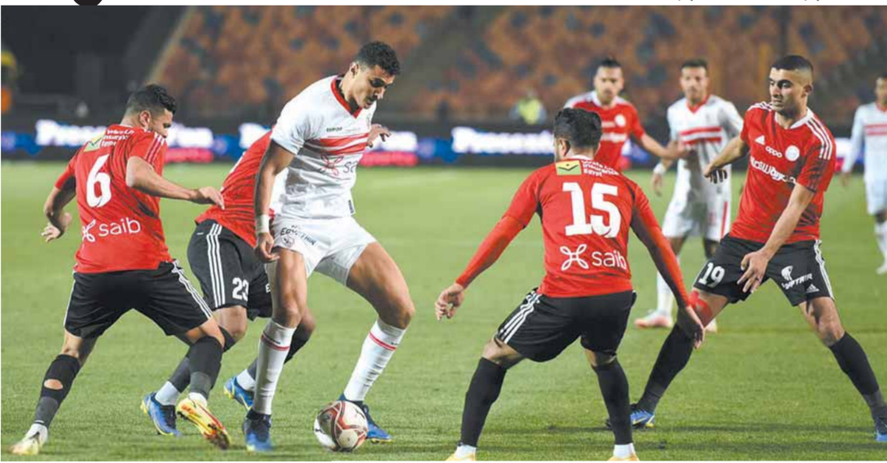
الزمالك يسعى لعبور عقبة الطلائع

استعادة التوازن وتحقيق الانتصارات بعد الهزيمة التي لحقت بالنادى، ورفض الانسحاب من نهائى دورى أبطال أفريقيا فى المغرب (مالي) للمشاركة فى بطولة الأمم الإفريقية بالكاميرون، وهو الموعد الذى تزامن مع انطلاق بطولة العالم للأندية بالأمارات.