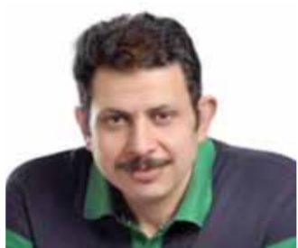
محمد الجندي: تكرار سيناريو العمرة في الحج و(الروابط) مسمى جديد للتأشيريات المباشرة والمجاملة