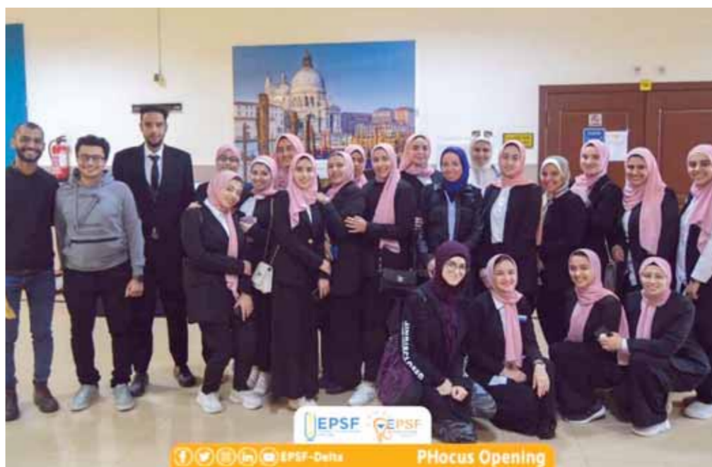
طلاب برنامج الصيدلة

افتتح مكتب الاتحاد المصري لطلاب الصيدلة جامعة الدلتا أحد أهم برامج تطوير وتعليم طلاب الصيدلة في مصر تحت عنوان FOCUS project في دورته الثالثة مشروع فوكس هو بمثابة حلقة الوصل بين طلاب الصيدلة وأحد أهم مجالات العمل الصيدلي وهي الصيدلة الإلكترونية تم افتتاح البرنامج تحت رعاية الدكتور محمد ربيع ناصر رئيس مجلس الأمناء والمهندس أسامة ربيع ناصر نائب رئيس مجلس الأمناء والدكتور يحيى المشد رئيس الجامعة. يسير مشروع فوكس في اتجاهين الأول التعليم الصيدلي عن طريق توجيه كل طلاب الصيدلة وتزويدهم بالمعلومات والمهارات وذلك من أجل توفير الرعاية الصحية وتقديمها بشكل سليم والتالي نشر الوعي عن دور الصيدلي في المجتمع باعتباره أحد أهم مسئولى ومقدمى الرعاية الصحية في مصر. انطلقت فعاليات المؤتمر في جامعة الدلتا بحضور د. حسن الكاشف وكيل كلية الصيدلة جامعة الدلتا لشئون الطلاب. د. ماجدة الشربيني عميد كلية الصيدلة جامعة الدلتا. وبدأ الافتتاح بكلمة من الدكتور أنور محمد رئيس الاتحاد بجماعة الدلتا. وحديث الدكتور حسن الكاشف عن دور الاتحاد المؤثر في توجيه وتدريب طلاب