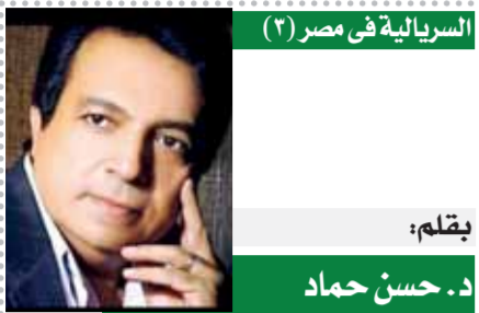
السريالية في مصر (٢)

كما تمت مناقشة عقد عدد من الأنشطة وورش العمل تناول الاجتماع مناقشة عدد من الموضوعات المهمة