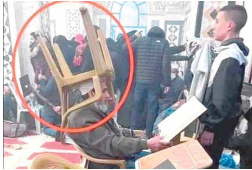
مسن يحيى رأسه بكريسي ويقرأ القرآن خلال اقتحام المسجد الأقصى

واستنكار المملكة العربية السعودية لإقدام قوات الاحتلال الإسرائيلي على اقتحام المسجد الأقصى وإغلاق أبوابه، والاعتداء على المصلين المُؤَلَّد داخل المسجد وفي ساحاته الخارجية، وأدانته الإمارات القدس المحتلة، ودعا في بيان لهم جميع الأطراف ضبط النفس وتوفير الحماية للمصلين، مشيرة إلى موقف الدولة الداعي إلى ضرورة احترام السلطات الإسرائيلية حق الفلسطينيين في ممارسة شعائرهم