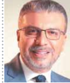
بقلم: د. عمرو الليثي

معلوم الحديث «استفت قلبك» من الأربعين النووية، الأريعون في مبادئ الإسلام وقواعد الأحكام المعروفة بالأربعين النووية، وهي متن اشتمل على اثنين وأربعين حديثاً جميعها «يحيى بن شرف النووي» المتوفى ٦٧٢ هـ.