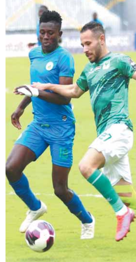
المصرى فى مهمة صعبة أمام بركان