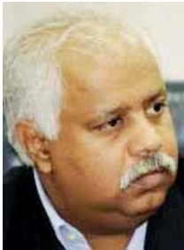
بقلم: حمدي رزق

مدرسة الهلالي يصح وصفها بمدرسة «العصف الذهني»، يعصف الهلالي بالذهن الرائد، بفكر راشد وتدرج، معلوم الفقه من اجتهاد بشري، أما الشرعية فمن عند الله، ويأبى أن تعامل طبقة الشيوخ الفقه بقداسة أو ترفع لما هو فوق أعمال العلق، وينظر إلى فقه الأقدمين نظرة حدائية لا تعمل طرفاً مكائياً أو زمانياً إلا وأحصته وعرضته، وللمسلم حق الاختيار، لا يسلبه منه كائن من كان حتى لو كانت هيئة كبار العلماء!