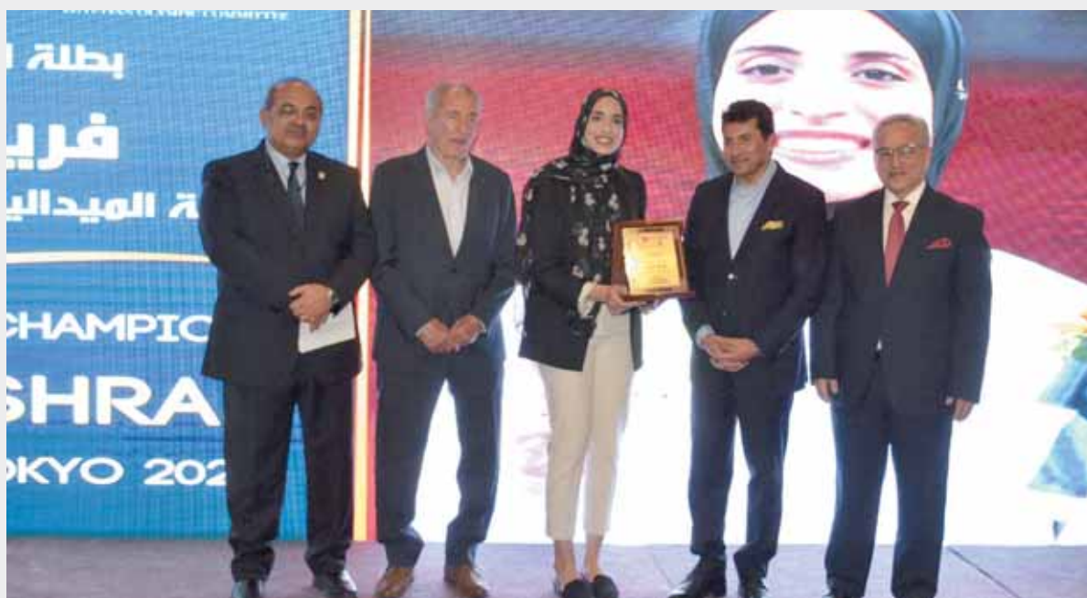
تكريم الأولمبية لفريال أشرف

فى يوم الوفاء لنجوم الرياضة المصرية وعلى رأسهم الأبطال الأولمبيين، أقامت اللجنة الأولمبية برئاسة المهندس هشام حطب، حفلاً لتكريم الاتحادات الرياضية واللاعبين على الإنجازات التى تحققت خلال الفترة الحالية على جميع المستويات وكان لها دور كبير فى تطور وتقدم الرياضة المصرية. وشهد الحفل تكريم البطة الذهبية فريال أشرف صاحبة ذهبية الكاراتيه فى أولمبياد طوكيو، وأحمد الجندي الفائز بالبرونزية فى منافسات التايكوندو، وجيانا فاروق الفائزة بالبرونزية فى الكاراتيه وهدياء ملاك وسيف عيسى أصحاب برونزيتى التايكوندو، ومحمد إبراهيم كيشو الفائز ببرونزية المصارعة. كما شهد الحفل تكريم الأبطال البارالمبيين الفائزين بميداليات فى دورة الألعاب البارالمبية طوكيو، وهم: شريف عثمان ومحمود صبرى ورحاب رضوان وفاطمة عمر ومحمد صبحى وهانى عبدالهادى ومحمد الزيات وشيماء سامى، كما تم تكريم ثنائى رفع الأثقال محمد إيهاب وسارة سمير. وخلال الحفل وقعت اللجنة الأولمبية بروتوكول