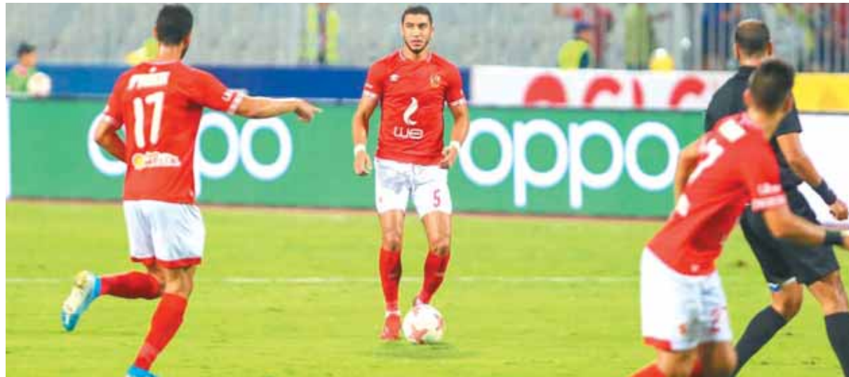
الأهلى تسلم قميصاً خاصاً يحمل اسم الخطيب من مسئولى الرجاء