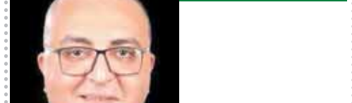
بقلم: عمرو عزت حجاج