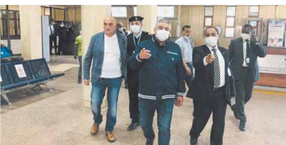
اللجنة العليا للتفتيش الأمني والبيئي خلال تفقدها مطاري أوسمبل وأسوان

التحكم والكاميرات للتأكد من تطبيق كافة الإجراءات الأمنية والتدابير الاحترازية والوقائية الموصى بها من قبل منظمات الصحة والطيران العالمية. وتزامن مع تفقد اللجنة العليا للتفتيش الأمني والبيئي لمطار أوسمبل وصول ثلاث رحلات ثقيل أوجوا سياحية من مطار أسوان إلى مطار أوسمبل، حيث تابعت اللجنة خطوات إنهاء إجراءات الركاب دون حدوث أي تكسر وتطبيق كافة الإجراءات الأمنية والاحترافية.