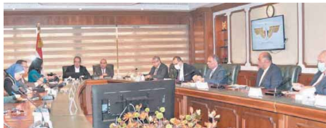
قيادات وزارتي الطيران والسياحة يبحثان سبل تنشيط حركة السياحة