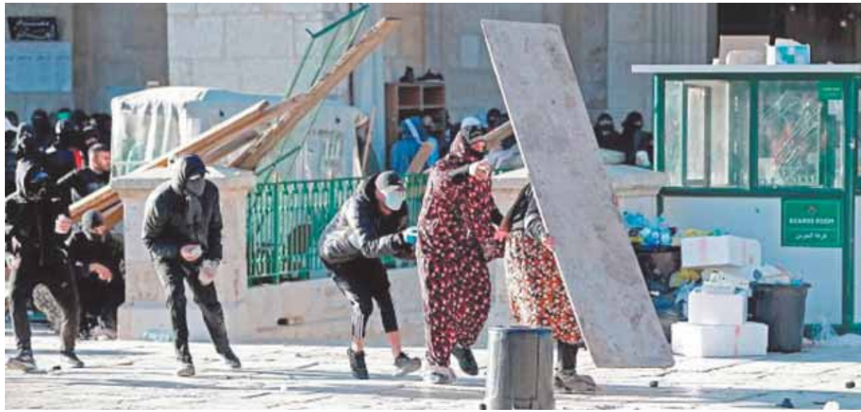
جانب من المواجهات بين الفلسطينيين وقوات الاحتلال

مئات الفلسطينيين يرابطون في باحات الأقصى خوفاً من اقتحامه.. والعالم يدين اعتداءات إسرائيل ويطالبها باحترام المقدسات