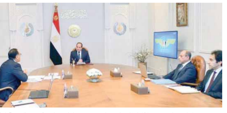
الرئيس السيسي خلال لقائه رئيس الوزراء ووزير الطيران لبحث استراتيجية الطيران المدني