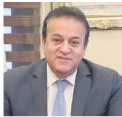
د. خالد عبدالغفار

تجنب مسببات تهيج الأنف مثل شرب السجائر داخل المنزل والمنظفات المنزلية التي تسبب آبخرة، مؤكداً جاهزية مستشفيات وزارة الصحة والسكان لاستقبال أي حالات مرضية. كما دعا «عبدالغفار» مجدداً المواطنين الحصول على لقاح فيروس كورونا والجرعات التنشيطية للحماية والحد من عدوى فيروس كورونا COVID، فضلاً عن ضرورة تلقي لقاح الإنفلونزا في الخريف لتقليل مخاطر الإصابة بالإنفلونزا، بالإضافة إلى أنه يحث على التهايات الجهاد التنفسي البسيطة، مثل نزلات البرد، وأكد أهمية ارتداء الكمامات، للحماية من الإصابة بنزلات البرد وعدوى فيروس كورونا؛ حيث يجب ارتداؤها في الأماكن المزدحمة، مع غسل الأيدي وتلقيحها بشكل متكرر. وأكد «عبدالغفار» ضرورة تحديد وقت الخروج