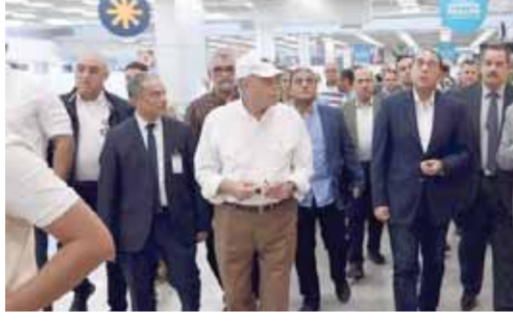
رئيس الوزراء خلال تفقده أعمال التطوير بمطار شرم الشيخ قبل COP27