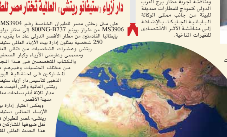
على متن رحلتى مصر للطيران الخاصة رقم MS3904 و MS3906 من طراز بوينج ٧٣٧-٨٠٠NG إلى مطار لوبونيا بإيطاليا القادمين من مطار الأقصر الذي عاد ما يقرب من 250 شخصية يمثلون أبرز الأبناء العالمى ستيفانو ريتشى وعشترت الشخصيات من فنانى العالم ومصممي وعارضى الأزياء وكبار الصحفيين والكتابات المتخصصة في هذا المجال من مختلف الجنسيات وغيرهم من المشاركين في احتفالية البوبيل الذهبى لتأسيس دار أزياء ستيفانو ريتشى العالمية والتي أقيمت على مدار ثلاثة أيام بساحات معابد مدينة الأقصر. ويكمن اختيار إدارة بيت الأزياء العالمى «ستيفانو ريتشى» لمصر للطيران في نقل ضيوها للمشاركين من هذا العالمى المقام المصرية من سعة جيدة.