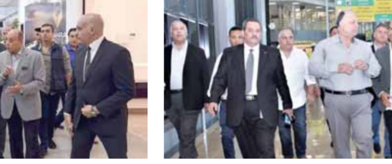
وزير الطيران المدني خلال استماعه لشرح مفصّل من رئيس القابضة للمطارات عن أعمال مطار سفنكس