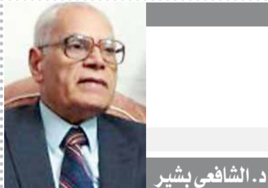
د. الشافعى بشير

كانت حرب أكتوبر ٧٣ التي قادها الرئيس البطل محمد أنور السادات حرب تأديب وتهريب لليكيان الإسرائيلي الغاصب، فلقد تملك الإسرائيليون يومها الحزن والاكئاب عندما وجدوا أن الحرب كبدتهم خسائر باهظة، فعلى وقعها تقهر الإسرائيليون على طول الخطوط أمام القوات المصرية المتقدمة التي خاضت حرباً تحريرية رائعة تحطمت أمامها أوهام إسرائيل. إنها الحرب التي ما زال صداها يتردد في كافة أنحاء العالم لا سيما أن ما يعقب تذكرنا لها اليوم هو أن البطل العظيم السادات كان ضحية جماعة الإخوان الإرهابية التي غدردت به في السادس من أكتوبر ٨١، ففي أثناء الاحتفال بالذكرى الثامنة للحرب التي تحقق من خلالها هزيمة الكيان الصهيوني امتدت اليد الأثمة لجماعة البغي والامم والمدونان، جماعة الإخوان المسلمين لقتال البطل وهو على النعمة وسط وزرائه وقادة جيش مصر العظيم، وهكذا رحل الرئيس محمد أنور السادات بطل الحرب والسلام، ولكن ما زالت كدراء الخالدة تسكن الجميع، لن ينساها أحد وهو القائل: (هذا الوطن يستطيع أن يامن بعد خوف أنه قد أصبح له ورد وسيف، إن القمم تبقى والأخلاق تبقى والأصالة تبقى). رحم الله البطل الذي حقق للمصريين أعظم انتصاراتهم عبر حرب تحريرية رائعة.