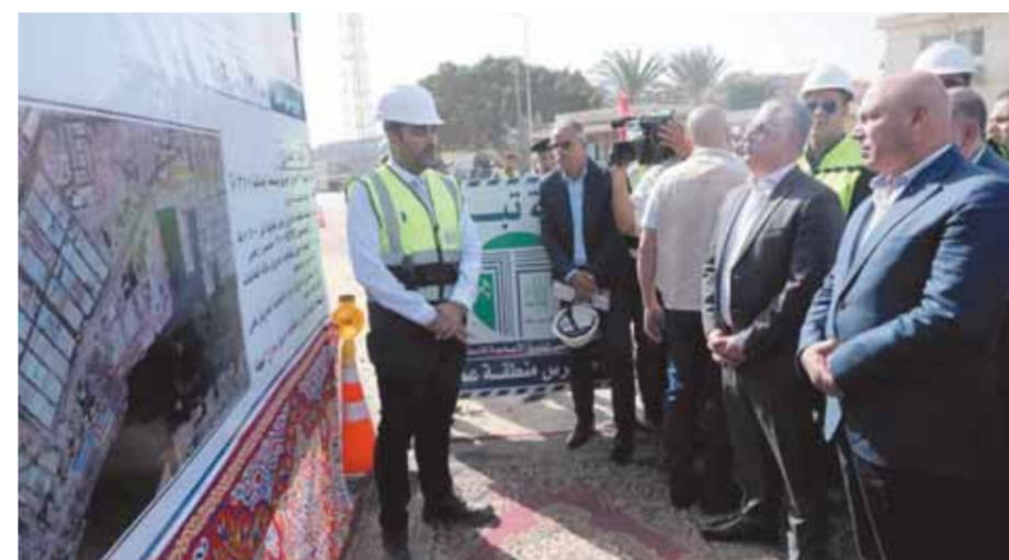
الوزير الدكتور حاتم الجبلي.

أنشطة الشركة وتطوير محطة حاويات غرب بورسعيد (إعادة تأهيل الرصيف الحالي - زيادة المسافة بين الرصيفين - عملة إحلال لأوناش الرصيف الحالية بأوناش جديدة ذات أحمال عالية تتعامل مع سفن الأجيال الحديثة - إعادة تأهيل ساحات الشركة بالكامل وتحديثها - ضرورة استخدام نظام تشغيل محطات حاويات (Terminal Operating System) Sitem. وقال الوزير، وزارة النقل تقوم بإنشاء وتطوير أرصفة جديدة بإجمالي أطوال ٣٥ كيلومتراً بأعماق تتراوح من (١٥ - ١٨ متراً) وأهمها على البحر الأحمر «سفاجا والعين السخنة»، وعلى البحر المتوسط «إسكندرية ودمياط وبورسعيد»، ليصل إجمالي أطوال الأرصفة في الموانئ البحرية المصرية إلى ٧٦ كيلومتراً، وإنشاء حواجز أمواج بإجمالي أطوال ٦ كيلومترات، وتعميق الممرات الملاحية، لتستوعب الموانئ ٤٠٠ مليون طن، بدلاً من ١٨٥ مليون طن سنوياً، وأكثر من ٢٥ مليون حاوية مكافئة، بدلاً من ١٢ مليون حاوية مكافئة سنوياً.