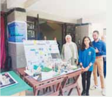
المعزز الذي تدربوا على تقنيات يد على رضا الكرداوي

ناقش المؤتمر عدداً من المحاور كما أعلن الدكتور أبو العلا عطيفي حستين المشرف على المؤتمر منها محور الذكاء الاصطناعي لمواجهة التغيرات المناخية