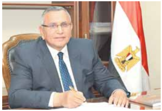
د. عبدالسند يمامة