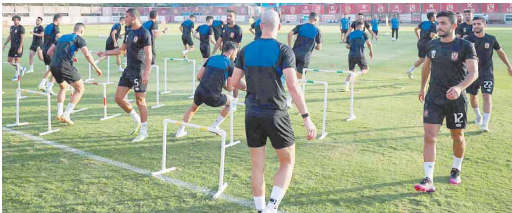
الأهلى يستعد بقوة للموسم الجديد