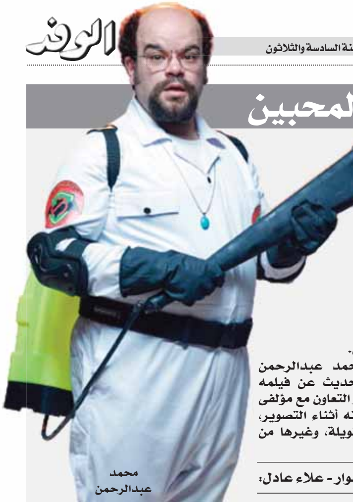
محمد عبد الرحمن

رامز جلال، وغيرها من الأعمال. التقت «الرفد» بالفتان محمد عبد الرحمن للأطمئنان على صحته، والحديث عن فيلمه الأخير «الدعوة عامة»، وتكرار التعاون مع مؤلفه العمل، والصعوبات التي واجهته أثناء التصوير، وابتعاده عن الدراما لفترة طويلة، وغيرها من الأمور خلال السطور التالية..