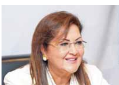
د. هالة السعيد

الاستثمارات العامة في خطة ٢٠٢٢/٢٠٢٣، مع استهداف الوصول إلى ٥٠٪ من المشروعات الخضراء بنهاية ٢٠٢٤-٢٠٢٥. كما تطرقت السعيد إلى إطلاق مصر الاستراتيجية الوطنية المصرية لتغير المناخ، مع تعزيز آليات التمويل المبكرة التي تعطي الأولوية لتدابير التكيف، كاستثمارات الخضراء، بالإضافة إلى تعزيز مشاركة القطاع الخاص في تمويل المناخ وتعزيز الوظائف، وكذلك تقديم مجموعة من الحوافز لدعم الاقتصاد الأخضر.