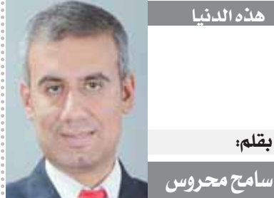
بقلم: سامح محروس

أكد الدكتور أشرف صبحى وزير الشباب والرياضة أن تطوير مراكز الشباب فى جميع المحافظات من أولويات الوزارة وخاصة فى المحافظات الحدودية ومن بينها سيناء، ووجه وزير الشباب والرياضة الدعوة للجمع لزيارة سيناء ومتابعة التطورات والطفرة الرياضية التى تشهدها المحافظة فى المرحلة المقبلة، معربا عن فخره بفوز مركز شباب الشيخ زويد بالمركز الأول فى منافسات دورى الشباب على مستوى المحافظة. وقام الدكتور أشرف صبحى، واللواء دكتور محمد عبد الفضيل شوشة محافظ شمال سيناء، صباح أمس الخميس بوضع حجر الأساس لإحلال وتجديد مركز شباب الشيخ زويد، ضمن جولة وزير الشباب والرياضة بمحافظة شمال سيناء والتي رافقه خلالها عددا من قيادات الوزارة، وكذلك بعض أعضاء مجلسى النواب والشيوخ بالمحافظة.