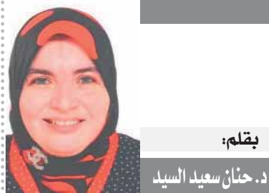
بقلم: د. حنان سعيد السيد

الطقس من اضطراب العقد يمتد إلى إيرلندا الشمالية واسكتلندا حيث تتزايد النزعة القومية، كما يمتد إلى كندا وإستراليا ونيوزيلندا، وفى الداخل تواجه العائلة الحاكمة من أجل الجمهورية، التى تدعو لمناقشة مستقبل النظام الملكى، لقد سقط جسر لندن.. التعبير الكودى لوفاة الملكة اليزابيث.. والمرجح أن تتهاوى بعدة جسورا عديدة من التاج الأعرق فى العالم، وسبحان من له الدوام.