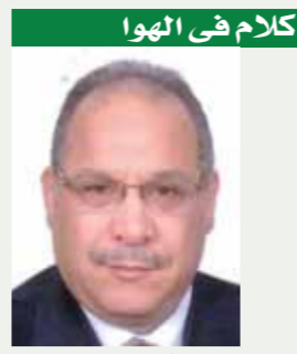
كلام في الهوا