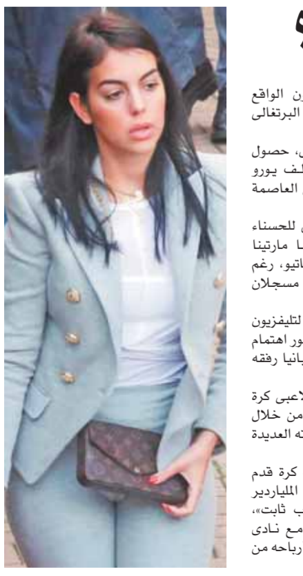
طبع بمطبخ الأخبار

كريستيانو رونالدو اتفق مع جورجينا بالفعل على الزواج، وانهما بصدد توقيع الأوراق الرسمية، خلال الساعات المقبلة، وان موسم الصيف الحالي، سيكون أول شهر عسل رسمي بينهما. وبدأ رونالدو إجراءات زواجه منذ ساعات، وذلك بالتوقيع على اتفاقية قانونية، لمنع أى أزمة بينهما، حال انفصالها بعد الارتباط بعلاقة رسمية. المثير في الأمر، ان أوراق الزواج تتضمن اتفاقية