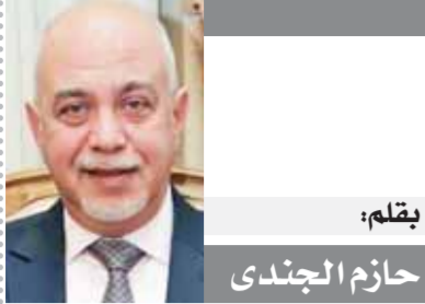
بقلم: حازم الجندى

«حس الهرمونات أخطر طرق زيادة وزن الحيوانات.. وبعض الجزائريين يبيعون اللحوم المجمدة على أنها بلدية»