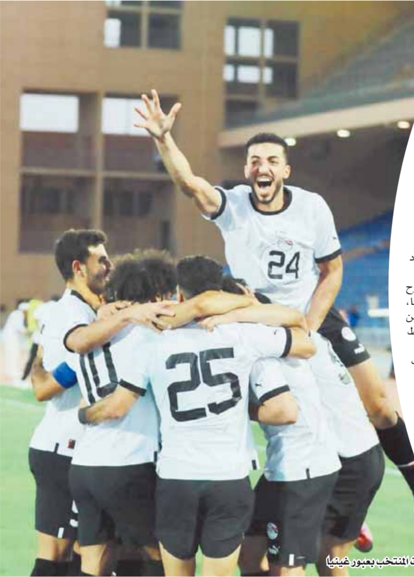
احتفالات المنتخب بعبور غينيا

«فيتوريا» يرفض إغراءات الرحيل.. ويشيد بأداء «صلاح» و«زيزو» في لقاء غينيا