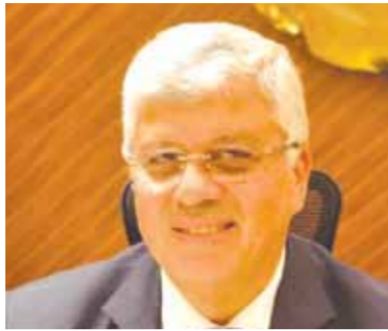
د. أيمن عاشور