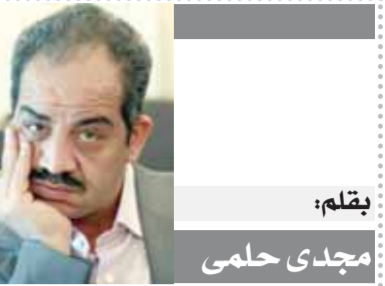
بقلم: مجدى حلمي

أعلنت دولة الإمارات تسير طائرة مساعدات تحمل ٥٠ طناً من المساعدات الغذائية، وسيارات إسعاف مجهزة طبيياً ضمن جسر جوي إغاثي متصل منذ مارس الماضي للمساهمة في تلبية الاحتياجات الإنسانية للاجئين والنازحين الأوكرانيين، وذلك إلى مدينة وارسو ببولندا. بدعم دولة الإمارات جهود التوصل إلى حل سياسي للأزمة، وتحرص على تعزيز الأمن والاستقرار الإقليمي والدولي، إلى جانب تكثيف الجهود المبذولة لدعم الاحتياجات الإنسانية للمدنيين المتضررين في أوكرانيا. وقامت دولة الإمارات خلال شهر مارس الماضي بتسيير جسر جوي من المساعدات الإنسانية يحمل إطناناً من المواد الطبية والغذائية الأساسية تم تسليمها إلى السلطات الأوكرانية في بولندا لمساعدة اللاجئين الأوكرانيين، وتستمر دولة الإمارات في تقديم الدعم الإغاثي انطلاقاً من النهج والتضامن الإنساني لدعم جهود الإغاثة الإنسانية الدولية ومساعدة كل الشعوب على تخطي أزماتها الإنسانية، والتخفيف من حدة المعاناة خاصة للنساء والأطفال.