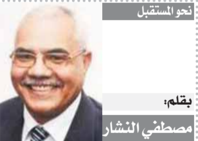
بقلم: مصطفى النشار