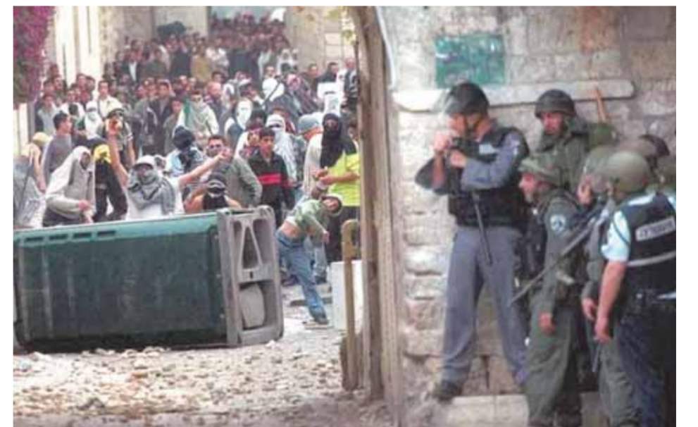
اعتداءات واعتقالات في صفوف المصلين