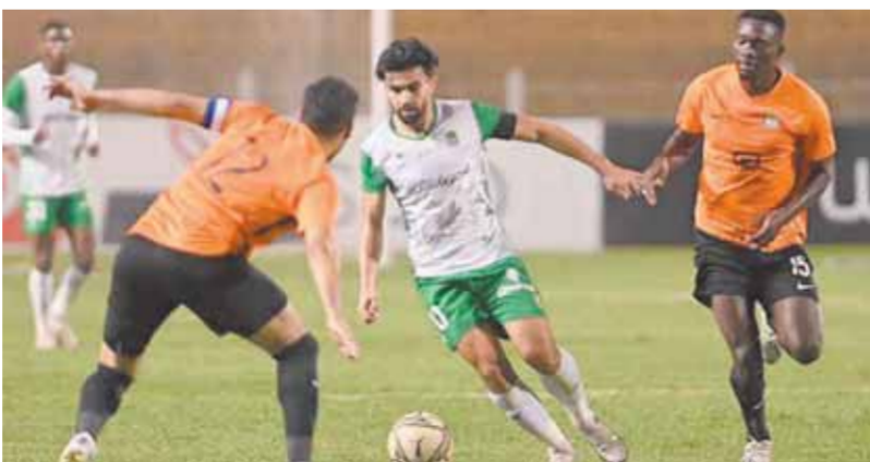
الاتحاد السكندري قدم أداءً قويا أمام البنك