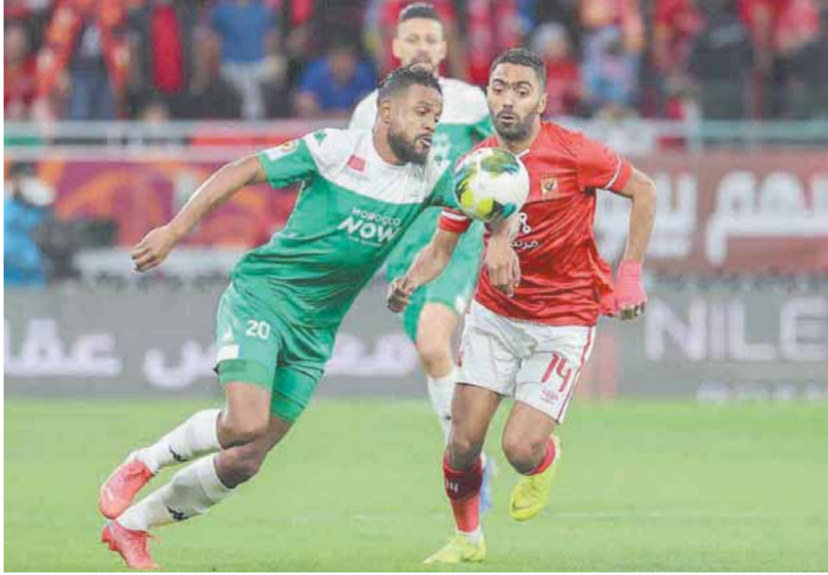
الأهلي والرجاء لقاءات تتسم بالندية

الأهلي يسعى لتحسين نتائجه بعد الخسارة المحلية الأخيرة أمام المصري وهو ما جعل محمود الخطيب رئيس النادي يعقد اجتماعات مستمرة مع بيتسو موسيماني المدير الفني وتحفيزه ودعمه