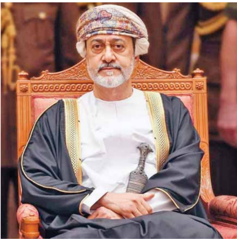
السلطان هيثم بن طارق سلطان عمان

وأضافت «الغيثية» أن «بوابة استثمار بسهولة» حققت خلال العام الماضي نسبة في عدد المعاملات المنجزة بنسبة أكثر من ٥٪، كما ارتفعت نسبة رضا المستثمرين فيما يخص سرعة إنجاز المعاملات بنسبة ٧٢٪، وزادت نسبة الرضا عن سهولة دفع الرسوم بنسبة ٨٦٪، وبلغت نسبة الرضا العام عن