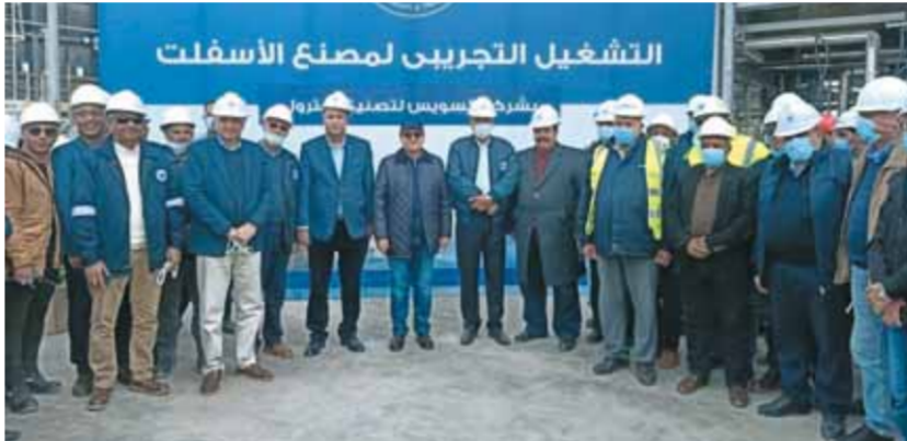
وزير البترول خلال زيارة المشروعات الجديدة بالسويس

وخلال الجولة أكد الملا على أهمية هذه المشروعات الحيوية التي تعمل على تطوير الوحدات الإنتاجية، باعتبارها من الدعامات الرئيسية لتحقيق المشروع القومي لجعل مصر مركزاً إقليمياً لتجارة وتداول البترول والغاز الطبيعي، فضلاً عن مساهمتها الفعالة في استدامة تأمين احتياجات السوق المحلي من المنتجات البترولية عالية الجودة، ووجه الملا بأهمية الالتزام بالبرامج الزمنية المحددة لتنفيذ تلك المشروعات، مع مراعاة تطبيق معايير الجودة باستخدام أحدث التكنولوجيات والتي تقوم بتوفيرها شركات قطاع البترول، كما وجه بأهمية الالتزام بإجراءات السلامة والصحة المهنية، لافتاً إلى أن شركات قطاع البترول تقوم بتطبيق