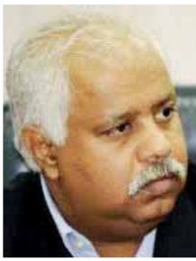
بقلم: حمدى رزق

ومن جانبى، أرحس فضيلة الإمام الأكبر الدكتور الطيب، أحمد الطيب، شيخ الأزهر، ليكون على رأس لجنة من الثقافة يحكمون فيما شجر بين الملك والمستأجرين، بالقسطناس والعدل، وبما يرضاه ربنا شرعاً ويزيئه الطرفان قانوناً. وأعتقد أن فضيلته يحكم موقفه الروحى والأدى قادر على الجمع بين الطرفين على كلمة سواء، بما لا يظلم أحد، وينضج مقترح تتولى الحكومة تقديمه فى مشروع قانون إلى مجلسي (النواب والشيوخ) بعيداً عن الضغوط المجتمعية، بما يحقق بعض المطالب على الجانبين، وفق قاعدة: «ما لا يُدرك كله فلا يترك جله» ليأخذ المشروع المرتجى طريقه إلى التنفيذ الأمين دونما احتراب لا تحتمل نتائجه المجتمعية. وأخيراً، ومن المأثورات اللازمة فى هذا السياق «ليس من العمل أن تطلب من الآخرين ما لست أنت مستعداً لفعله».