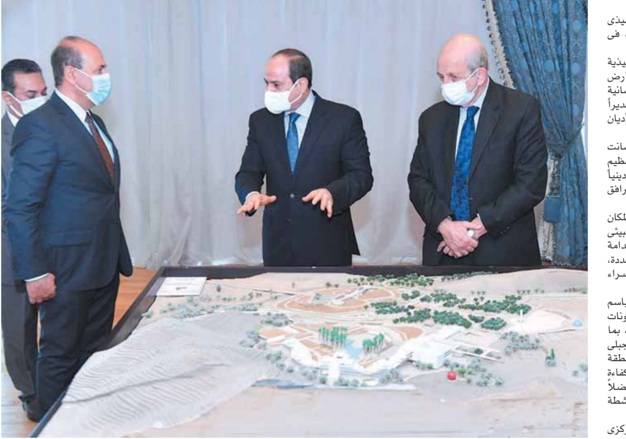
الرئيس في حوار مع اللواء محمود نصار حول مشروع التجلى الأعظم