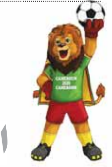
كتب - محمد سعيد:

وضع جمال علام، رئيس اتحاد الكرة، نقطة نظام داخل معسكر المنتخب الوطني الأول في الكاميرون، حيث يشارك الفراعنة في نهائيات كأس الأمم الإفريقية التي تستضيفها بلاد الأسود غير المروضة حالياً حتى ٦ فبراير المقبل. وشهدت الساعات الماضية حالة من التوتر بين علام المكلف برئاسة بعثة الفراعنة في الكاميرون ووائل جمعة مدير المنتخب، في ظل سماح الأخير للبرفغالي كارلوس كيروش، المدير الفني للفراعنة بالظهور الإعلامي على إحدى القنوات عقب مباراة نيجيريا التي انتهت بخسارة قاسية لمنتخبنا في مستهل مشواره بأهم أفريقيا، قبل أن يتدخل علام ويمنع إخلاء أي تصريحات لأي وسائل إعلام دون الحصول على إذن خاص منه.