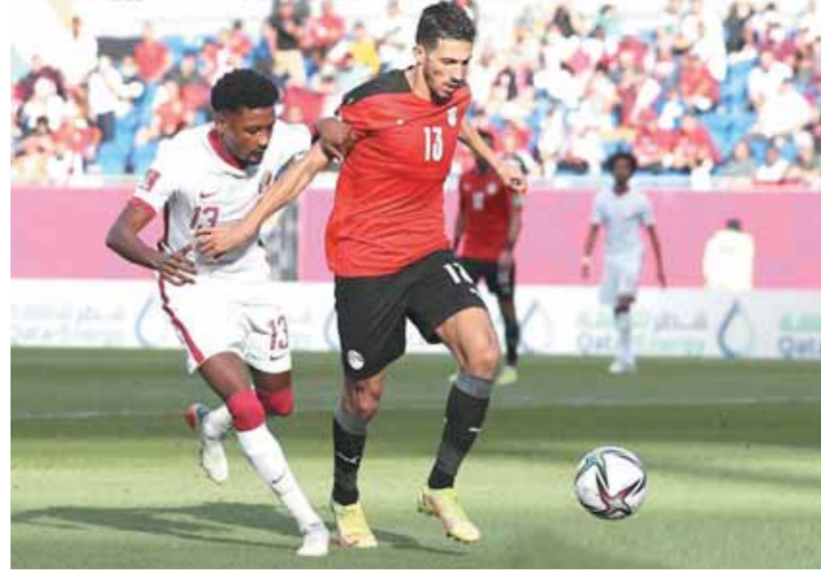
الجهاز الطبي يسعى لتجهيز فتوح

وعلمت «الوفد» أن العلاقة باتت فاترة بين وائل جمعة وجمال علام، في ظل غضب الأخير من تصرف قائد المنتخب السابق، ومنعه من التصرف في أي شيء يخص الظهور الإعلامي للفريق أو المدرب دون الرجوع إليه بشكل رسمي، من أجل الحفاظ على هدوء واستقرار الفريق خصوصاً في ظل الوضع المتأزم حالياً. في سياق متصل، وصلت صباح اليوم الأحد، بعثة الفراعنة إلى مدينة ياوندى عاصمة الكاميرون من أجل الاستعداد لخوض مباراة المنتخب أمام نظيره السوداني، المقررة يوم