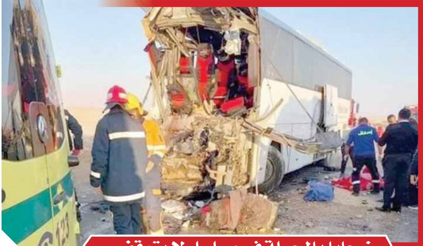
ضحايا بالجمللة في مسلسل لا يتوقف

على مدى ما يزيد على قرن من الزمان، وحوادث الطرق قضية مطروحة للنقاش في البرلمان، والجهات البحثية، ومؤسسات الحكومة، ووسائل الإعلام.. وغالباً ما ينتهي كل نقاش من تلك النقاشات بتوصيات ومقترحات لمواجهة مسلسل الدم المراق على أسفلت شوارع مصر.. ووُضعت قوانين وتشريعات، وصدرت قرارات ومراسيم للتصدي لحوادث الطرق.. ثم بعد ذلك كله ما زالت الدماء تجري على الأسفلت، حتى إن العام الماضي وحده شهد قتل أكثر من ٧ آلاف مصري تحت عجلات وسائل المواصلات، وفي الأيام القليلة الماضية شهدت البلاد حادثين مروريين بشعيرين في أقل من عشرة أيام راح ضحيتيهما العشرات من الأبرياء، حيث لقي ١١ شخصاً مصرعهم وأصيب ٣٠ آخرون، في حادث تصادم حافلة نقل عام بسيارة نقل «مقطورة»، بطريق الزعفرانة البحر الأحمر.