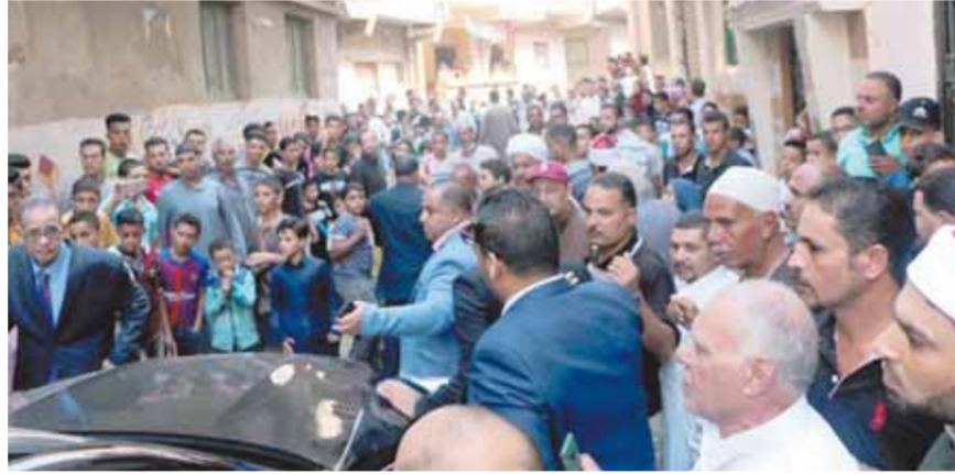
أهالي ميت فارس يستقبلون رئيس الوفد

كتب - محمود عبدالنعم ومحمد عيد: شارك الدكتور عبدالسند يمامة، رئيس حزب الوفد، أمس في افتتاح نصب التذكاري لشهداء معركة الجوية، بمحافظة الدقهلية، في افتتاح مسجد أقيم بالجهود الذاتية وتحت رعاية النائب طارق عبدالعزيز عضو مجلس الشيوخ. استقبل الدكتور أيمن مختار، محافظ الدقهلية، الدكتور عبدالسند يمامة، رئيس حزب الوفد، في ديوان عام المحافظة، بحضور الدكتور شوقي علام، مفتى الجمهورية، ووفد من وزارة الأوقاف ووكيل الوزارة بالمحافظة. حضر اللقاء النائب الوفدي، طارق عبدالعزيز، نائب رئيس الهيئة البرلمانية لحزب الوفد في مجلس الشيوخ، ومحمد حلمي سويلم، رئيس اللجنة العامة لهالوفد» بالدقهلية، وياهو السعمان، الرئيس الشرفي للجنة العامة لحزب الوفد بالدقهلية، ومحمد الاتريبي، سكرتير عام مساعد اللجنة العامة، وعدد من أعضاء مجلس النواب والشيوخ بالمحافظة. قدم الدكتور عبدالسند يمامة، رئيس حزب الوفد، التهنئة للقوات المسلحة المصرية ولشهداء معركة الجوية، بمناسبة عيد القوات الجوية الـ٩٠ الموافق يوم ١٤ أكتوبر. وشارك رئيس الوفد، في افتتاح النصب التذكاري لشهداء محافظة الدقهلية، والنصب التذكاري لمعركة المنصورة الجوية «ميدان النصور» التي توافقت يوم ١٤ أكتوبر ١٩٧٢، وهي أطول معركة جوية في التاريخ العسكري الحديث. كما شارك رئيس حزب الوفد، مفتى الجمهورية، في افتتاح مسجد التوحيد بقرية ميت فارس التابعة لمركز بني عبيد بالدقهلية، وأقيم المسجد بجهود النائب طارق عبدالعزيز، نائب رئيس الهيئة البرلمانية لهالوفد» في مجلس الشيوخ، وبمشاركة أهالي القرية. حيث استقبل أهالي قرية ميت فارس، الدكتور عبدالسند يمامة، رئيس حزب الوفد، استقبالا حافلا، وتجمع المئات لتحيته خلال افتتاح المسجد.