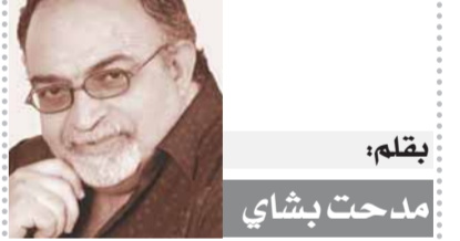
بقله: هتم بشاي