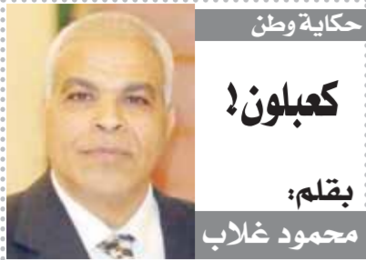
حكاية وطن كعبلون! بقلم: محمود غلاب

كتب - محمود عبدالنعم ومحمد عيد: شارك الدكتور عبدالسند يمامة، رئيس حزب الوفد، أمس في افتتاح نصب التذكاري لشهداء معركة الجوية، بمحافظة الدقهلية، في افتتاح مسجد أقيم بالجهود الذاتية وتحت رعاية النائب طارق عبدالعزيز عضو مجلس الشيوخ. استقبل الدكتور أيمن مختار، محافظ الدقهلية، الدكتور عبدالسند يمامة، رئيس حزب الوفد، في ديوان عام المحافظة، بحضور الدكتور شوقي علام، مفتى الجمهورية، ووفد من وزارة الأوقاف ووكيل الوزارة بالمحافظة. حضر اللقاء النائب الوفدي، طارق عبدالعزيز، نائب رئيس الهيئة البرلمانية لحزب الوفد في مجلس الشيوخ، ومحمد حلمي سويلم، رئيس اللجنة العامة لهالوفد» بالدقهلية، وياهو السعمان، الرئيس الشرفي للجنة العامة لحزب الوفد بالدقهلية، ومحمد الاتريبي، سكرتير عام مساعد اللجنة العامة، وعدد من أعضاء مجلس النواب والشيوخ بالمحافظة. قدم الدكتور عبدالسند يمامة، رئيس حزب الوفد، التهنئة للقوات المسلحة المصرية ولشهداء معركة الجوية، بمناسبة عيد القوات الجوية الـ٩٠ الموافق يوم ١٤ أكتوبر. وشارك رئيس الوفد، في افتتاح النصب التذكاري لشهداء محافظة الدقهلية، والنصب التذكاري لمعركة المنصورة الجوية «ميدان النصور» التي توافقت يوم ١٤ أكتوبر ١٩٧٢، وهي أطول معركة جوية في التاريخ العسكري الحديث. كما شارك رئيس حزب الوفد، مفتى الجمهورية، في افتتاح مسجد التوحيد بقرية ميت فارس التابعة لمركز بني عبيد بالدقهلية، وأقيم المسجد بجهود النائب طارق عبدالعزيز، نائب رئيس الهيئة البرلمانية لهالوفد» في مجلس الشيوخ، وبمشاركة أهالي القرية. حيث استقبل أهالي قرية ميت فارس، الدكتور عبدالسند يمامة، رئيس حزب الوفد، استقبالا حافلا، وتجمع المئات لتحيته خلال افتتاح المسجد.