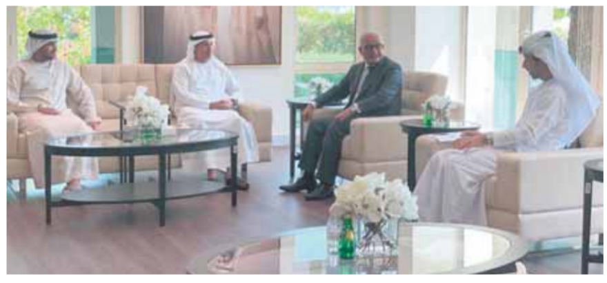
بدء التشغيل.. العام الدراسي المقبل انتهاء الأعمال الإنشائية لـ«بيت مصر» في باريس

كتب - صلاح شرابي: التقى الدكتور رضا حجازي، وزير التربية والتعليم والتعليم الفني، الدكتور أحمد بالهول الفلاس، وزير التربية والتعليم بدولة الإمارات العربية المتحدة، لمناقشة ملفات التعاون بين البلدين، وذلك خلال مشاركته في مؤتمر ركائز بدورته الثالثة تحت شعار «التعليم المستدام هو المستقبل»، والذي ينظمه مجلس الشارقة للتعليم، وتطرق الاجتماع إلى مناقشة ملفات التعاون المشترك بين الدولتين في مجال التعليم، وتبادل الرؤى والخبرات خاصة في المناهج الجديدة التي أعدها مركز تطوير المناهج والمواد التعليمية، ودمج التكنولوجيا بالعملية التعليمية. ويهدف المؤتمر إلى كشف الدور الذي تلعبه الأبحاث في تشكيل مستقبل التعليم وتحفيز العقول لرسم وظائف الغد، استجابة للتغيرات العالمية