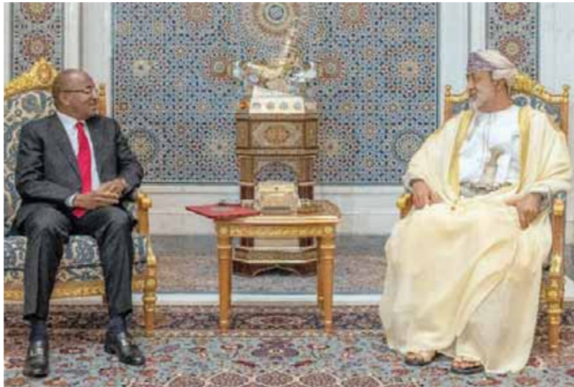
الملك قابوس بن سعيد آل سعيد مع ضيفه في جلسة استماع رسمية في قصر الحمراء، مسقط، عُمان