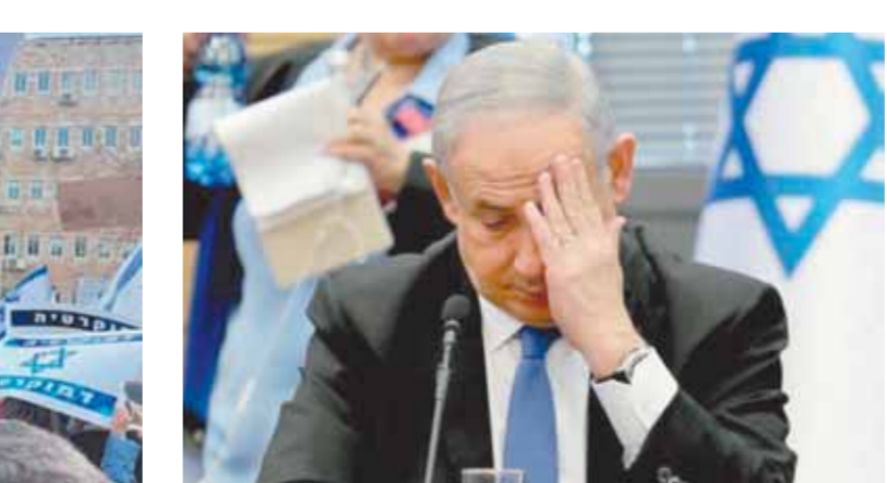
خيبة أمل تسير على نتنياهو

أغلقوا الشارع المؤدى إلى وزارات المالية والداخلية والاقتصاد فى القدس المحتلة، احتجاجاً على مواصلة دفع تشريعات خطة إضعاف جهاز القضاء.. كما يستعد آلاف الإسرائيليين المقيمين فى برلين لمحاولة «تشويش» على الزيارة الرسمية التى يجريها «نتنياهو» للعاصمة الألمانية.