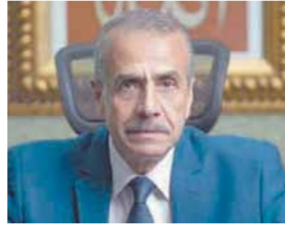
اللواء خيرت بركات

مليار دولار لنفس الشهر من العام السابق، ويرجع ذلك إلى انخفاض قيمة واردات بعض السلع وأهمها منتجات البترول بنسبة ٧.٢٪، والأدوية والمحضرات الصيدلانية بنسبة ١٦.٢٪، والذوايب بأشكالها الأولية بنسبة ٤٨.٨٪، والقمح بنسبة ٢٨.٤٪.