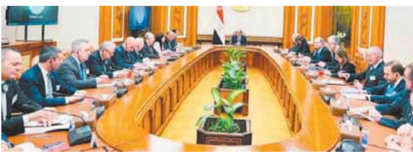
حيث أكد الرئيس فى هذا الإطار ترحيب مصر بالسنثوليين والشركات الإطالية التى تمتلك رصيداً كبيراً من العمل الثمر فى مصر، منها ما يوجد آفاق واسعة للتعاون الاقتصادى على جميع الأصعدة، وهو دفعها للأمام، بما يحقق مصالح الشعبين الصديقين، وكبرى الشركات الإطالية تاتى فى إطار علاقات الصداقة الراضخة بين مصر وإيطاليا، والإرادة السياسية القوية لدى الجانبين لتطوير هذه العلاقات ودفعها للأمام، بما يحقق مصالح الشعبين الصديقين،

ما ثمنه الجانب الإطالي، مشيراً إلى أن هذه الزيارة تأتى لتفعيل الشراكة الاستراتيجية بين البلدين، ووضع حجر أساس لمزيد من التعاون الاقتصادى، من خلال تعزيز وجود الشركات الإطالية فى مصر لاسيما فى مجالات الزراعة والغذاء فى ضوء الأهمية الحيوية للعمل على تحقيق الأمن الغذائى خلال المرحلة الراهنة، التى يعانى فيها العالم أزمات متتالية فى هذا الصدد، وذكر المتحدث الرسمى أن اللقاء شهد أيضاً التباحث حول عدد من موضوعات التعاون الثنائى بين البلدين، وكذا تبادل الرؤى بشأن الملفات الإقليمية والدولية ذات الاهتمام المشترك، كما تم التطرق إلى قضية الهجرة غير الشرعية، وبحث جهود التعاون فى مجال الطاقة، حيث اتفق الجانبان على مواصلة العمل فى هذه المجالات خلال المرحلة المقبلة لتنظيم الاستفادة من الإمكانيات الكبيرة لدى البلدين، ومواصلة التنسيق لمواجهة التحديات الدولية المتنامية سياسياً واقتصادياً.