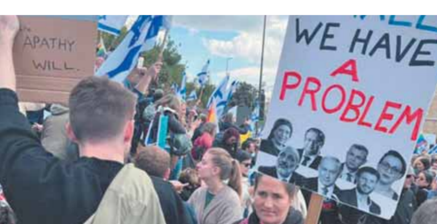
عشرات الآلاف من الإسرائيليين فى الشوارع ضد مشروع إصلاح القضاء

التقدم فى التشريع فى مجال القضاء، مضيئاً أن المعنى الفعلى لذلك هو ارتفاع قروض الإسكان، وغلاء المعيشة والتآكل فى الأمن والمساس بالعلاقات مع الولايات المتحدة، وأضاف فى حديثه للإذاعة الإسرائيلىة أن الائتلاف الحكومى يكذب حينما يقول إنه يعمل على تليين خطة التغييرات القضائية.