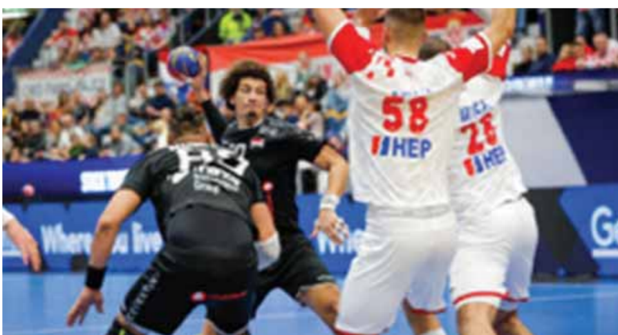
على زين تائق أمام كرواتيا

ويامل الريال معادلة غريمه برشلونة في عدد القاب التتويج بكأس السوبر الإسباني، حيث يتربع فريق القاب على صدارة أكثر الأندية تتويجا بلقب المسابقة برصيد ١٣ مرة، فيما حقق الملكي اللقب ١٢ مرة، وإذا قلب الأخير على البارسا في مباراة الليلة سيصبح في رصيد كلا العملاقين ١٣ لقباً بالتساوي.