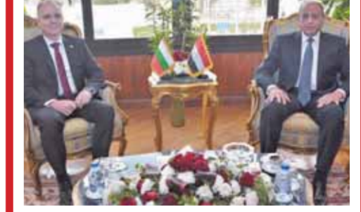
الفريق محمد عباس خلال لقائه سفير بلغاريا بالقاهرة

بحث الفريق محمد عباس حلمي وزير الطيران المدني مع السفير ديان كاتراشيف سفير دولة بلغاريا بالقاهرة سبل تعزيز التعاون بين البلدين في مجال النقل الجوي ودعم الحركة السياحية الوافدة لمصر من بلغاريا بحضور ليفيف من قيادات الطيران. وجاء ذلك خلال لقاء جمعهم بمقر وزارة الطيران، حيث رحب وزير الطيران المدني بالسفير البلغاري والفريق محمد عباس وزير الطيران الوطنية التي تربط بين مصر وبلغاريا والتي تشهد تطوراً وتعاوناً في كافة المجالات وخاصة مجال الطيران المدني.. ويعمل الجانبان المصري والبلغاري على دعمها باستمرار من خلال زيادة مجالات التعاون والاستثمار.