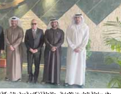
وفد سلطة الطيران الإماراتي وقلمة تذكارية بمقر الشركة الوطنية لخدمات الملاحه الجوية