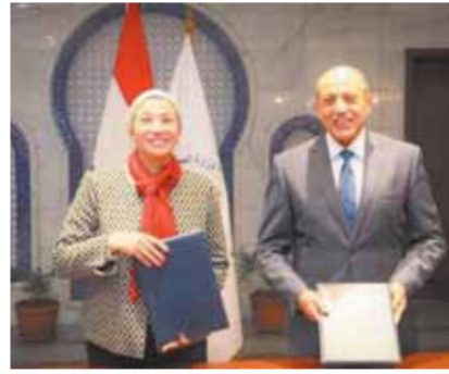
وزيرا الطيران والبيئة والبيئية خلال مباحثات حول بروتوكول تعاون لحد من التلوث البيئي