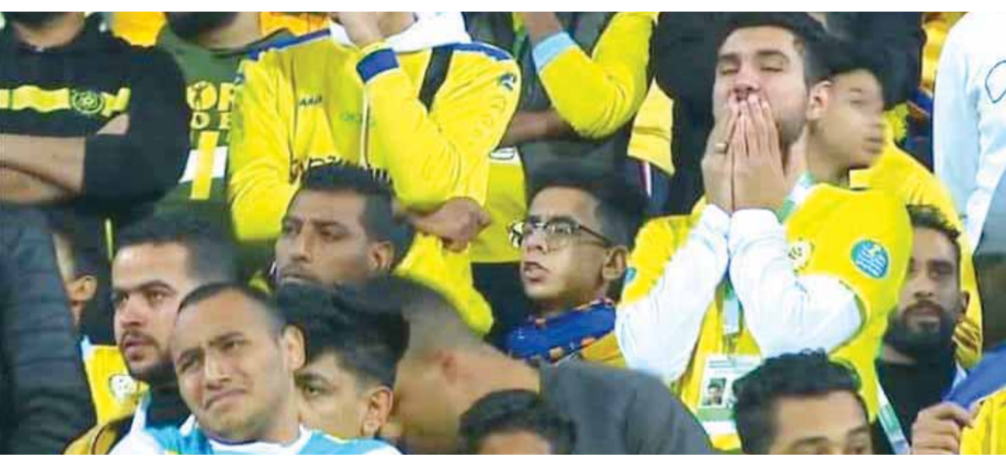
الحزن يسيطر على جماهير الإسماعيلي

غيره فيما يتعلق بلاعبيه الموجودين على قائمة الراحلين خلال فترة الانتقالات الشتوية، تقديراً واحتراماً للعلاقات الطيبة بين القلعة البيضاء والصفراء. واعترف ميود أن الفريق بحاجة إلى ٥ وجوه جديدة، بينهم حارس مرمرى في الميركاتو الشتوي الحالي لو توافر ثلاثة منهم عن طريق الزمالك يكون المراد قد تحقق لدعم صفوف الدراويش.