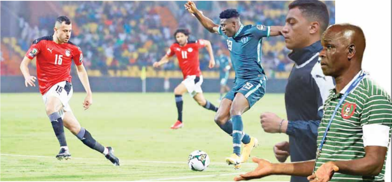
كتب- محمد سعيد

خوض المنتخب الوطني لكرة القدم في التاسعة مساء اليوم مباراة تحديد المصير وتصحيح المسار أمام غينيا بيساو في الجولة الثانية بكأس الأمم الإفريقية بالكاميرون، ويتحدد بشكل كبير موقف الفرقة من الاستمرار في البطولة أو الاستعداد للرحيل مبكراً خاصة بعد البداية الهزيلة والمخيبة للأمل في بداية المشوار بالمجموعة الرابعة والخسارة أمام نيجيريا بهدف نظيف أدى إلى تذييل منتخبنا المجموعة بعد فوز نيجيريا والسودان وغينيا بيساو. ووجه د. أشرف صبحي وزير الشباب والرياضة، انتقاداً للأداء المحترفين الستة الذين شاركوا في مباراة نيجيريا ولم يقدموا المنظر منهم، وطلبهم بتصحيح الصورة وتحسين الفوز الذي يعزز فرصة المنتخب في مواصلة المشوار نحو المنافسة على اللقب، ويأتي لقاء اليوم في ظل ظروف صعبة تواجه البرتغالي كارلوس كيروش الذي أصبح في مرمرى نيران الجماهير المصرية بعد السقوط أمام نسور نيجيريا في الجولة الأولى، بعد أن ارتكب أخطأه فنية جسيمة في التشكيل والكتيكة، وطلب الجماهير بإقالته وإسناد المهمة لمدير فني مصري، وضعت المعبد حسام حسن على رأس قائمة المرشحين، وفتحت هذه المطالبة أزمة جديدة تتعلق بالشروط الجزائي الكبير لكيروش، في حالة إقالته.