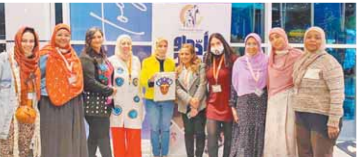
كتبت. إيمان الجندي:

تفتحت الدكتوراة مايا مرسى رئيس المجلس القومي للمرأة «العرض الحي» Live Show لسيدات مصريات على حرفتي خز النول والرسم على القماش، الذي يشارك به مركز تنمية مهارات المرأة على هامش فعاليات النسخة الرابعة من منتدى شباب العالم بشرم الشيخ في الفترة من ١-١٣ من الشهر الجاري.