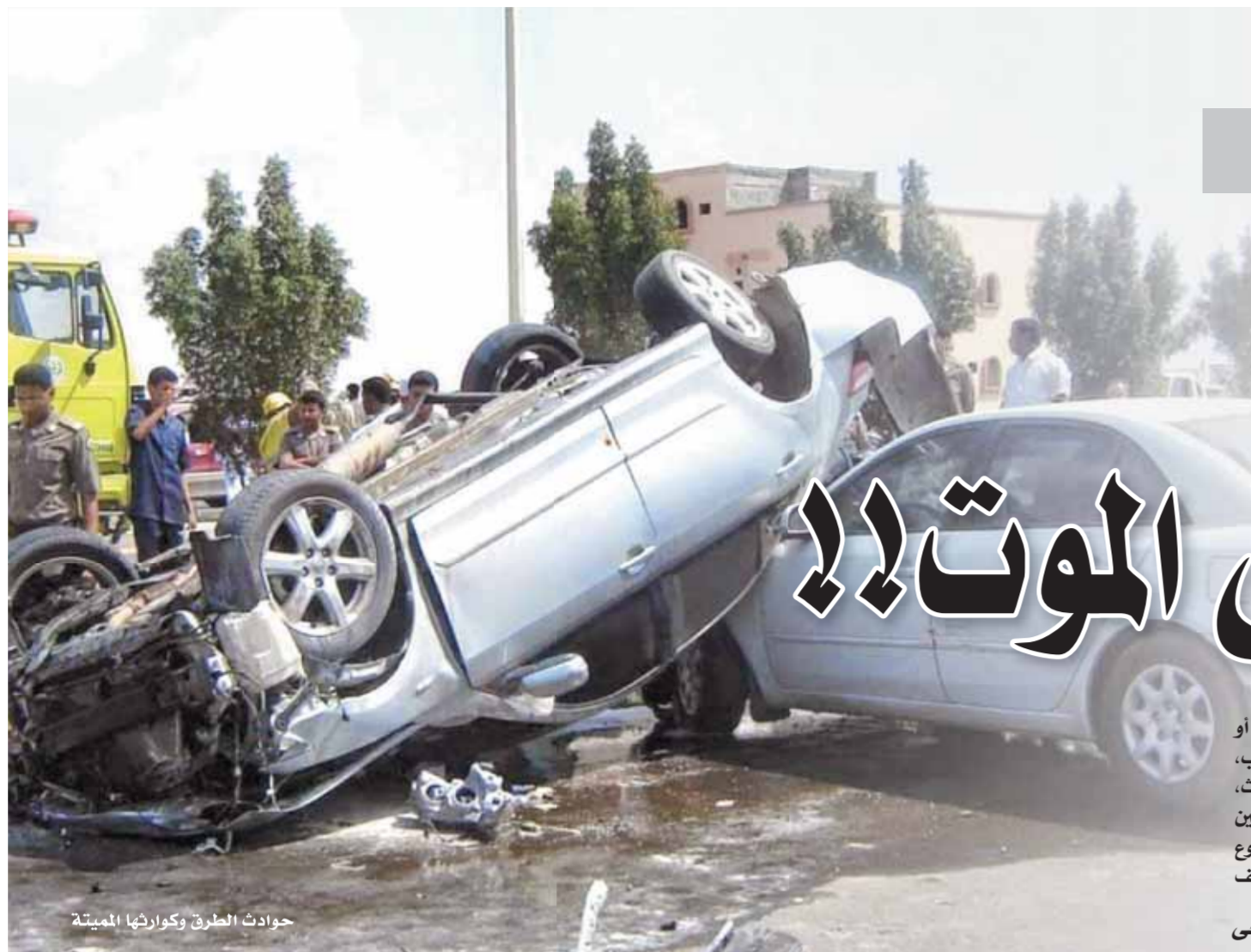
حوادث الطرق وكوارثها المميتة