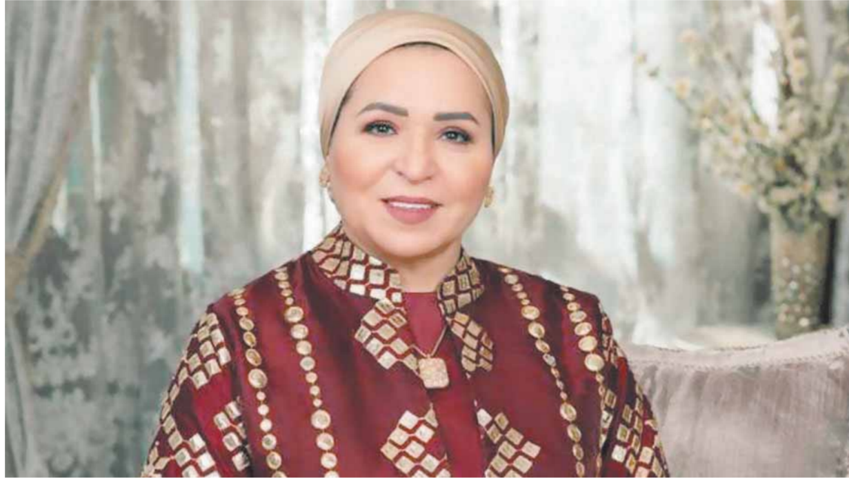
كتب - ناصر عبد المجيد:

أعربت السيدة انتصار السيسي، قرينة رئيس الجمهورية، عن فخرها واعتزازها بعد متابعة فعاليات النسخة الرابعة من منتدى شباب العالم.