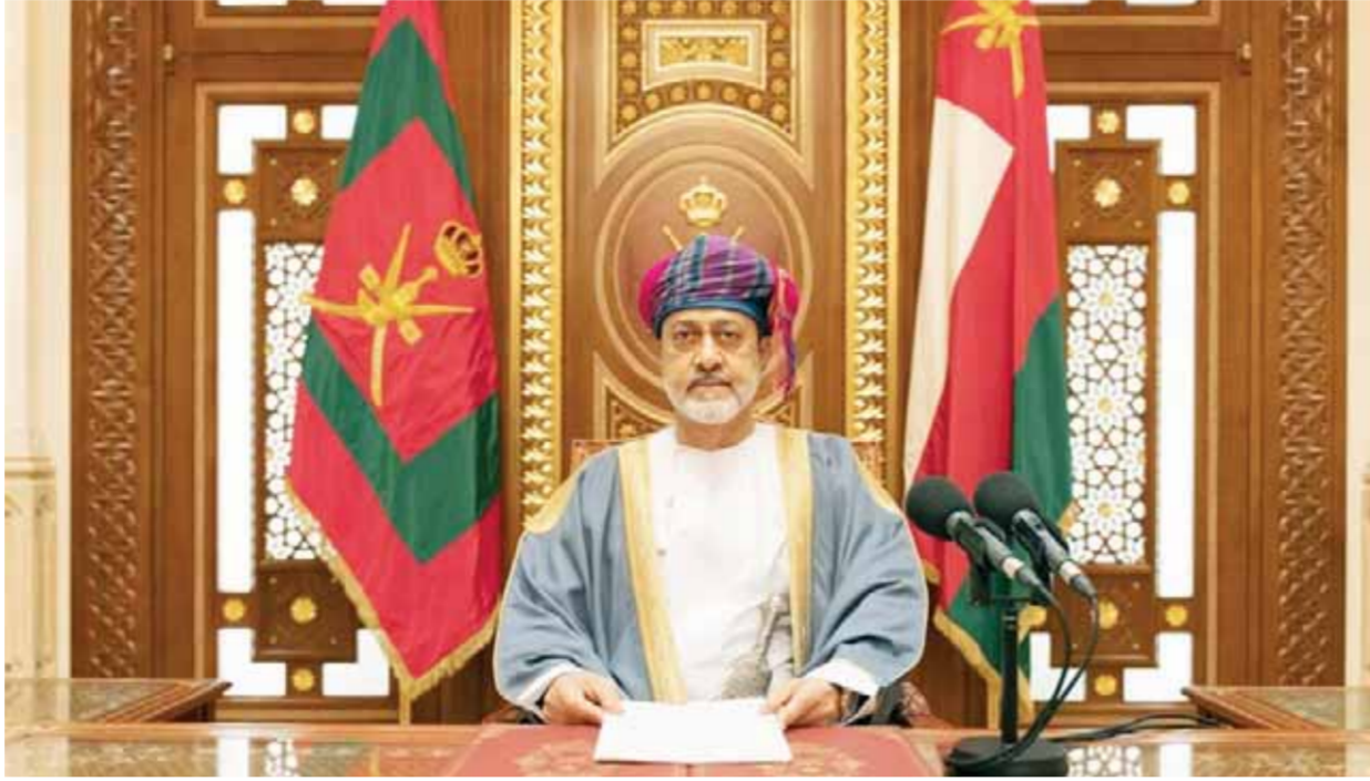
السلطان هيثم بن طارق سلطان عمان خلال خطاب الذكرى الثانية لتوليته الحكم

وحرص سلطان عمان على إختتام خطاب الذكرى الثانية لتوليته الحكم، بعد أن كانت الجهود الوطنية المخلصة على الدوام محل إعزاز وإعتراف لدينا، ونود في هذا المقام أن نسجل كلمة تشاء وإعزاز لكل أجهزتنا العسكرية والأمنية على أدوارها الوطنية المشرفة في حماية الوطن والذود عن مصالحه وسيادته في كل زمان ومكان، مكرسة نفسها فداء لكل شبر من هذا الوطن العظيم، ومنا كل التقدير والثناء لكل من أسهم وبسهم في بناء هذا الوطن العزيز ورفعة شأنه بإخلاص وتضآن،