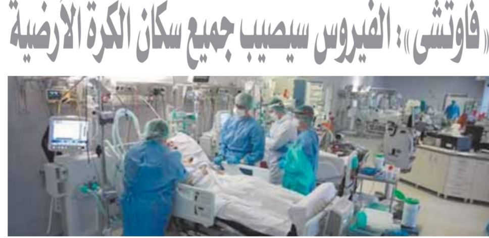
«أوميكرون» يهدد العالم وعصبة واحدة تصيب ١٠٠ شخص