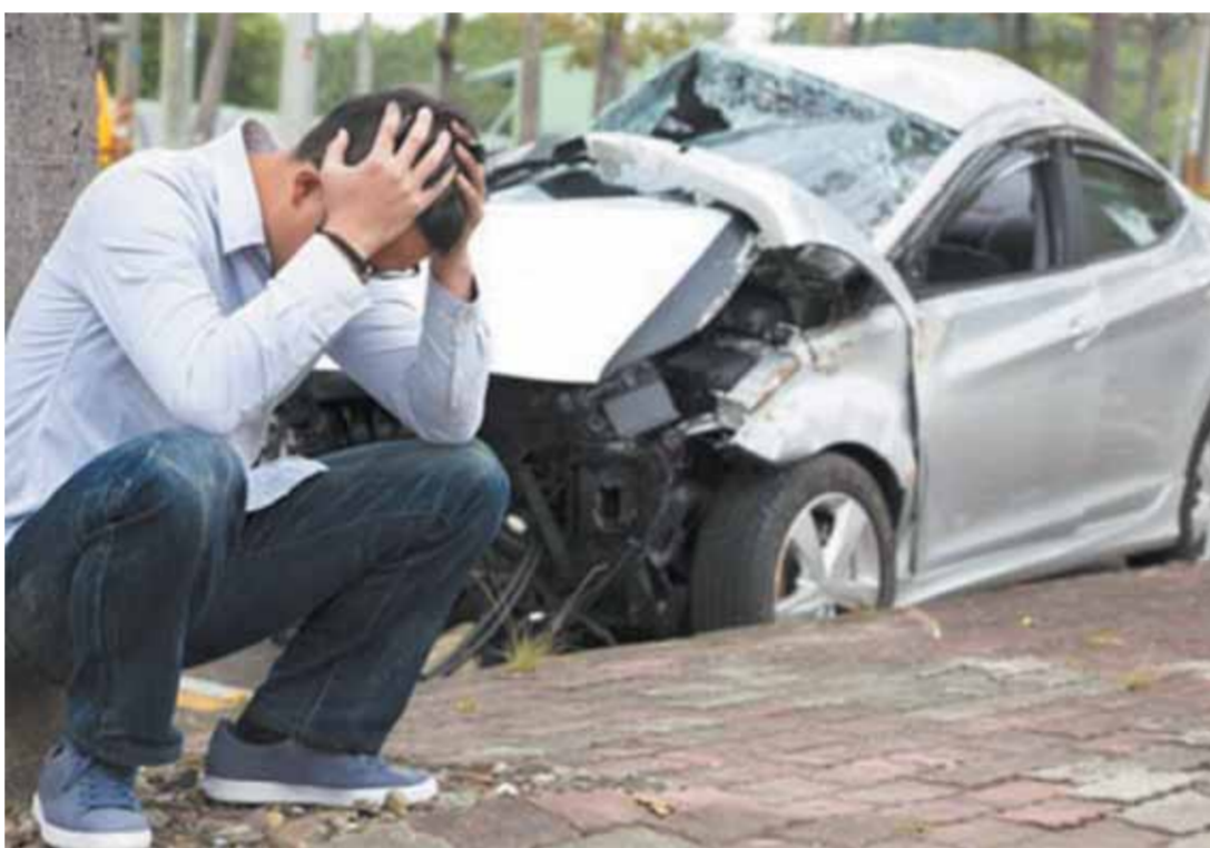
نزيف الطرق يقضى على حياة الأبرياء

كما حدد القانون عقوبات على مرتكبى هذه المخالفات وذلك بسحب ٣ نقاط من السائق من أصل ٥٠ نقطة يحص عليها مع بداية تطبيق القانون، إضافة إلى غرامة مالية تتراوح بين ٥٠٠ و ١٠٠٠ جنيهها، أو الحبس مدة لا تزيد على شهر أو تطبيق هاتين العقوبتين، ويجوز التصالح مع هذه المخالفات خلال ٣٠ يوما، ويكون التصالح مع النيابة ودفع الحد الأدنى من الغرامة أى دفع ٥٠٠ جنيه، وإذا لم يتصالح المخالف خلال ٧ أيام مع المرور أو خلال ٣٠ يوما مع النيابة يحق للنيابة حينها تطبيق سلبتها التقديرية فى تطبيق العقوبة سواء بتفريم المخالف من ٥٠٠ إلى ١٠٠٠ جنيهها أو حبسه مدة لا تزيد عن شهر أو تطبيق العقوبتين معاً.