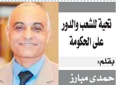
تحية الشعب والدور على الحكومة