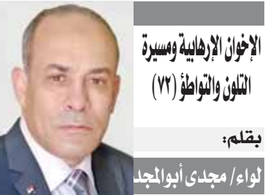
الإخوان الإبراهيمية ومسيرة التلون والنواظف (٢٢)

ووجه الدكتور مصطفى مدبولي، رئيس مجلس الوزراء، الجهات والهيئات المعنية بإعداد حزمة تحفيزية للقطاع الخاص بهدف إلى تشجيع الاستثمار المحلي والأجنبي في هذا القطاع الهام. وقال الدكتور خالد عبدالغفار وزير الصحة، إنه يجري التنسيق بين الوزارة والهيئة العامة للاستثمار، لفتح حزم استثمارية محفزة للقطاع الخاص لضخ مزيد من الاستثمارات بالقطاع الصحي، مضيفاً أن مصر تحتاج على مدى العقد المقبل إلى ضخ