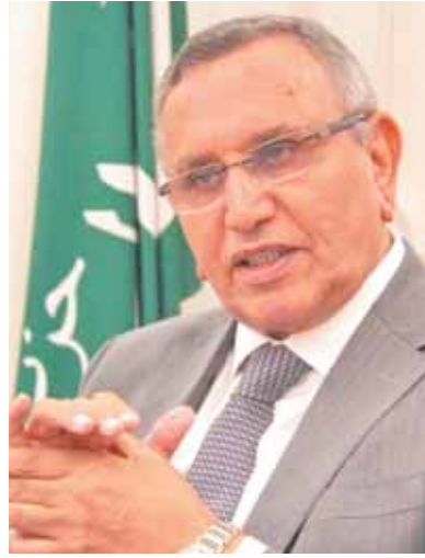
د. عبد السند يمامة

أكد الدكتور عبد السند يمامة رئيس حزب الوفد، أن عيد الجهاد الوطنى سيظل يمثل نبزاساً لكل المصريين فى طريقهم نحو الدفاع عن حقوق الأمة، ويضرب المثل فى التجرد وتكرار الذات فى سبيل الوطن. وقال فى تصريحات خاصة بمناسبة الذكرى ١٠٤ لعيد الجهاد الوطنى، الذى يوافق يوم ١٣ نوفمبر من عام ١٩١٨ إن الوفد أول من تبنى فكرة الاستقلال التام، وطرحها للنقاش بين النخبة المصرية مما جعلها الفكرة الأولى، التى أجمعت عليها مختلف طوائف الأمة المصرية وأولائها السياسية، وكانت سببا فى التمهيد لصدور تصريح الاستقلال فى ٢٨ فبراير عام ١٩٢٢، وظهور مصطلح «الدولة المصرية». وأوضح رئيس الوفد أن فكرة الوفد المصرى كانت أكثر الأفكار الواقعية على مدى الحياة السياسية المصرية الحديثة فى القرن العشرين، فقد كان بمثابة المطلة، التى تجمعت تحتها كل القوى الوطنية فى سبيل الحرية والاستقلال، وهو الكيان الذى جمع عنصرى الأمة واحتضن الهلال الصليب فى أعظم ثورة عرفتها مصر فى العصر الحديث وهى ثورة ١٩١٩، وأن الوفد سيظل «الحارس الأمين» لمصر نحو حياة كريمة وبناء دولة عصرية، تليق بكل أبناء الوطن. وأكد الدكتور عبد السند يمامة أن أقطاب الوفد الثلاثة سعد زغلول وعلى شعراوى وعبد العزيز