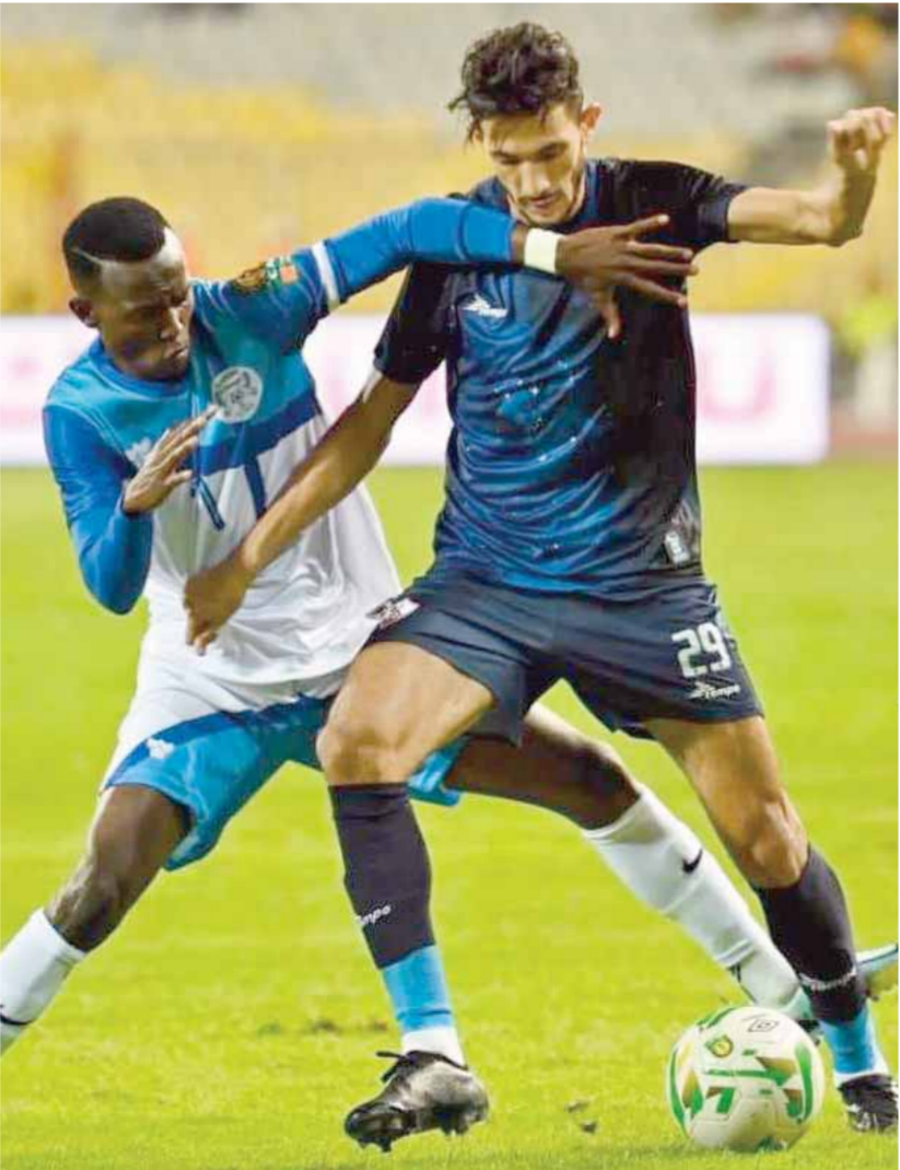
الزمالك يسعى لتكرار فوزه على فلامبو البوروندى