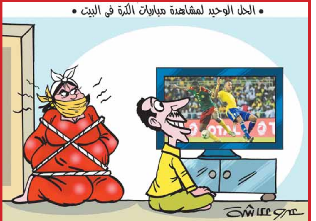
الحل الوحيد لمشاهدة مباريات الكرة في البيت