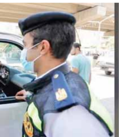
مجلس الوزراء في اجتماعه اليومي