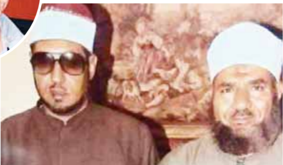
«عمران» مع الشيخ إسماعيل صادق الخطيب الجامع الأزهر