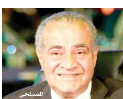
الوزير مصطفى مدبولي

الوزير أحمد كمال بأن مصلحة دمع الموصوغات والموازنين تقوم هي الأخرى بتسيير حملات على محطات الوقود للتأكد من التزامها بالموصفات الموسوعة والموازنين بمحطات الوقود، مشيراً إلى أن الدكتور على المصليحي يتابع مع غرفة عمليات الوزارة ومديريات التموين الموقف على الأرض للأطمثان على انتظام عمل كافة المنشآت التموينية بما فيها محطات الوقود، المخابز، مستودعات البوتاجاز، والمجمعات الاستهلاكية.. الخ، وكذلك متابعه موقف توافر السلع التموينية واستمرار عمليات صرف السلع التموينية من جانب المنافذ.