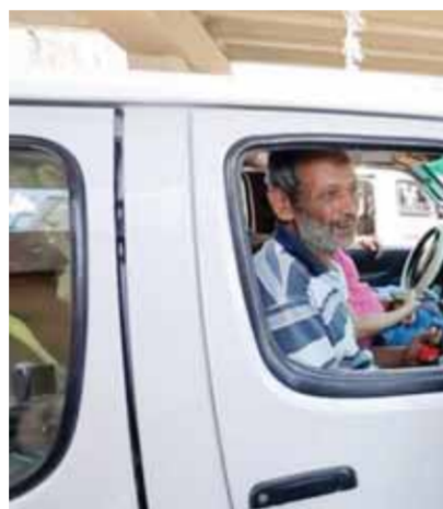
أحد أعضاء مجلس النواب في إحدى جولاته الميدانية

التعليمية، بالإضافة إلى ١٨٠ مليار جنيه لصندوق التأمينات والمعاشات لسداد الأقساط الشهرية المستحقة، و٩٠٠ مليار جنيه لمبادرة «حيوة كريمة»، و١٩٠ مليار جنيه لدعم التقدي لبرنامج تكافل وكرامة، و٩٥٥ مليار جنيه لتمويل جميع احتياجات دعم السلع الغذائية، فضلاً عن ٧٠٧ مليار جنيه مخصصات التغذية المدرسية بنسبة نمو سنوي قدرها ١٢١٪. ولفت إلى أن زيادة المصروفات خلال العام المالي ٢٠٢٢/٢٠٢١ شملت أيضاً زيادة أجور ومرتبات العاملين بأجهزة الموازنة، وتوفير مخصصات كافية لكل بنود الدعم وبرامج الحماية الاجتماعية.