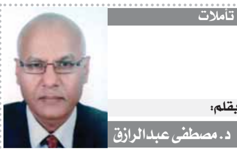
د. مصطفى عبدالرازق

وأشار وزير التنمية المحلية إلى أن الزيادة الجديدة في تعريفة الركوب لوسائل المواصلات داخليا وبين المحافظة والأخرى ستكون ما بين ٥٪ إلى ٧٪ على جميع الخطوط الداخلية بالمحافظة والخارجية بين المحافظات على أن يتم إعلان التعريفات الجديدة صباح الأربعاء مع تعليقها بكافة المواقف وتكون بصورة واضحة. كما وجه شعراوي بقيام المحافظين بالمرور على مواقع التسعير ومحطات الوقود للتأكد من انتظام العمل بالمواقف وعدم استغلال المواطنين، مع التنبية على القيادات التنفيذية بالمرور على مدار اليوم للمتابعة والتعامل بحسم مع أي مخالقات لسائقي السرفيس والنقل الجماعي واتخاذ الإجراءات القانونية وتحرير محاضر للمخالفين. وشدد وزير التنمية المحلية على ضرورة التأكيد على وضع اللصيق الخاص بسيارات السرفيس والنقل الجماعي والمتضمن خط السير والأجرة المقررة وفقا للزيادات الجديدة لعدم قيام قاندى السيارات بزيادة تعريفة الركوب بصورة منفردة أو تقسيم خطوط السرفيس لسيارات النقل الجماعي والسرفيس والتقسيم خط السير.