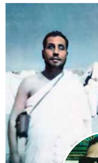
«عمران»، بملابس الإحرام