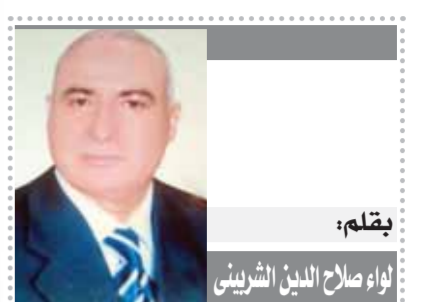
بقلم: إياد صلاح الدين الشربيني