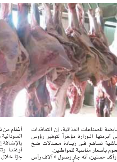
القابضة للصناعات الغذائية، إن التعاقدات التي أبرمتها الوزارة مؤخرا لتوفير رؤوس ماشية تتسامح في زيادة معدلات ضخ الحوم بأسعار مناسبة للمواطنين.

أعلنت وزارة التموين والتجارة الداخلية عن استلام ٥ آلاف رأس ماشية من جيبيوت كدفعة أولى من إجمالي الكمية المتفق عليها والتي تبلغ ١٢ ألف رأس ماشية، ويتم طرح كيلو الحوم المستوردة من جيبيوت بسعر ١٩٥ جنيهًا. كما سيتم طرح ٥ آلاف طن لحوم برازيلية مجمدة بسعر ١٦٠ جنيهاً و١٠٠٠ طن لحوم مجمدة هندية سعر الكيلو ١٣٠ جنيهاً. وقال الدكتور على المصطفي، وزير التموين والتجارة الداخلية، إن فتح الاعتماد المالي بقيمة ١٠ ملايين دولار ساهم في زيادة كميات رؤوس الماشية المتعاقد عليها من جيبيوت إلى ١٢ ألف رأس، لافتاً إلى أنه سيتم استئصال شحنت جديدة خلال الأيام المقبلة وضخها بالمنافذ فور وصولها.