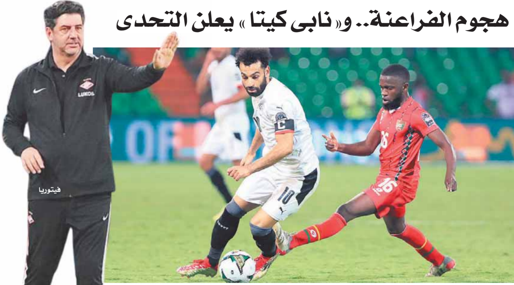
صلاح يقود المنتخب أمام غينيا-

ويتمتع منتخبنا الوطنى على تشكيلته تضم حارس المرمى محمد الشناوى وأمامه الرباعى محمد عبدالنعم ويسار إبراهيم ومحمد هانى ومحمد حمدي وأحمد أبوالتوفى فى خط الدفاع. ويقود خط الوسط محمود حمادة ومرؤان عطية وأحمد مصطفى زيزو مع ثلاثى الهجوم محمد صلاح