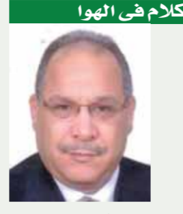
كلام في الهوا