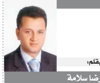
يقلم: رضا سلامة

أساتذتنا الكرام وكل هيئة التجارة جامعة في سويف السائق عضو الهيئة العليا للحزب