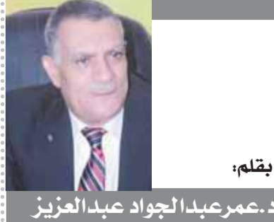
يقلم: د.عمرعبد الجواد عبدالعزيز